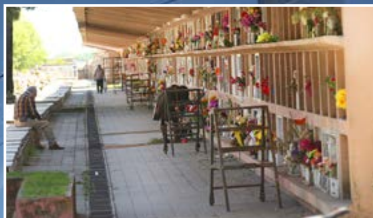
ARREGLOS FLORALES son la tradición principal a la hora de llevar obsequios a personas sepultadas.