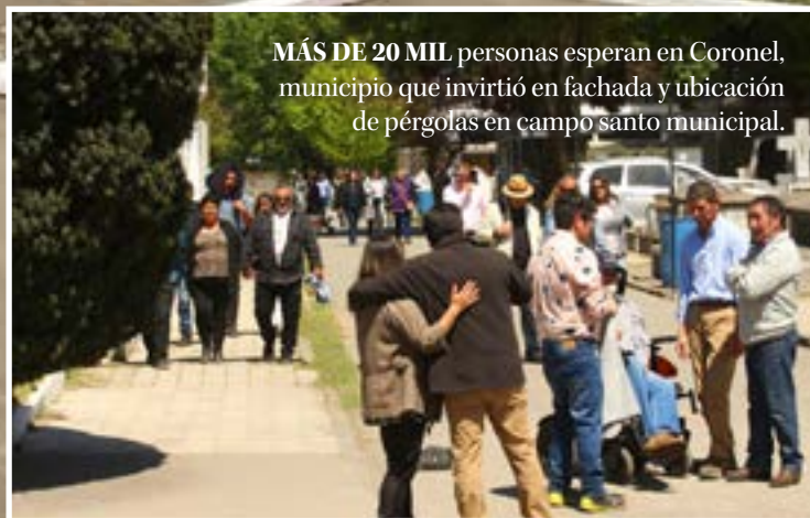
MÁS DE 20 MIL personas esperan en Coronel, municipio que invirtió en fachada y ubicación de pérgolas en campo santo municipal.