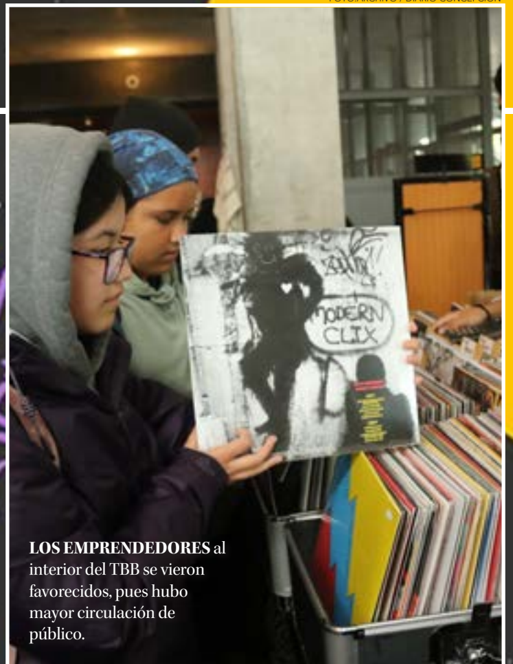
LOS EMPRENDEDORES al interior del TBB se vieron favorecidos, pues hubo mayor circulación de público.

En la sala principal del Teatro Biobío también el programa seguía con normalidad. Partió con la obra "Llacolén", y mientras se desarrollaba en los escenarios del Parque Bicentenario se veía a personal retirando equipos, cables y otros elementos de la parte técnica. Ahí comenzó a surgir la información que, finalmente, no se realizaría ningún espectáculo al aire libre durante la primera jornada del REC.