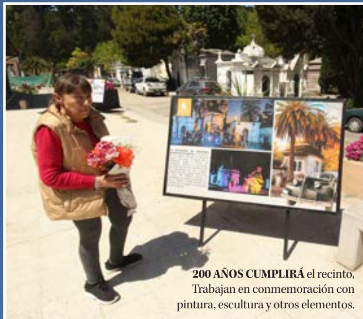
200 AÑOS CUMPLIRÁ el recinto, Trabajan en conmemoración con pintura, escultura y otros elementos.

Tradición lleva a miles de personas a visitar a sus seres queridos fallecidos. Campos santos de Concepción y Talcahuano preparan detalles.