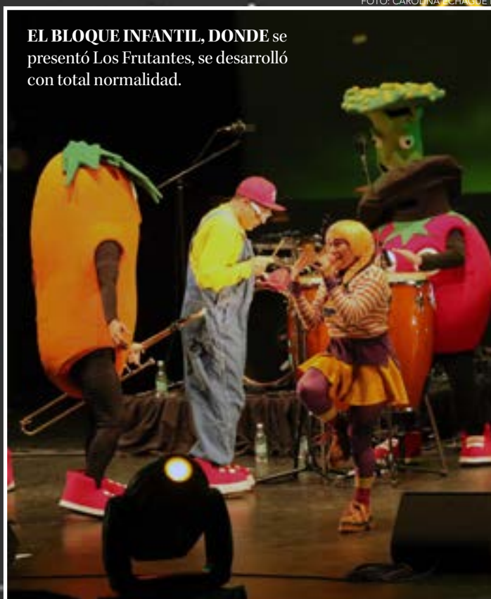
EL BLOQUE INFANTIL, DONDE se presentó Los Frutantes, se desarrolló con total normalidad.

En el Lanalhue, primero estará Mantarraya, luego Pedropiedra y cierra Candlebox, mientras en el Antuco se presentarán Francisca Valenzuela, Juanes y Café Tacvba.