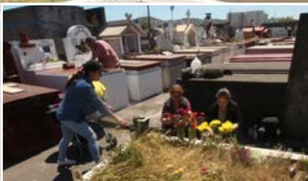
EN TALCAHUANO esperan sobre 40 mil visitantes entre sus cementerios municipales 1 y 2.