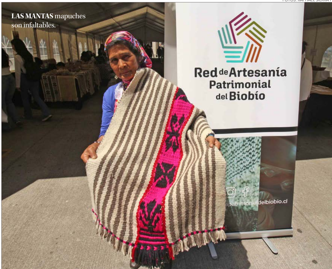
LAS MANTAS mapuches son infaltables.