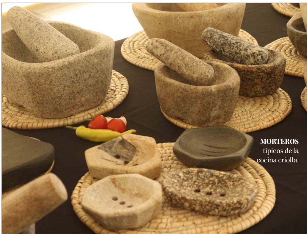
MORTEROS típicos de la cocina criolla.