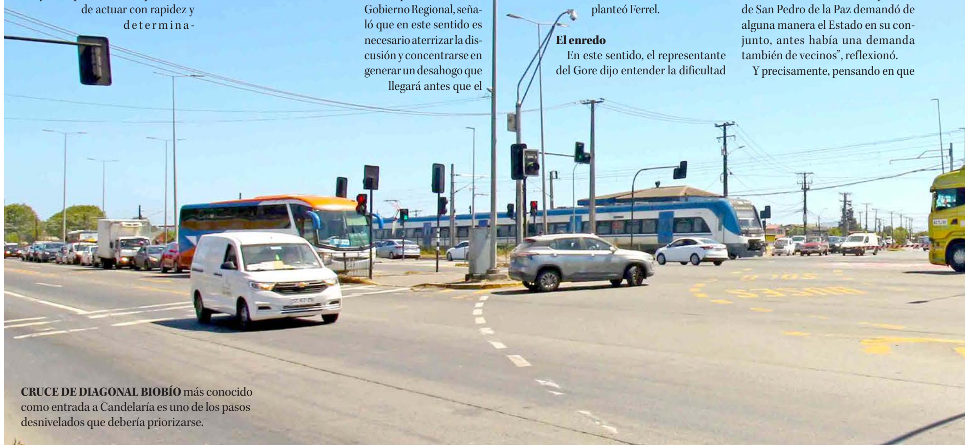
CRUCE DE DIAGONAL BIOBÍO más conocido como entrada a Candelaría es uno de los pasos desnivelados que debería priorizarse.