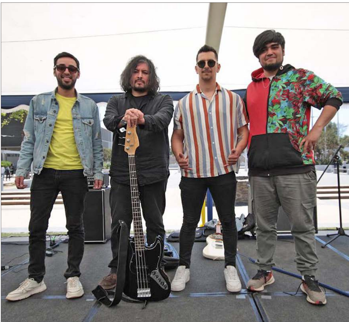
DIGITAL ARCADE, una de las bandas que se presentó en la Feria Puertas Abiertas

“En estos años como monitor he podido ver un sinnúmero de historias de estudiantes que se esfuerzan en poder llegar a ser profesionales, siendo quizá el primer profesional de la familia. Cuando uno llega a la casa y se da cuenta que pudiste orientarlo de alguna manera, es una satisfacción muy grande”, sentenció.