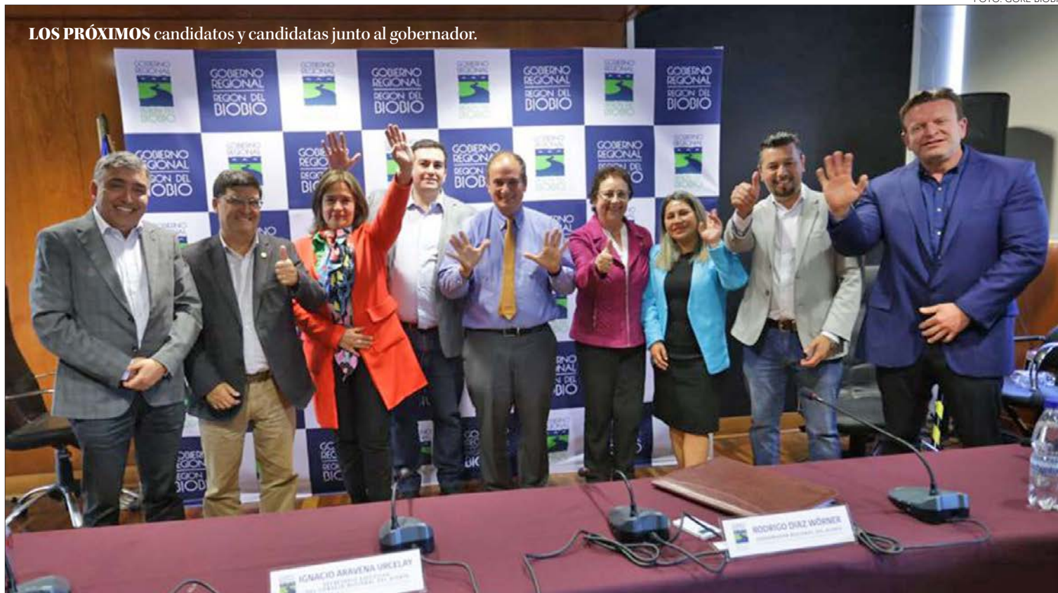
LOS PRÓXIMOS candidatos y candidatas junto al gobernador.

Sebastián Rojas Guerstein contacto@diarioconcepcion.cl