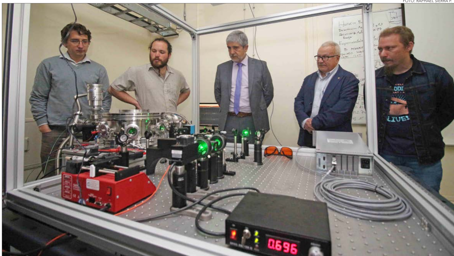
EL LAMP funcionará en el segundo piso de la Facultad de Ciencias Físicas y Matemáticas de la UdeC.