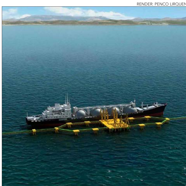
RENDER: PENCO LIRQUEN

El organismo decidió mantener la aprobación de la Resolución de Calificación Ambiental de 2019.