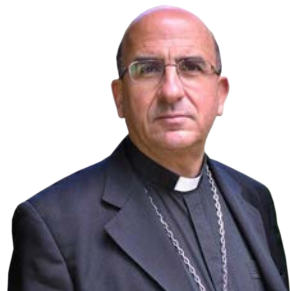
FERNANDO CHOMALI G Electo Arzobispo de Santiago.

Comprometo mi oración por ustedes en la misa diaria y les pido que recen por mí y el Papa Francisco. La Iglesia es una, en Concepción, en Santiago, o donde sea.