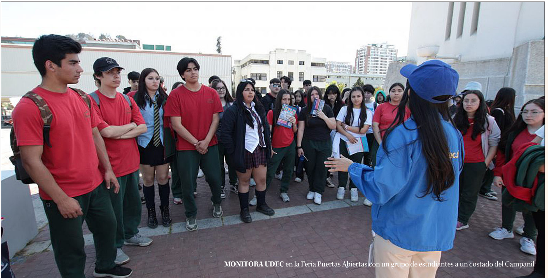
MONITORA UDEC en la Feria Puertas Abiertas con un grupo de estudiantes a un costado del Campanil

na, por lo que el año 2022 y el presente cursa un preuniversitario, en el que se está enfocando en matemáticas. “La Universidad de Concepción tiene un gran prestigio y es mi primera opción. Mi sueño es especializarme en Psiquiatría”, señaló.