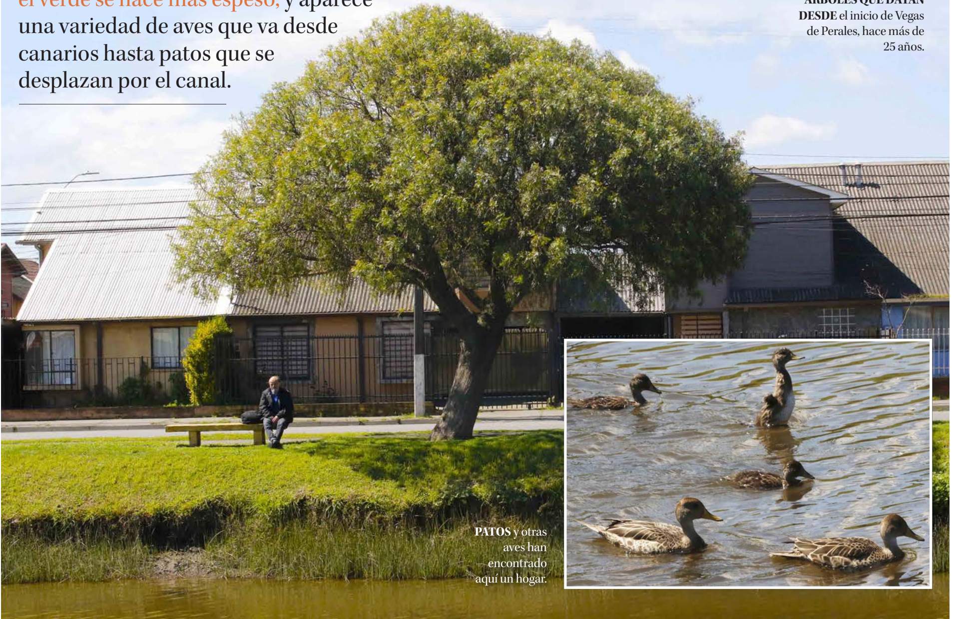
ÁRBOLES QUE DATAN DESDE el inicio de Vegas de Perales, hace más de 25 años.