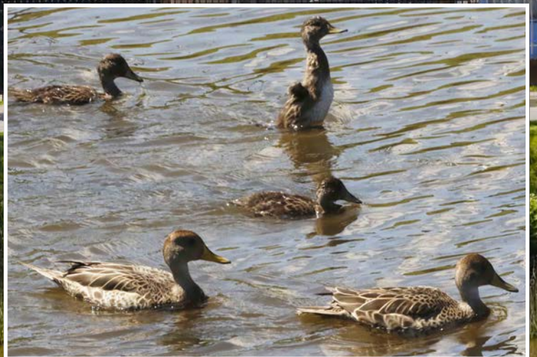
PATOS y otras aves han encontrado aquí un hogar.