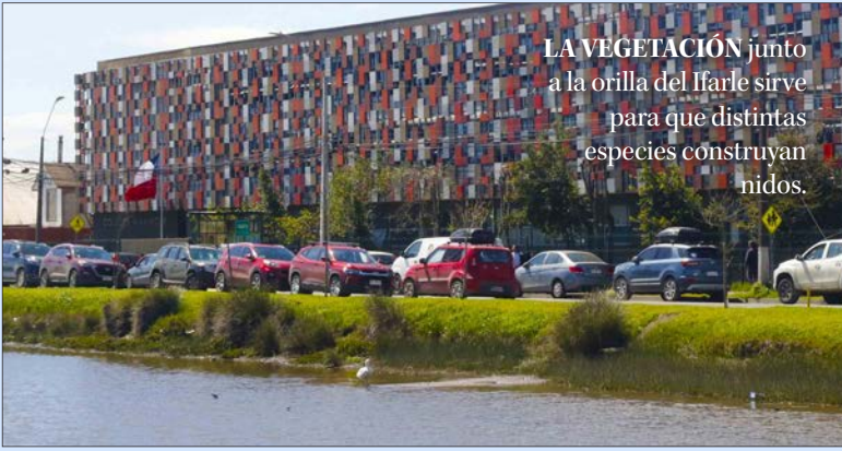
LA VEGETACIÓN junto a la orilla del Ifarle sirve para que distintas especies construyan nidos.