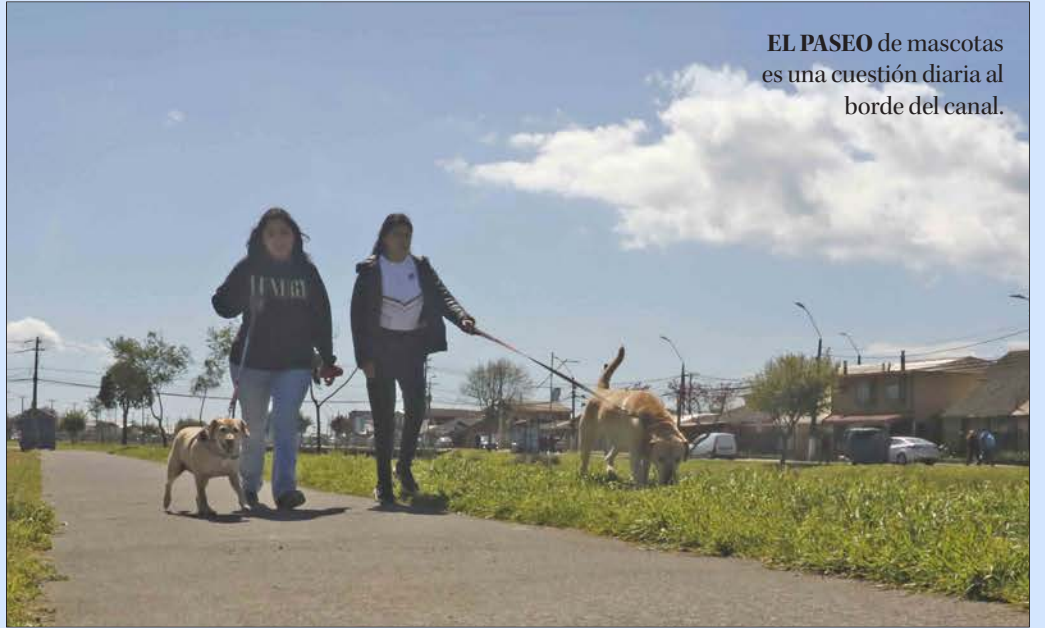
EL PASEO de mascotas es una cuestión diaria al borde del canal.

Es a la altura de Vegas de Perales donde el verde se hace más espeso, y aparece una variedad de aves que va desde canarios hasta patos que se desplazan por el canal.