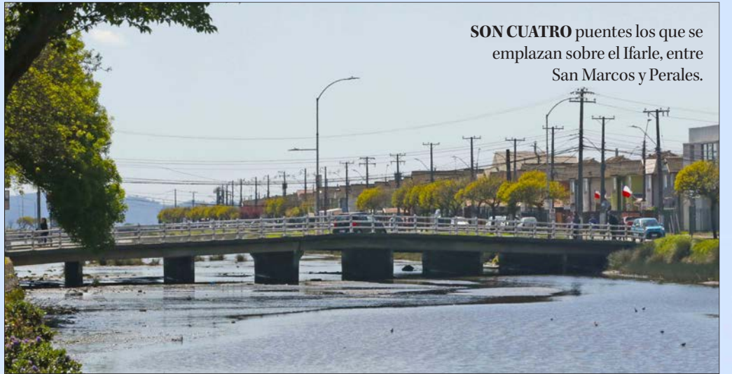
SON CUATRO puentes los que se emplazan sobre el Ifarle, entre San Marcos y Perales.