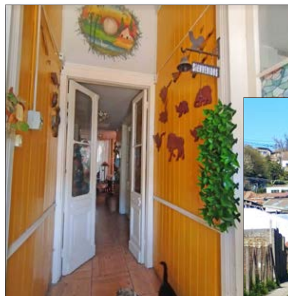
EL INTERIOR de uno de los tesoros arquitectónicos del puerto.

Destaca por sus casas estilo francés. En sus inicios fue el punto residencial de los profesionales europeos que llegaron a la ciudad a trabajar en la construcción de Asmar.