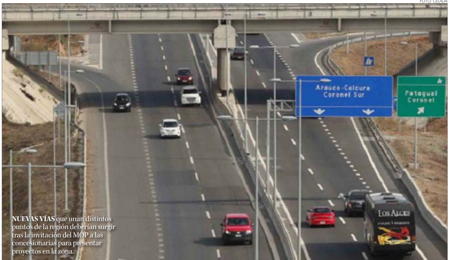
NUEVAS VÍAS que unan distintos puntos de la región deberían surgir tras la invitación del MOP a las concesionarias para presentar proyectos en la zona.