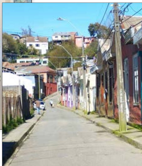
ESTÁ A LOS PIES del Cerro David Fuentes.