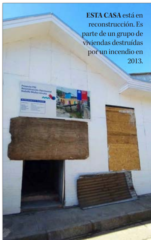
ESTA CASA está en reconstrucción. Es parte de un grupo de viviendas destruidas por un incendio en 2013.