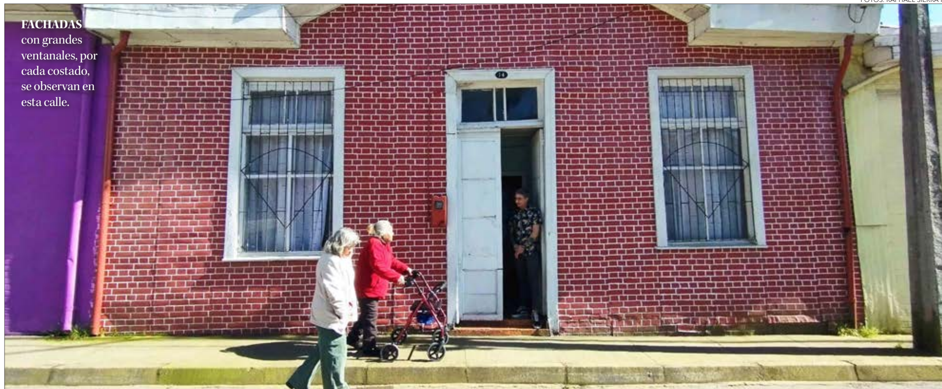
FACHADAS con grandes ventanales, por cada costado, se observan en esta calle.