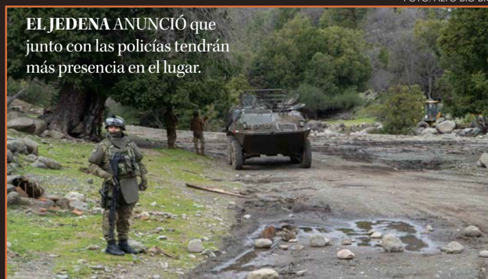
EL JEDENA ANUNCIÓ que junto con las policías tendrán más presencia en el lugar.

Twitter @DiarioConce contacto@diarioconcepcion.cl