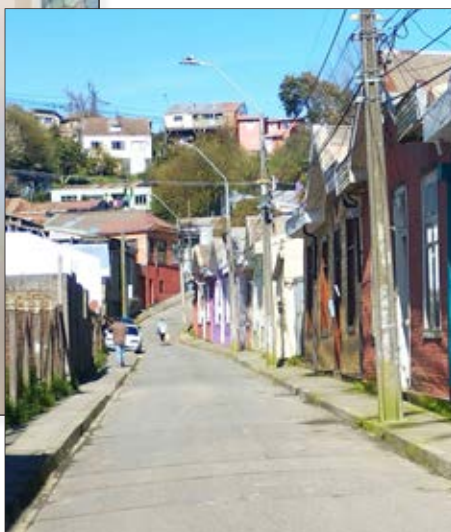
ESTÁ A LOS PIES del Cerro David Fuentes.