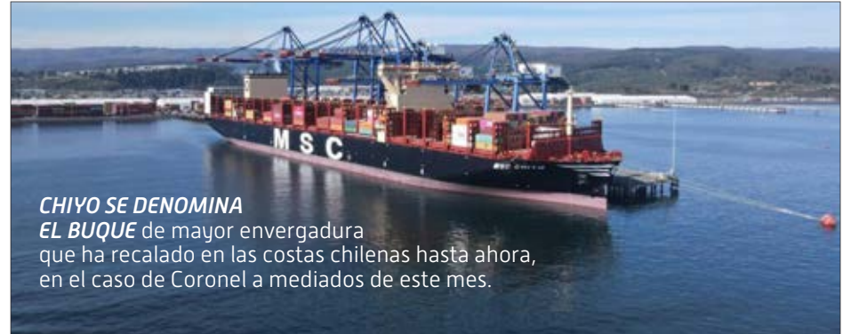
CHIYO SE DENOMINA EL BUQUE de mayor envergadura que ha recalado en las costas chilenas hasta ahora, en el caso de Coronel a mediados de este mes.

Puerto Coronel es el principal generador de empleo en la comuna, con más de 1.500