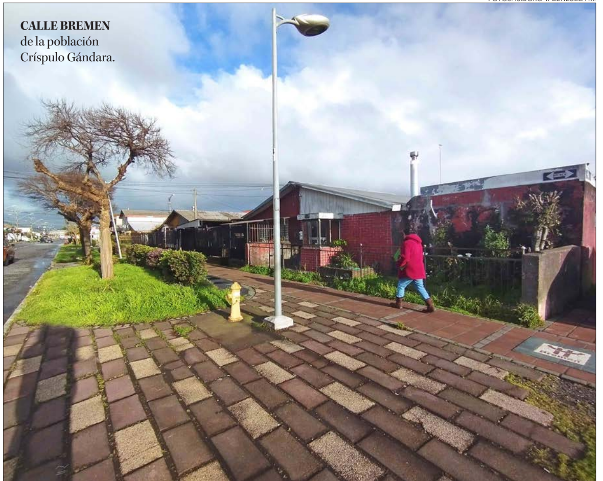
CALLE BREMEN de la población Crispulo Gándara.