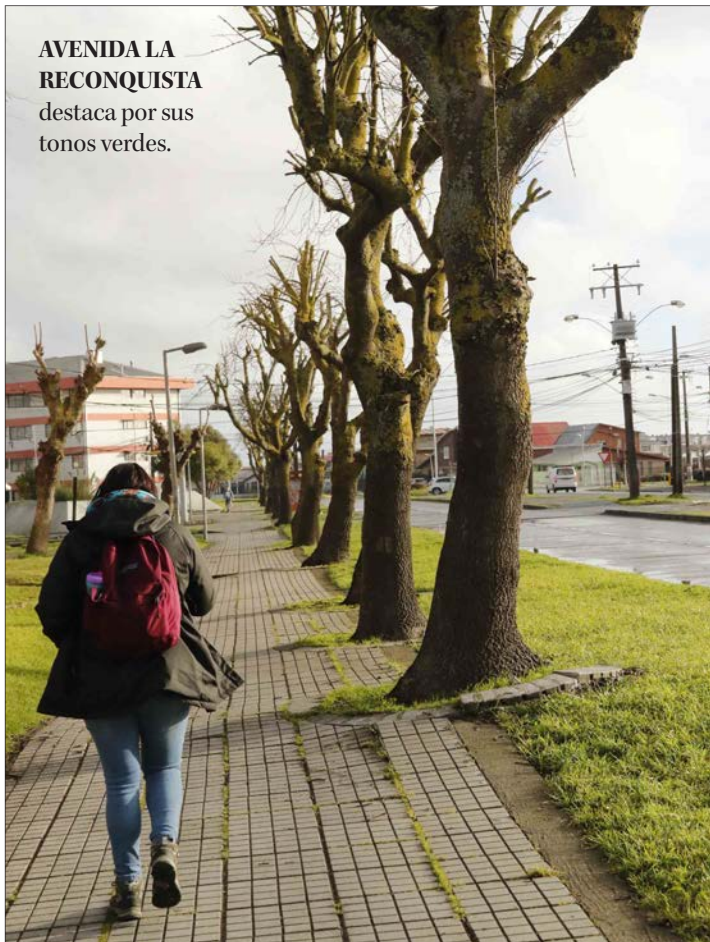
AVENIDA LA RECONQUISTA destaca por sus tonos verdes.