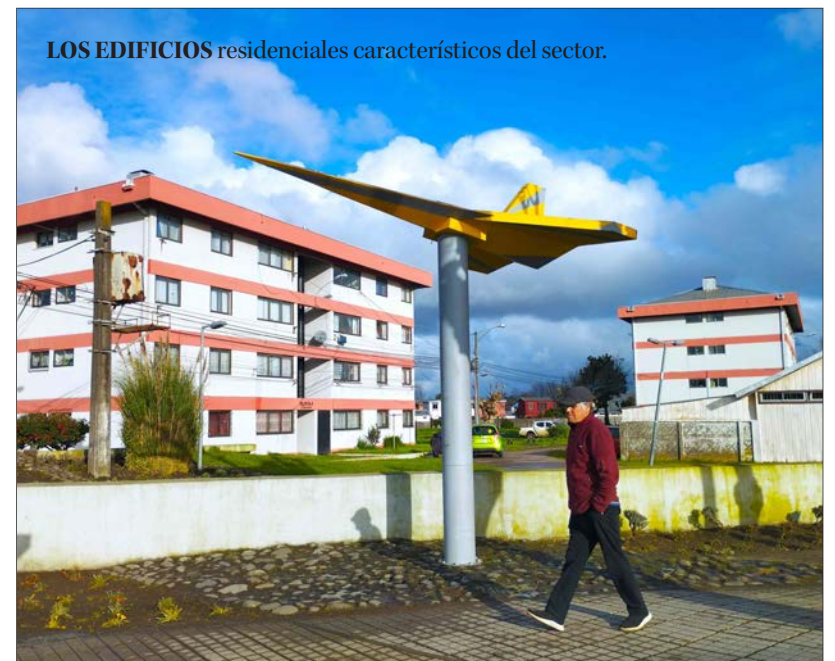
LOS EDIFICIOS residenciales característicos del sector.

Adoptó el nombre de uno de los más destacados payadores y cantores populares de la Región. Este sector hualpenino además destaca por su vínculo con el deporte.