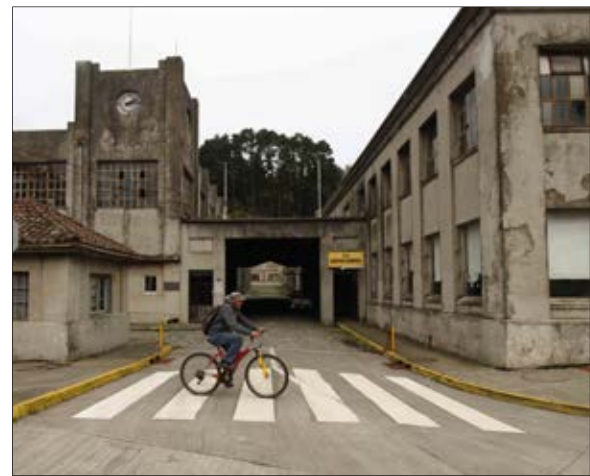
INGRESO a las emblemáticas instalaciones de Bellavista Tomé.

Sus calles son la gran bienvenida a la ciudad. Todos sus rincones acogen la historia ligada a la actividad textil, la que durante años fue el gran motor de la comuna.