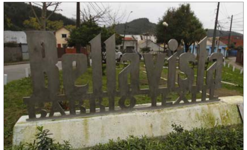
ESTE TÓTEM da cuenta del inicio del Barrio Textil.