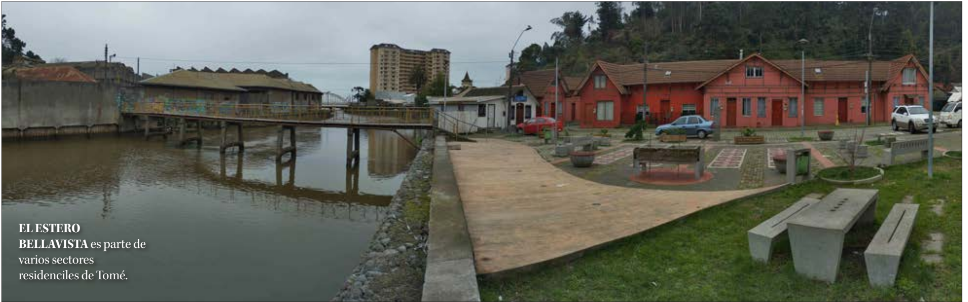
EL ESTERO BELLAVISTA es parte de varios sectores residenciales de Tomé.