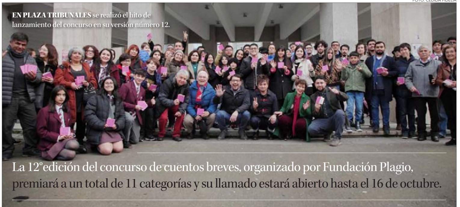
EN PLAZA TRIBUNALES se realizó el hito de lanzamiento del concurso en su versión número 12.

Así la Plaza de Tribunales fue el punto neurálgico donde se realizó este lanzamiento, lugar donde se entregaron a los transeúntes ejemplares del libro con los mejores 100 cuentos de la convocatoria realizada