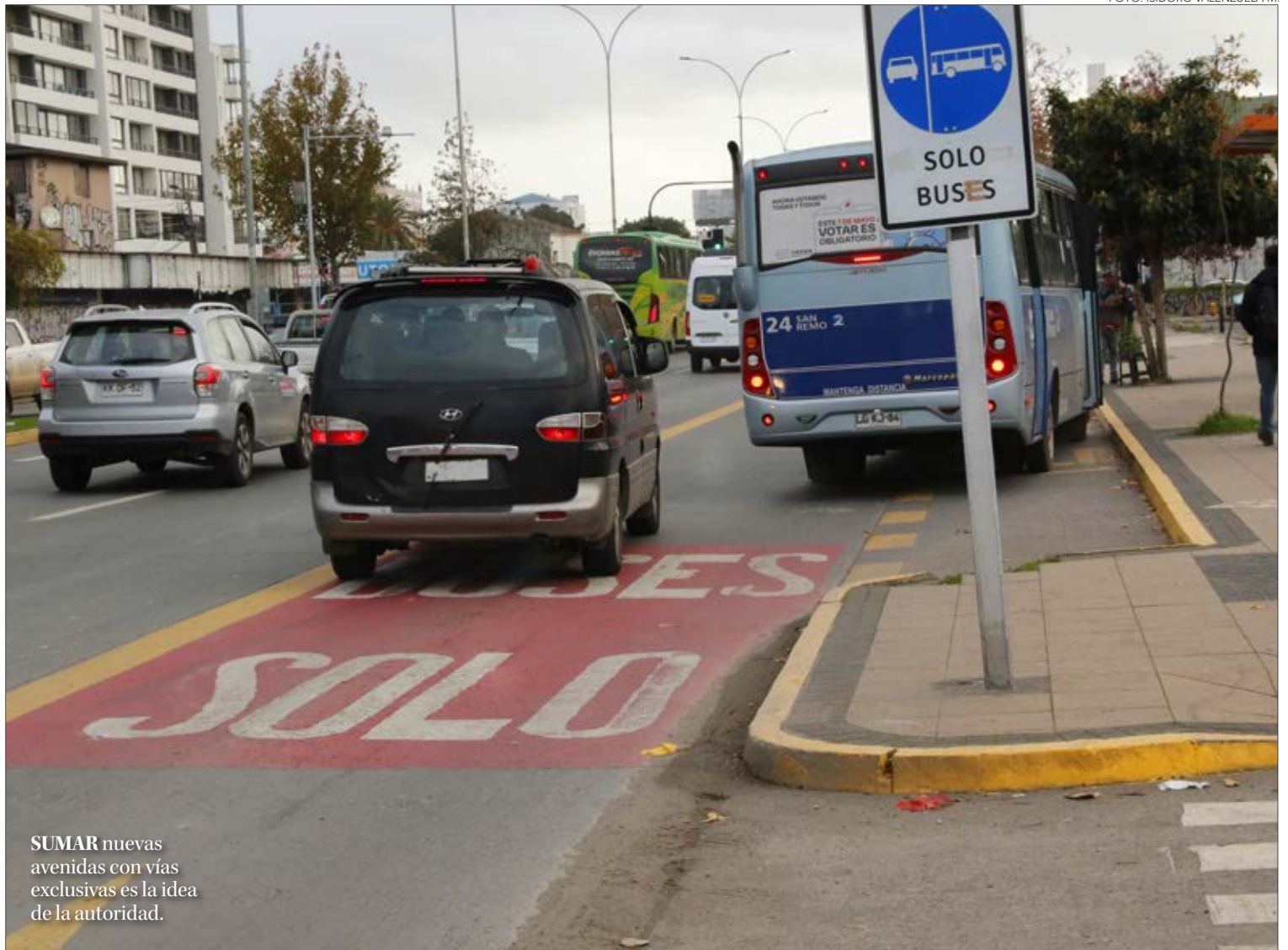
SUMAR nuevas avenidas con vías exclusivas es la idea de la autoridad.