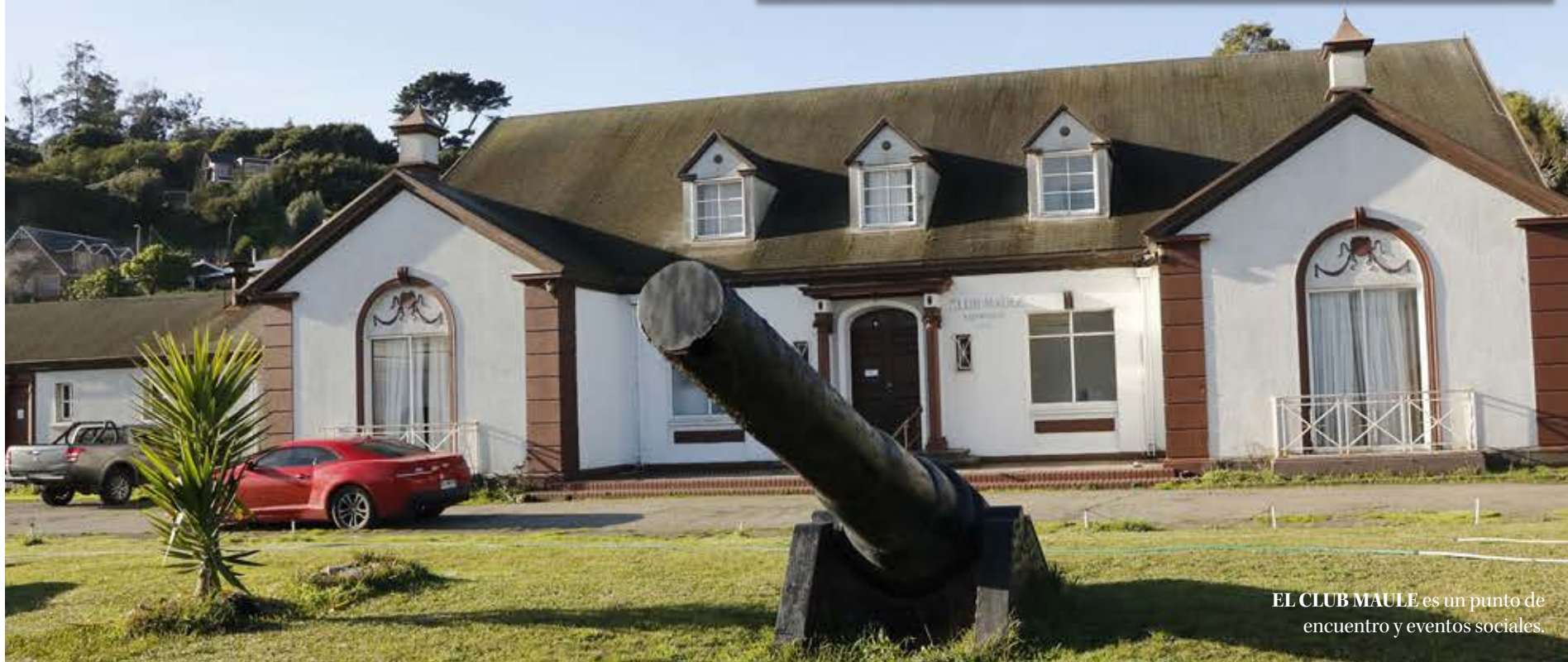
EL CLUB MAULE es un punto de encuentro y eventos sociales.