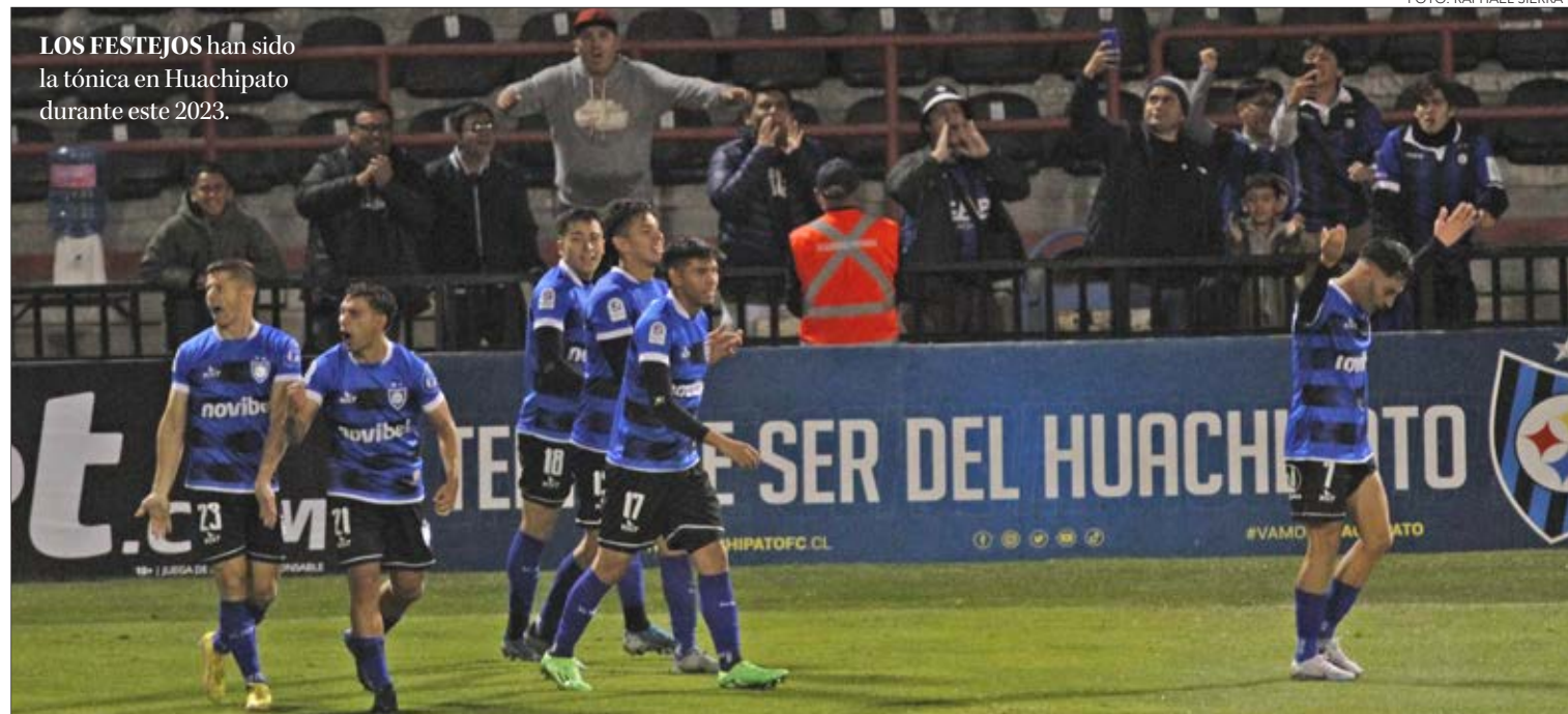
LOS FESTEJOS han sido la tónica en Huachipato durante este 2023.