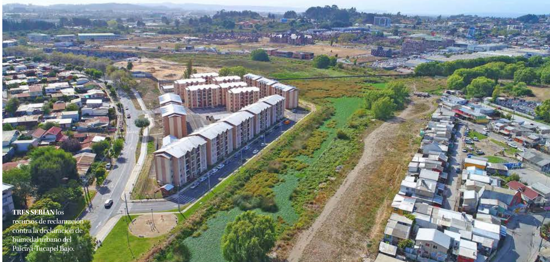
TRES SERÍAN los recursos de reclamación contra la declaración de humedal urbano del Paicaví-Tucapel Bajo.

Twitter @DiarioConce contacto@diarioconcepcion.cl