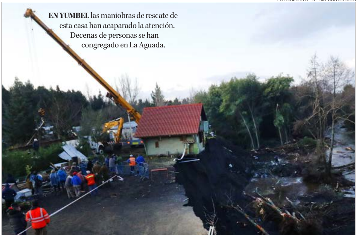
EN YUMBEL las maniobras de rescate de esta casa han acaparado la atención. Decenas de personas se han congregado en La Aguada.