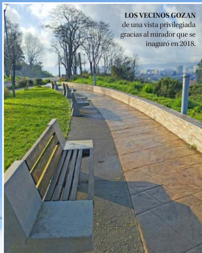
LOS VECINOS GOZAN de una vista privilegiada gracias al mirador que se inauguró en 2018.