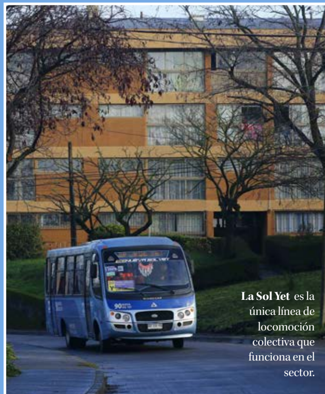
La Sol Yet es la única línea de locomoción colectiva que funciona en el sector.

Edificios residenciales, agrupados entre espacios comunes y áreas verdes, se distribuyen en uno de los sectores altos de la ciudad. Desde ahí se aprecia gran parte del centro penquista, Lorenzo Arenas y alrededores.