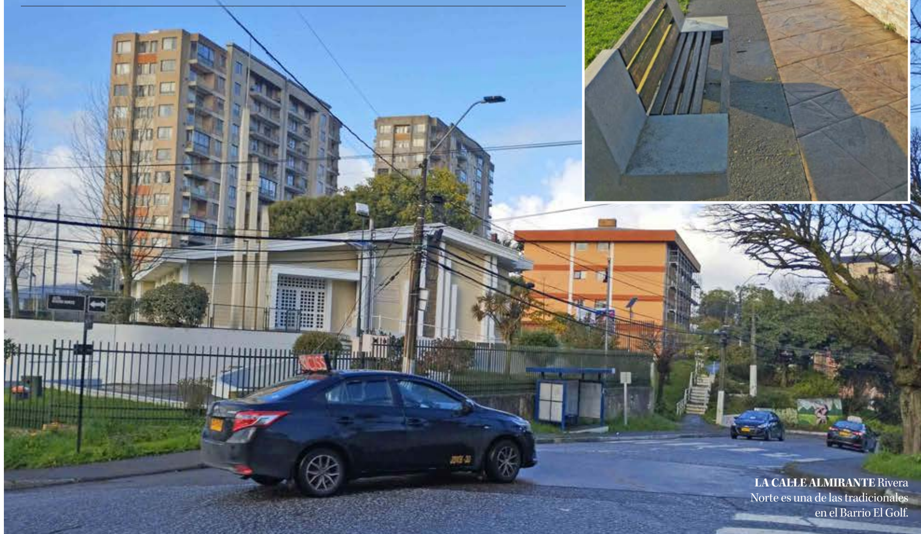
LA CALLE ALMIRANTE Rivera Norte es una de las tradicionales en el Barrio El Golf.