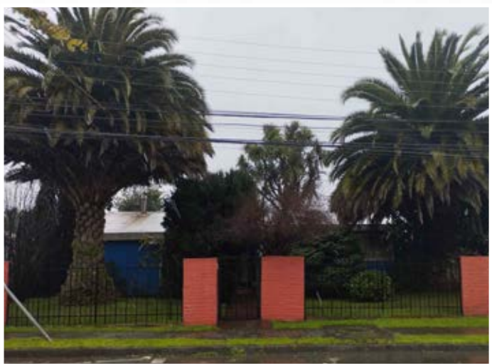
ANTIGUAS PALMERAS en el sector, reflejan los años de existencia de Villa Acero.