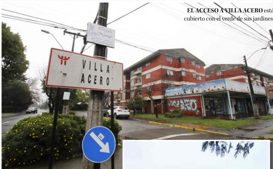
EL ACCESO A VILLA ACERO está cubierto con el verde de sus jardines.

Tranquila zona residencial entrega un paisaje que es adornado por viviendas y áreas verdes. Jardines y plazas de juego sirven de escenario para que familias convivan entre sí.