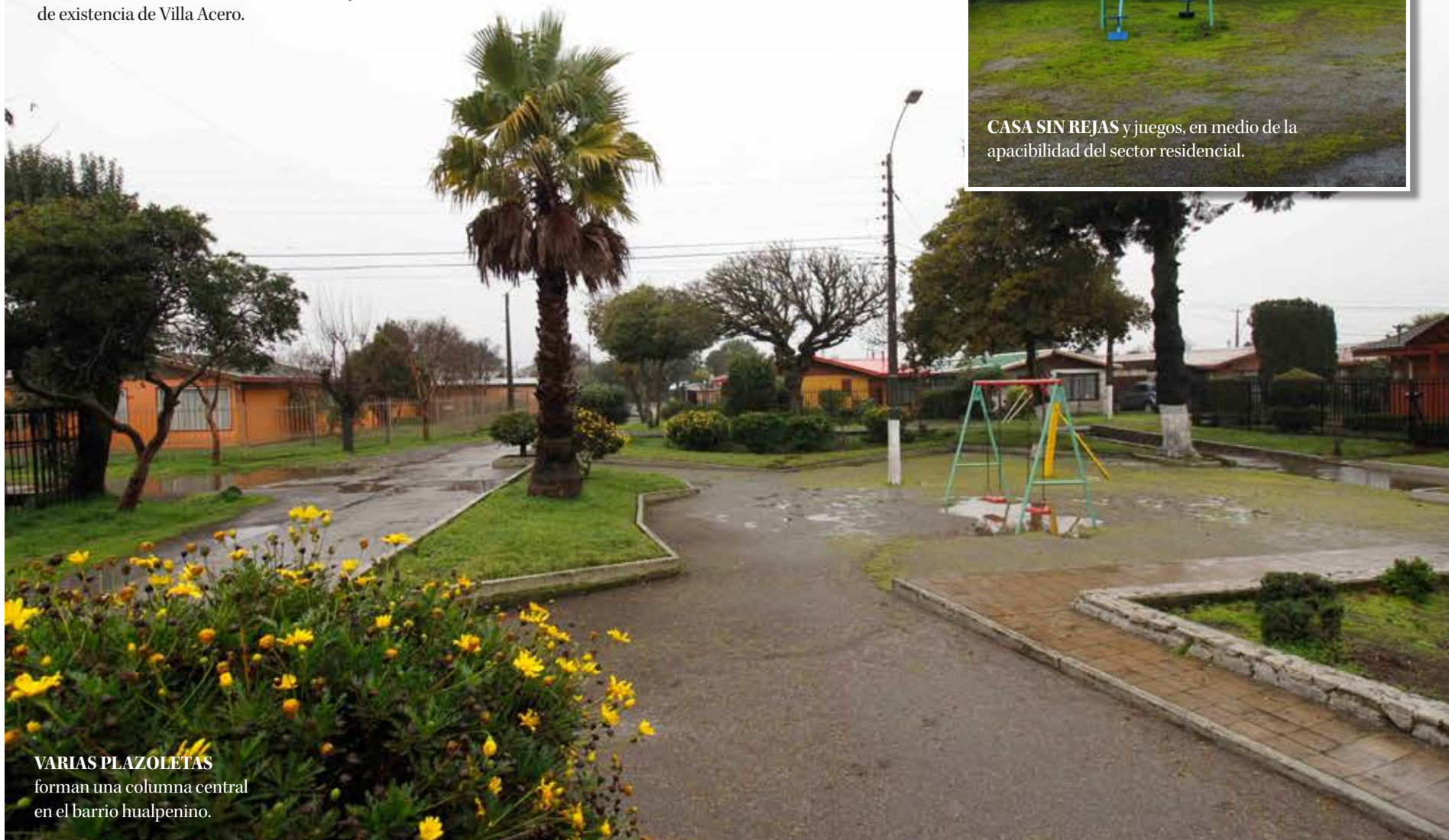
VARIAS PLAZOLETAS forman una columna central en el barrio hualpenino.