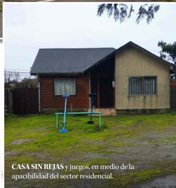
CASA SIN REJAS y juegos, en medio de la apacibilidad del sector residencial.