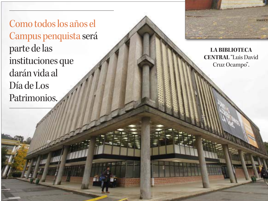
LA BIBLIOTECA CENTRAL "Luis David Cruz Ocampo".