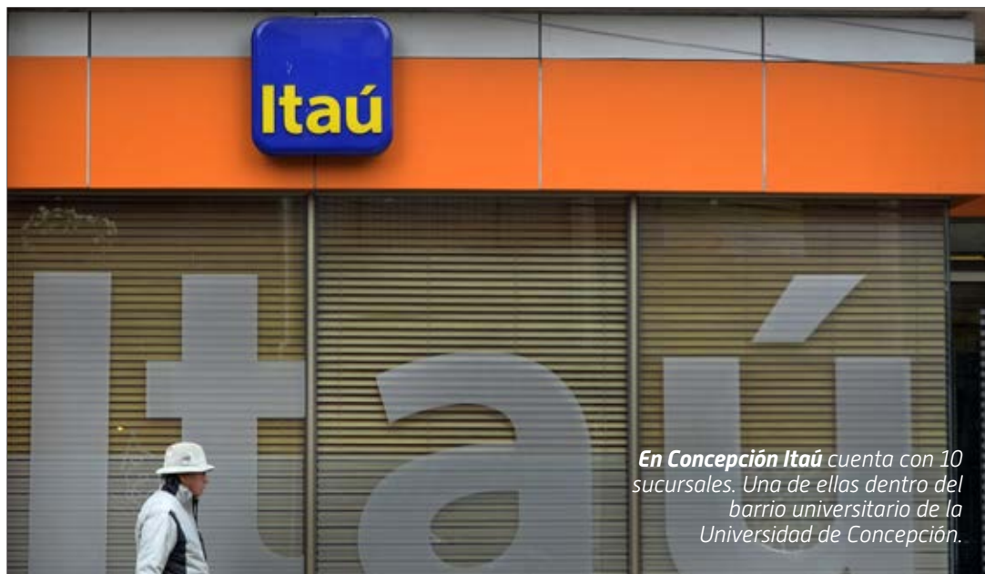
En Concepción Itaú cuenta con 10 sucursales. Una de ellas dentro del barrio universitario de la Universidad de Concepción.

Una delegación de ejecutivos de Grandes Empresas de Banco Itaú, encabezados por el gerente del área, visitó la Región del Biobío para reunirse con algunos de sus clientes.