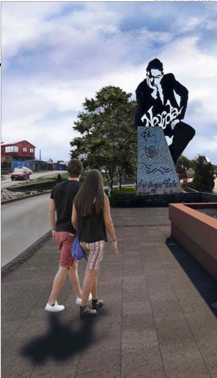
OTRA IMAGEN digital del plano y diseño de las obras a ejecutar.

con el Impuesto al Valor Agregado (IVA) incluido y cualquier otro derecho o pago que el contratista adjudicado deba hacer para la ejecución total y completa de la misma.