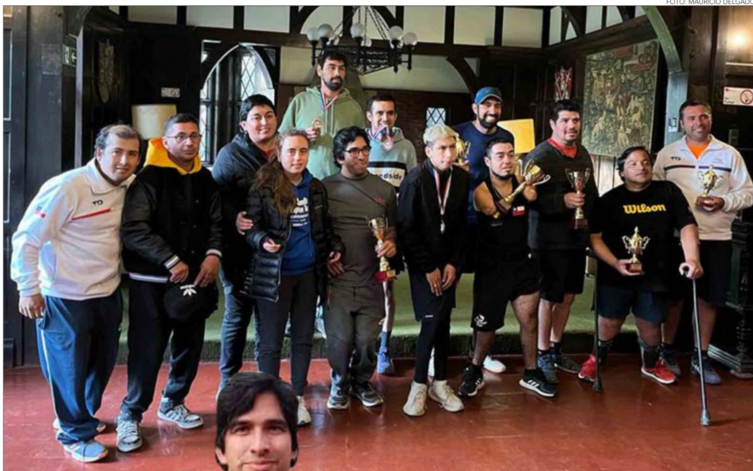
LOS GANADORES DE las diferentes categorías en Valparaíso.

Fue en esta clase donde comenzó a especializarse, apoyado por el Es-