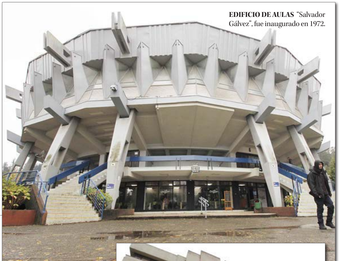
EDIFICIO DE AULAS "Salvador Gálvez", fue inaugurado en 1972.