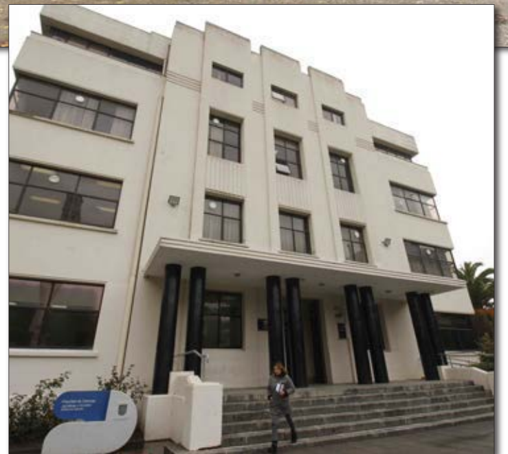
EDIFICIO DE LA FACULTAD DE Ciencias Jurídicas y Sociales, se ubica junto al Foro y Campanil.

Como todos los años el Campus penquista será parte de las instituciones que darán vida al Día de Los Patrimonios.