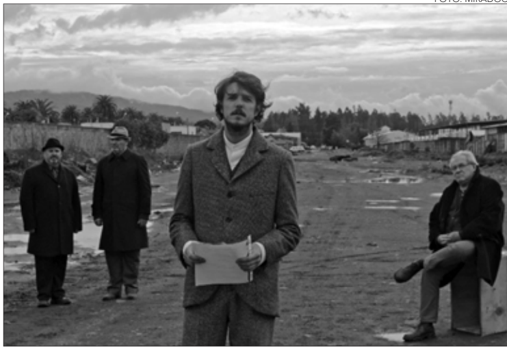
EL FILM está inspirado en el libro "Diez años en Araucanía 1889-1899".