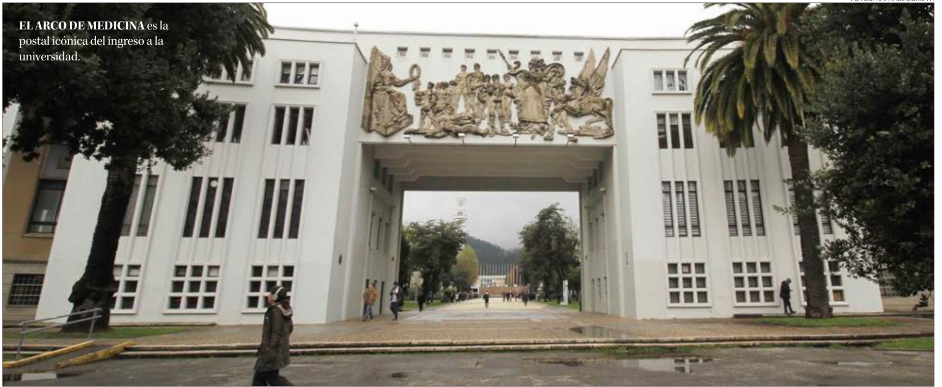
EL ARCO DE MEDICINA es la postal icónica del ingreso a la universidad.