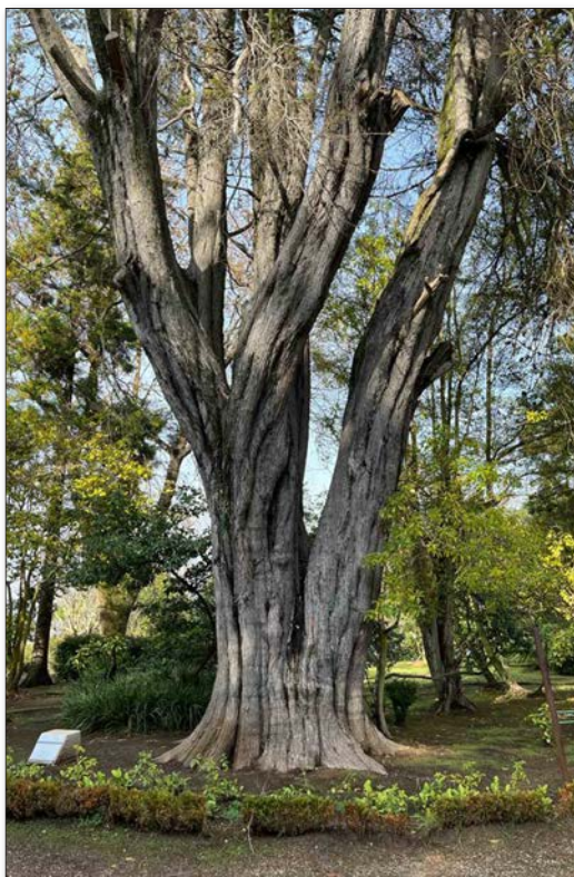
ÁRBOLES DE LARGA DATA y de distintas especies se encuentran en este lugar.

Es uno de lo más reconocidos Monumentos Históricos de la Región del Biobío. Fue diseñado entre 1862 y 1872.