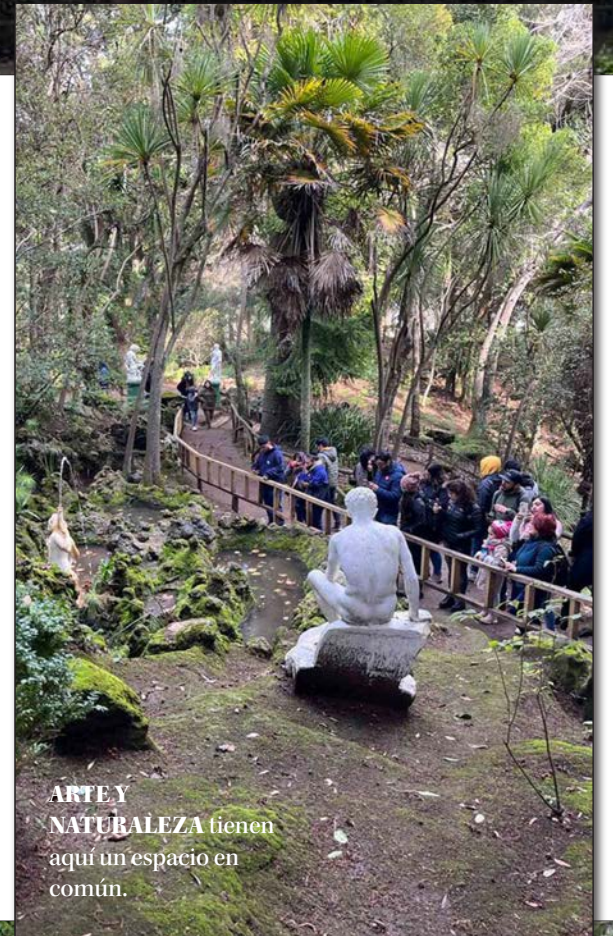
ARTE Y NATURALEZA tienen aquí un espacio en común.