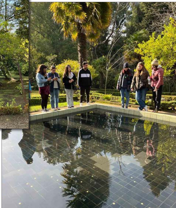
TURISTAS de todas partes de la Región y del país llegan a este punto lotino.

Es uno de lo más reconocidos Monumentos Históricos de la Región del Biobío. Fue diseñado entre 1862 y 1872.