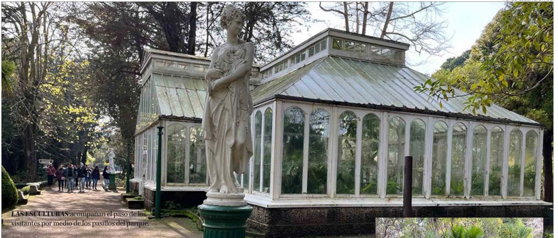
LAS ESCULTURAS acompañan el paso de los visitantes por medio de los pasillos del parque.

LUIS COUSIÑO SQUELLA LO REGALÓ A SU ESPOSA ISIDORA GOYENECHEA