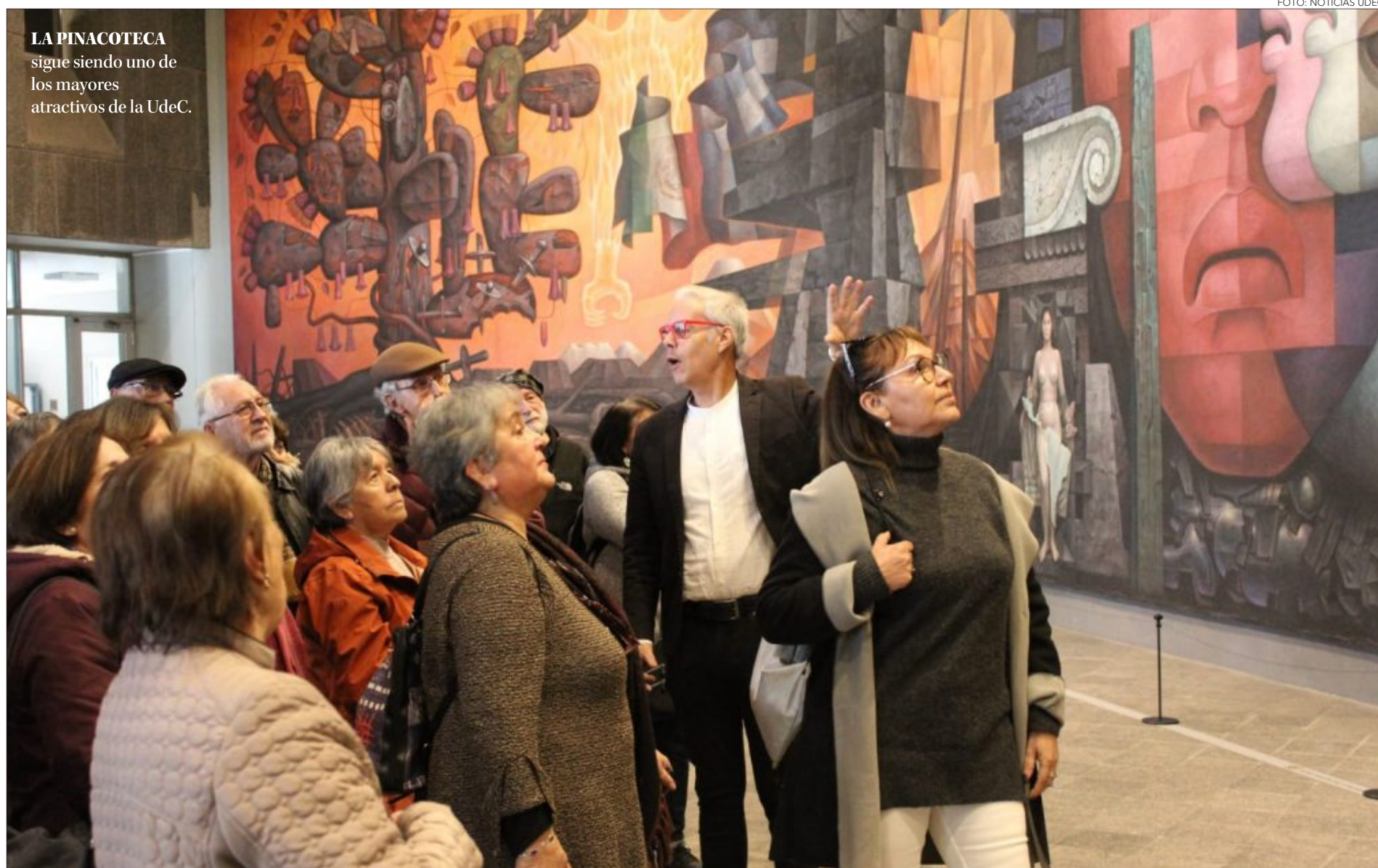
LA PINACOTECA sigue siendo uno de los mayores atractivos de la UdeC.