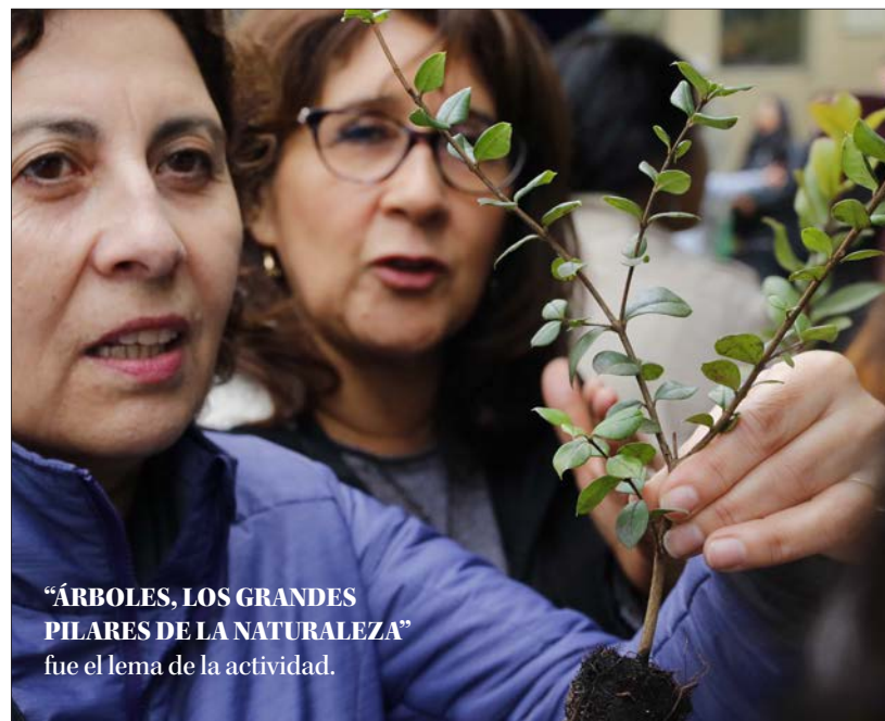
“ÁRBOLES, LOS GRANDES PILARES DE LA NATURALEZA” fue el lema de la actividad.