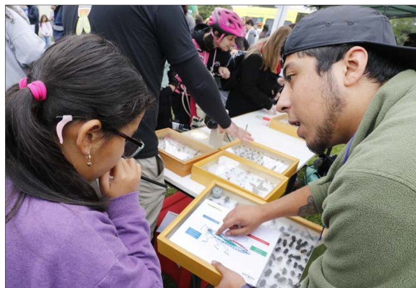
CUIDADO DEL MEDIO AMBIENTE fue otra de las temáticas del evento en la casa de estudios.