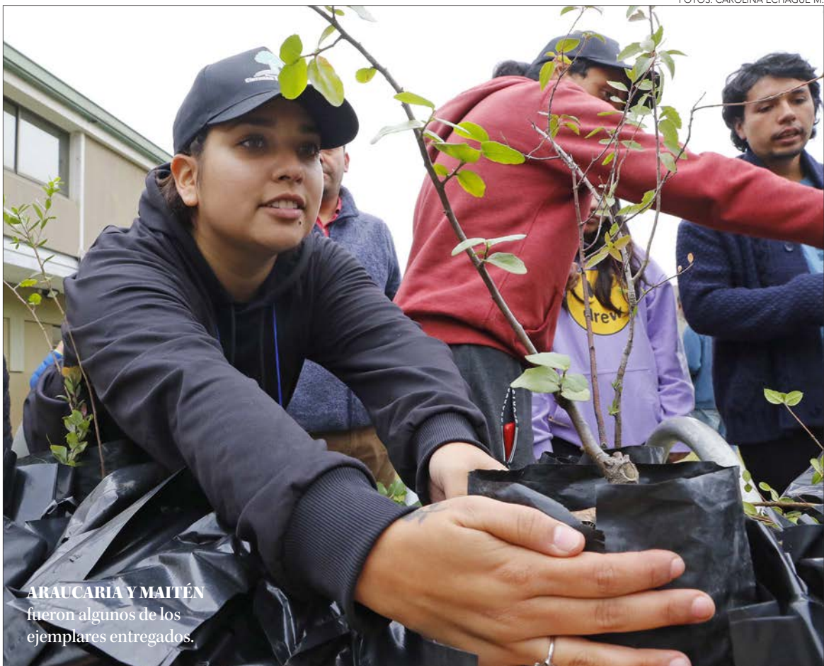
ARAUCARIA Y MAITÉN fueron algunos de los ejemplares entregados.