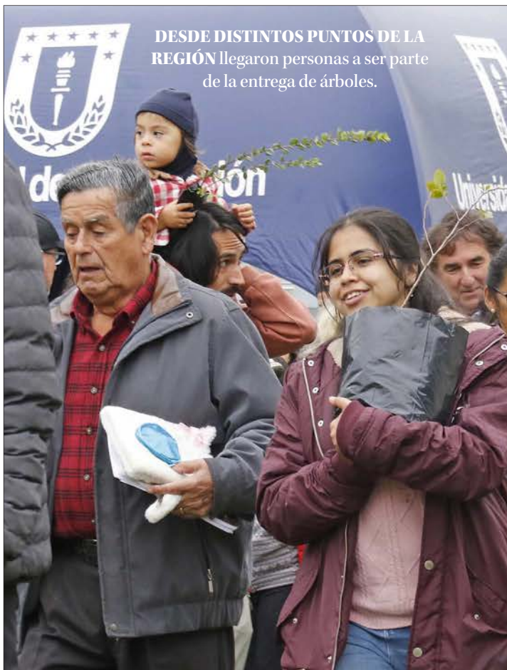
DESDE DISTINTOS PUNTOS DE LA REGIÓN llegaron personas a ser parte de la entrega de árboles.