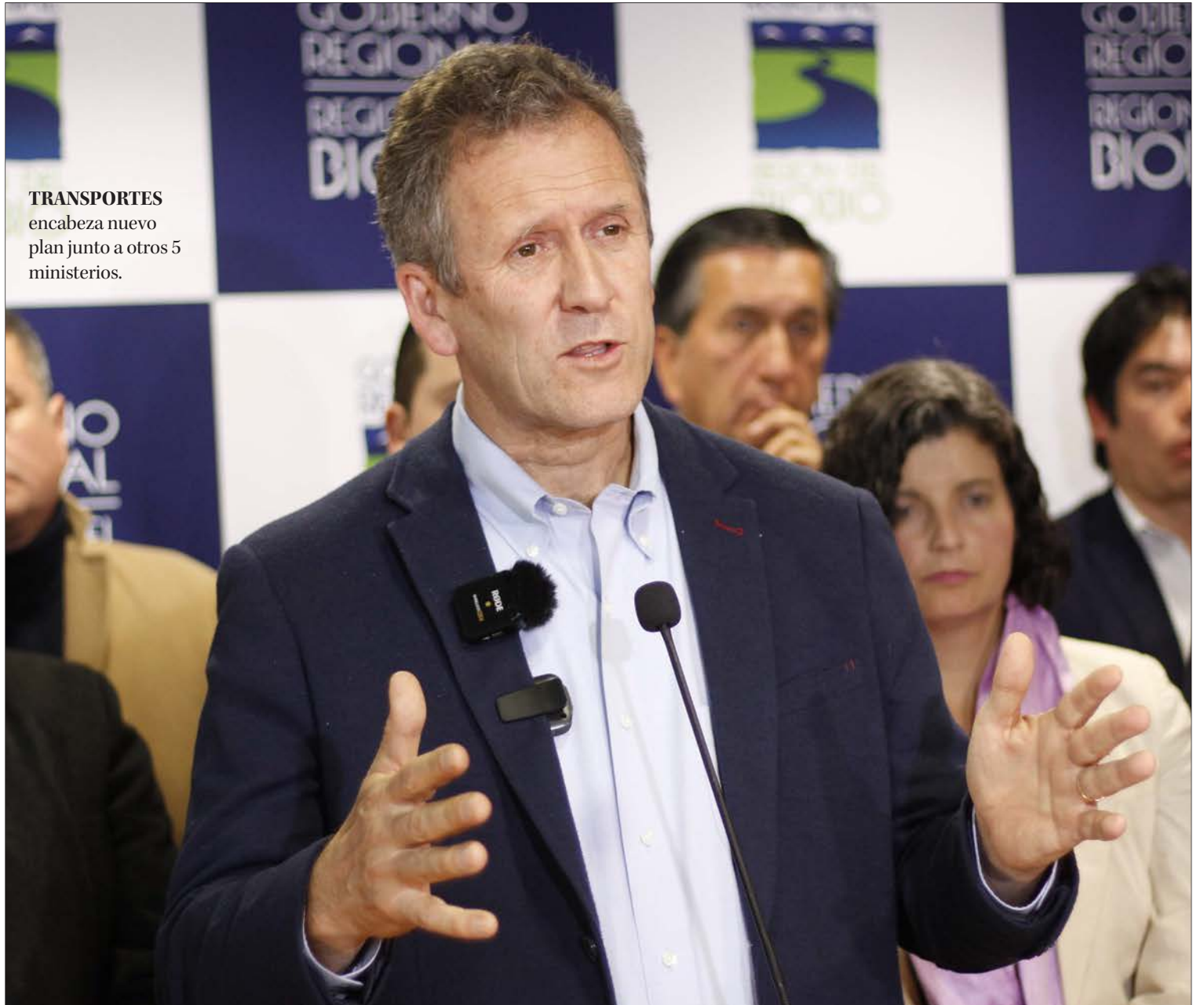
TRANSPORTES encabeza nuevo plan junto a otros 5 ministerios.

El plan tiene tres pilares. Un primer pilar tiene que ver con la gobernanza, esta institucionalidad que queremos