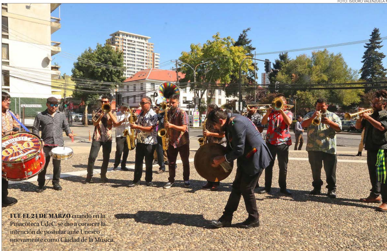
FUE EL 24 DE MARZO cuando en la Pinacoteca UdeC, se dio a conocer la intención de postular ante Unesco nuevamente como Ciudad de la Música.

En esta ocasión, a diferencia de lo vivido entre el 2020 y 2021, hay una mayor esperanza y mejor postura, ya que se han tomado en cuenta todas las observaciones y falencias de la postulación anterior. "Hemos hecho un trabajo diferente en esta oportunidad, hicimos los ajustes que nos solicitaron, además ya tuvimos una primera presentación donde nos hicieron algunos alcances. Ahora presentaremos la segunda y definitiva ante el Ministerio de Relaciones Exteriores y Ministerio de las Culturas. Igual nadie nos puede asegurar que nos irá bien, ya que depende de un jurado que es totalmente independiente. Pero, estamos tranquilos, trabajando bien con los tiempos. Esperamos presentar nuestra postulación con una actividad