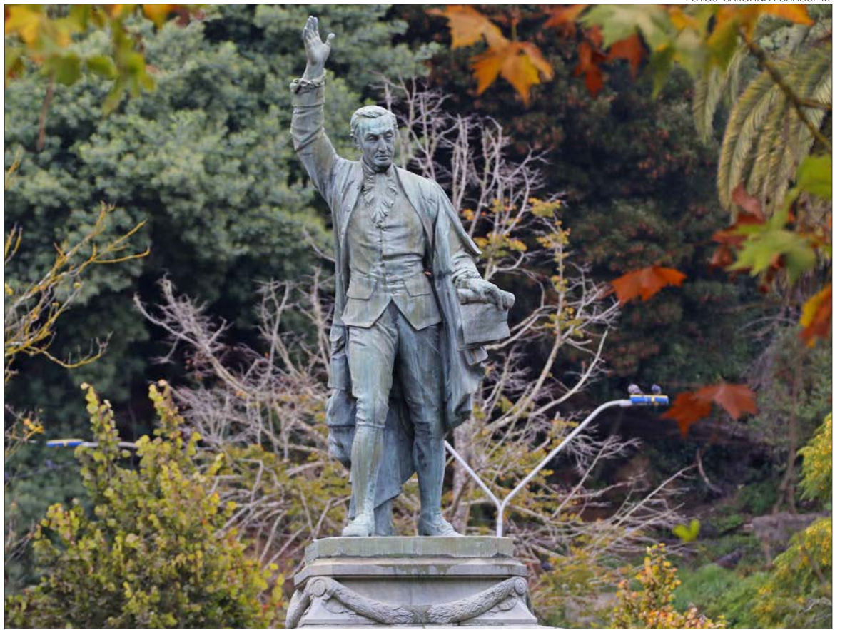
JUAN MARTÍNEZ DE ROZAS , actor preponderante de la Independencia de Chile. (Parque Ecuador)

EXISTEN DIVERSOS HITOS HISTÓRICOS EN CONCEPCIÓN