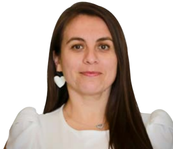
CLAUDIA SOTO CANDIA Seremi de Justicia Biobío

Justicia Social, dos palabras que juntas definen el objetivo de una sociedad, un anhelo que encierra en sí mismo el concepto de equidad, rectitud e imparcialidad. Durante los últimos años, esta definición se ha amoldado a una aspiración de nuestros derechos fundamentales de primera, segunda y tercera generación, es decir, atraviesa lo civil, lo económico, lo social, lo cultural y lo