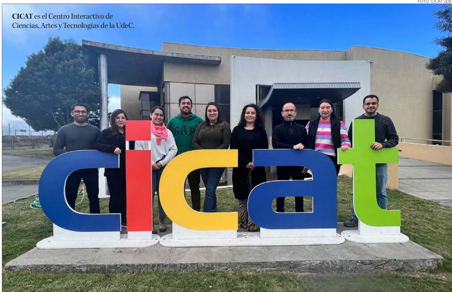
CICAT es el Centro Interactivo de Ciencias, Artes y Tecnologías de la UdeC.

De hecho, todo el material producido será de larga duración y/o reuti-