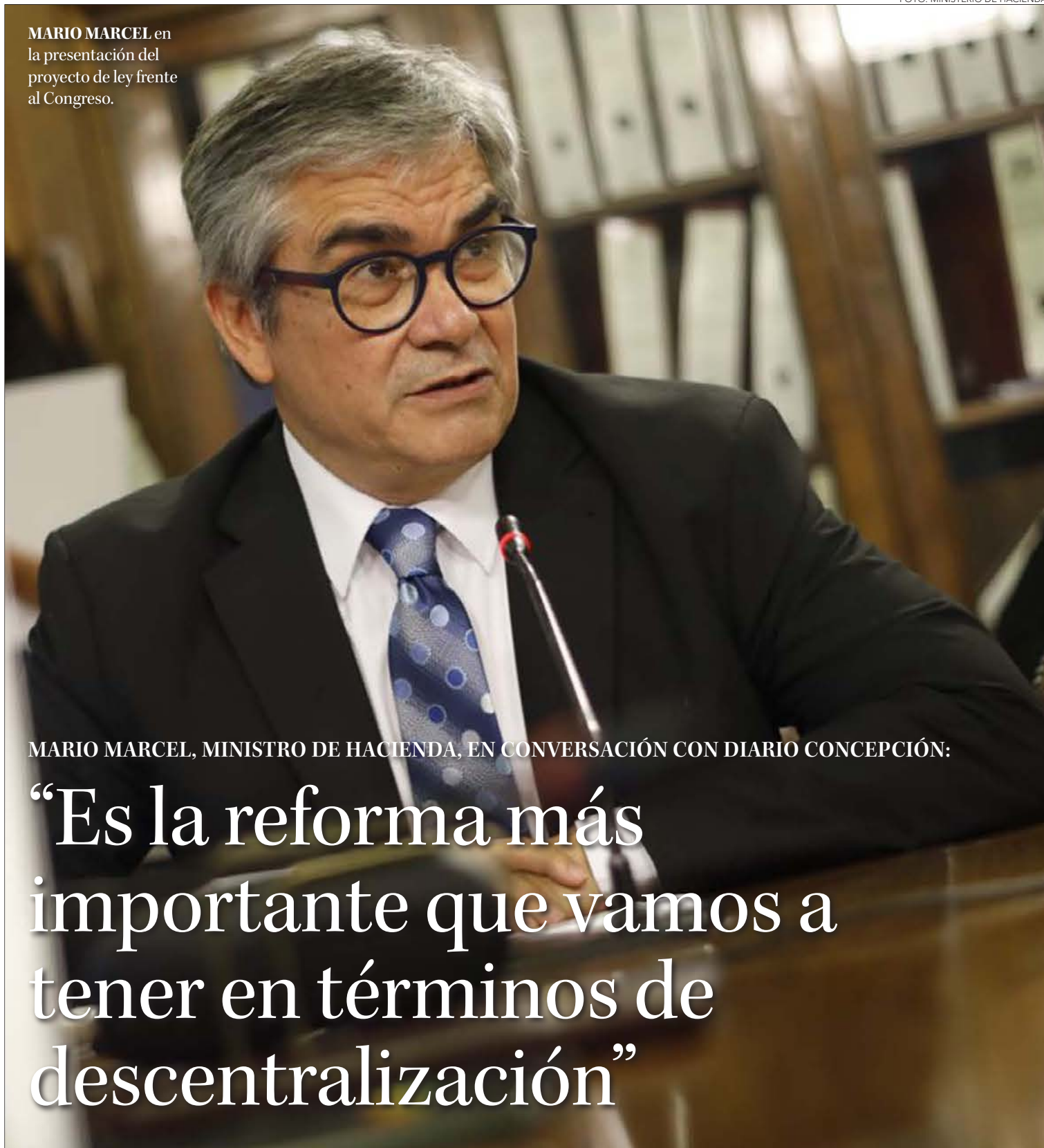
MARIO MARCEL, MINISTRO DE HACIENDA, EN CONVERSACIÓN CON DIARIO CONCEPCIÓN:

MARIO MARCEL en la presentación del proyecto de ley frente al Congreso.