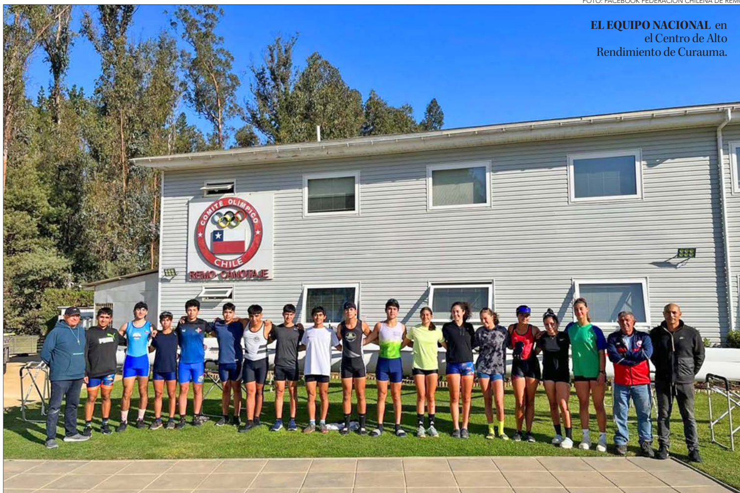
EL EQUIPO NACIONAL en el Centro de Alto Rendimiento de Curauma.