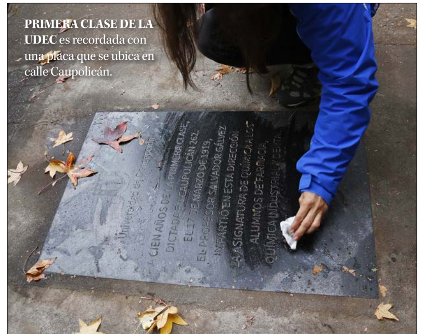
PRIMERA CLASE DE LA UDEC es recordada con una placa que se ubica en calle Caupolicán.

Las calles penquistas reflejan varios cientos de años y, con ello, muchas generaciones de familias. Algunos nombres han quedado marcados en la memoria de la ciudad.