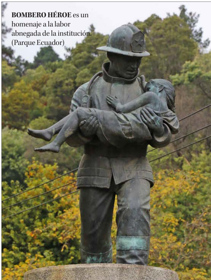
BOMBERO HÉROE es un homenaje a la labor abnegada de la institución. (Parque Ecuador)