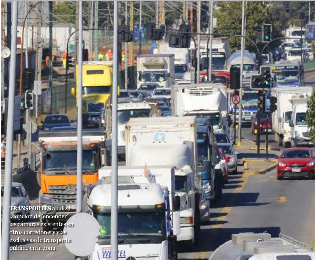
TRANSPORTES analiza la opción de “encender” las cámaras existentes en otros corredores y vías exclusivas de transporte público en la zona.

“Esto ha sido contrario al efecto buscado, la gente no entiende, cree que nosotros (el municipio) estamos auspiciando esto