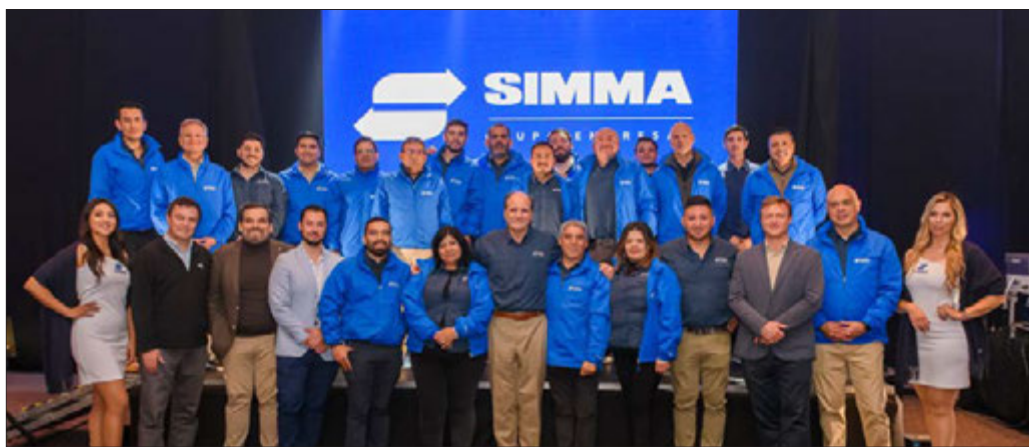
Equipo Grupo Simma, con integrantes de las sucursales de Concepción y Santiago.

Grupo Simma ha tenido un rol destacado como proveedor de equipos y consumibles para los proyectos de las industrias más relevantes de la región, como la construcción y la industria forestal, con las que ha creado fuertes lazos de confianza.