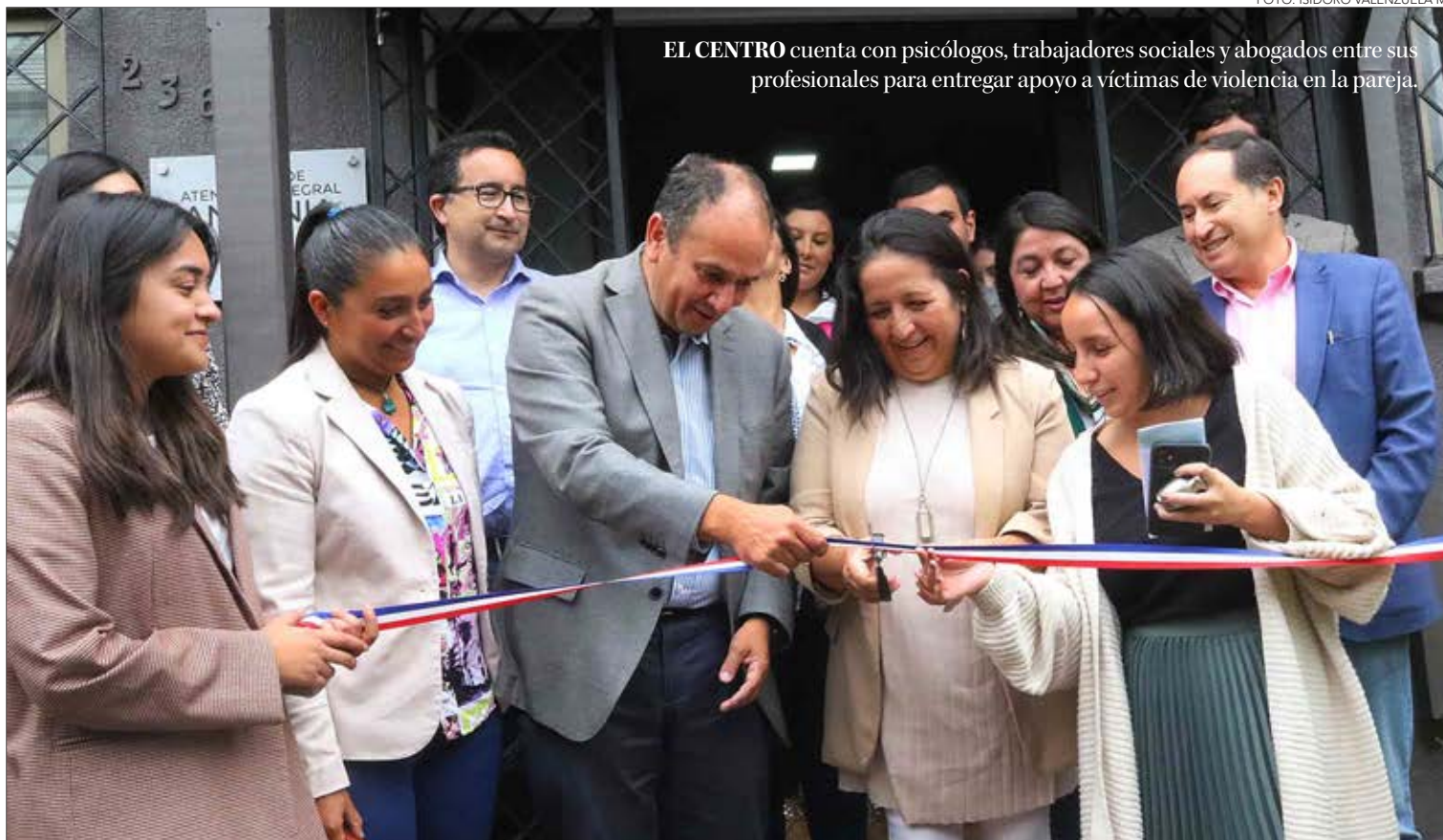
EL CENTRO cuenta con psicólogos, trabajadores sociales y abogados entre sus profesionales para entregar apoyo a víctimas de violencia en la pareja.

La fundación en sus seis años de existencia ha atendido a cerca de 80 personas víctimas en su primera oficina autogestionada, pero desde que están en la nueva ubicación han atendido a 33 personas más, quienes se han acercado sólo