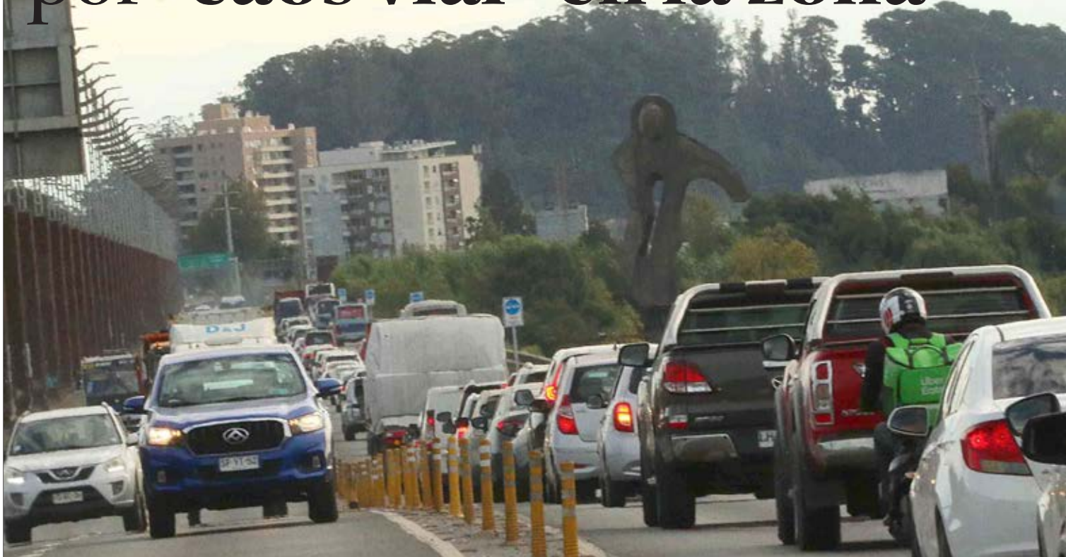
LA POSTAL DEL TACO. El Puente Llacolén se ha transformado en un ícono de la crisis de movilidad en la zona.