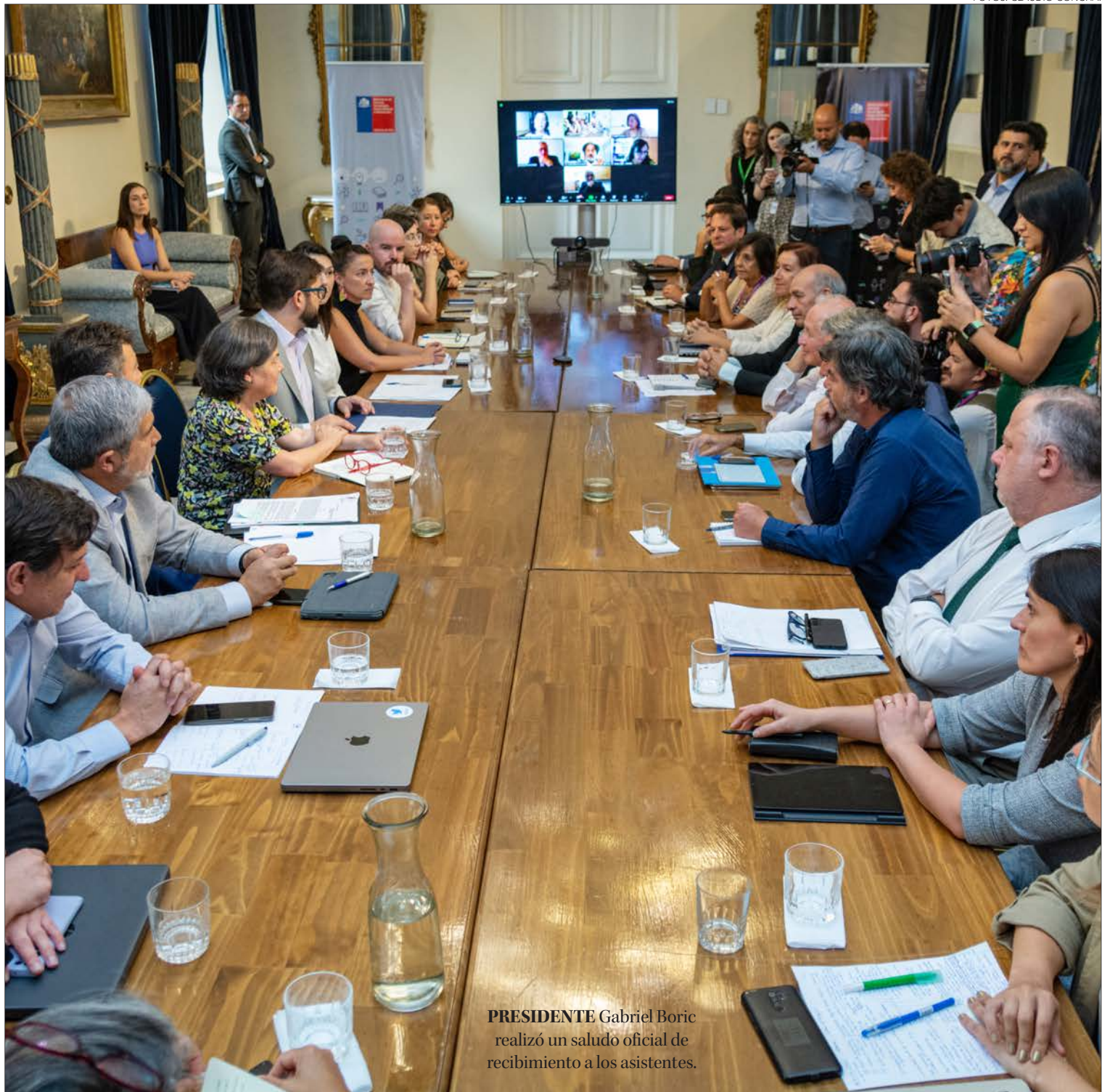
PRESIDENTE Gabriel Boric realizó un saludo oficial de recibimiento a los asistentes.