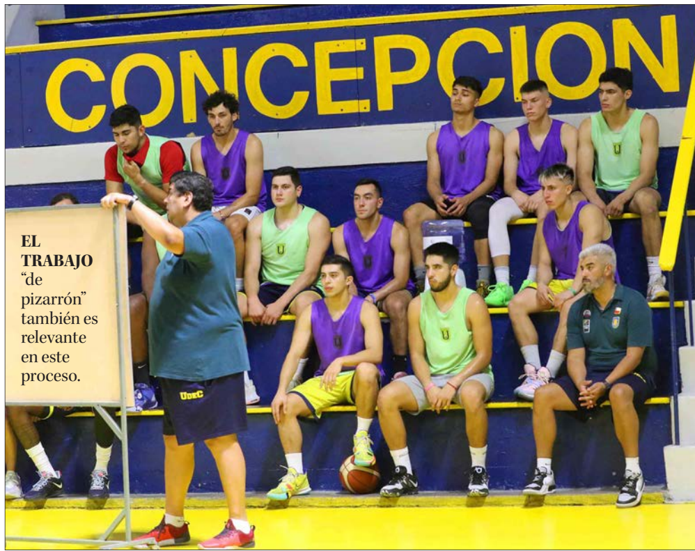
EL TRABAJO "de pizarrón" también es relevante en este proceso.