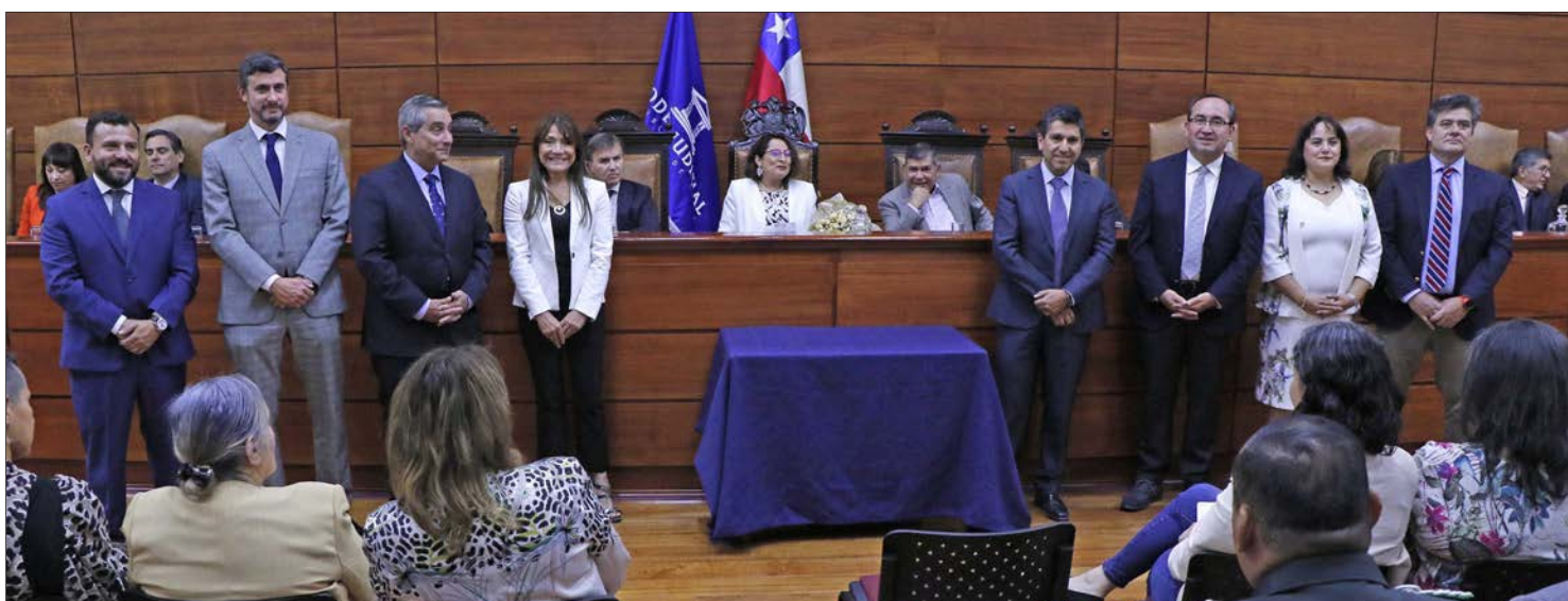
JURAMENTO. Las y los nuevos abogados integrantes de la Corte asumieron su labor hasta febrero 2024.