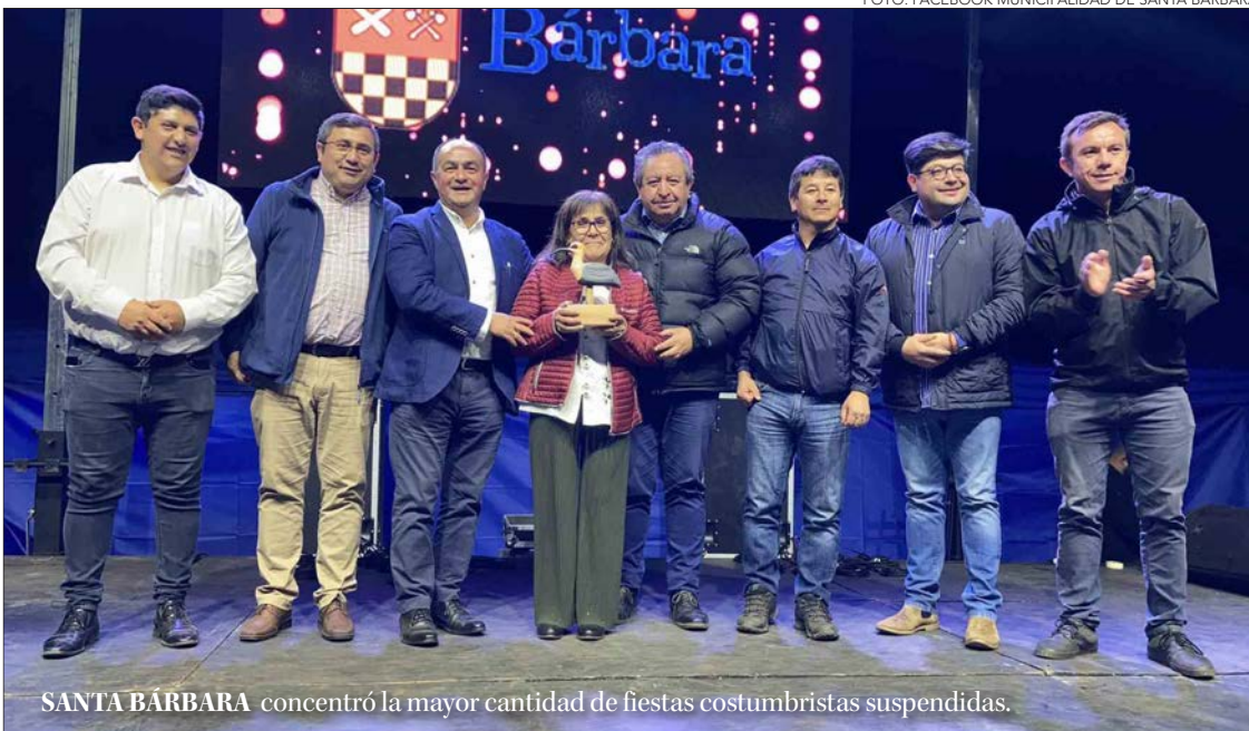
SANTA BÁRBARA concentró la mayor cantidad de fiestas costumbristas suspendidas.