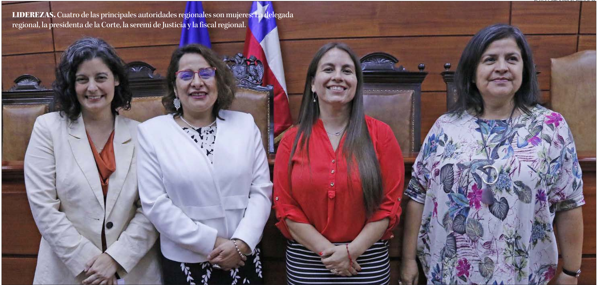
LIDEREZAS. Cuatro de las principales autoridades regionales son mujeres: La delegada regional, la presidenta de la Corte, la seremi de Justicia y la fiscal regional.