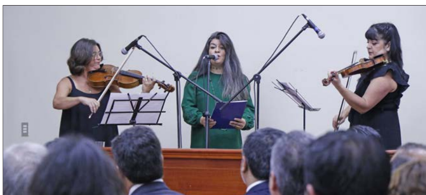
VIOLETA PARRA. Su música estuvo presente en la ceremonia que también fue Cuenta Pública.

Con una ceremonia realizada en la Sala de Pleno, en el edificio de tribunales, se concretó el traspaso en la presidencia del máximo tribunal de la Región. Además en el acto juraron los nuevos abogados integrantes que tendrá la Corte este periodo.