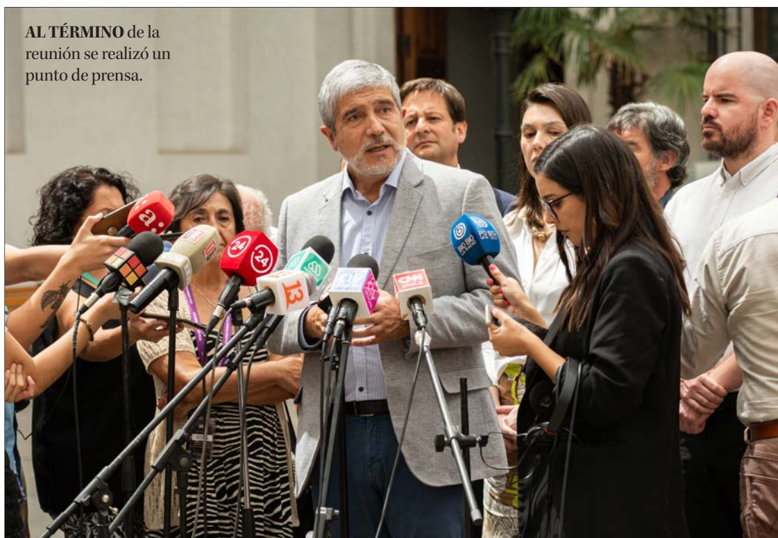
AL TÉRMINO de la reunión se realizó un punto de prensa.

En tanto el ministro de agricultura, Esteban Valenzuela Van Treek, valoró la instancia, reforzando la idea de tomar decisiones en base a evidencia científica, tal como se hizo en los eventos recientes. “El Ministerio de Agricultura tomó información de la Universidad de Chile, de la Universidad de Concepción, también de la Universidad de la Frontera, y por eso una semana antes el sector agrícola hizo la tarea de faena cero” por las condiciones que se presentaban. Trabajo que ahora se podrá ahondar y proyectar aún más con esta mesa técnica.