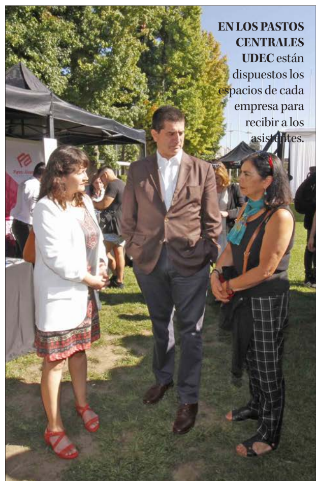
EN LOS PASTOS CENTRALES UDEC están dispuestos los espacios de cada empresa para recibir a los asistentes.

La instancia tiene por objetivo que estudiantes y exalumnos de la FI UdeC obtengan cupos de prácticas profesionales y alternativas de movilidad internacional, junto con postulaciones a plazas laborales en importantes empresas.