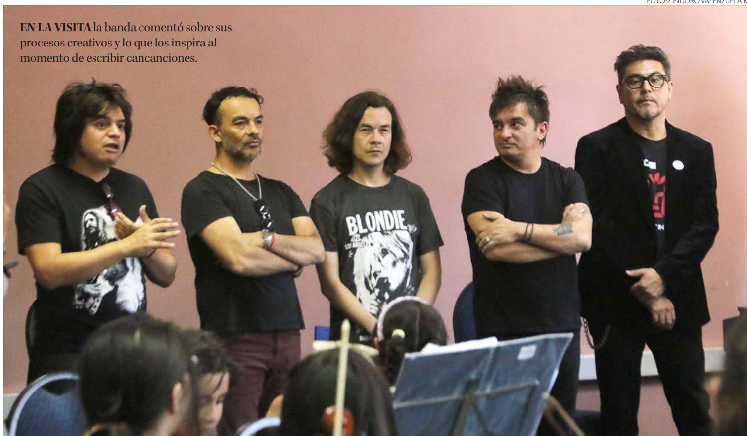
EN LA VISITA la banda comentó sobre sus procesos creativos y lo que los inspira al momento de escribir canciones.

Sobre el concierto de la jornada sabatina, el alcalde de Concepción, tam-