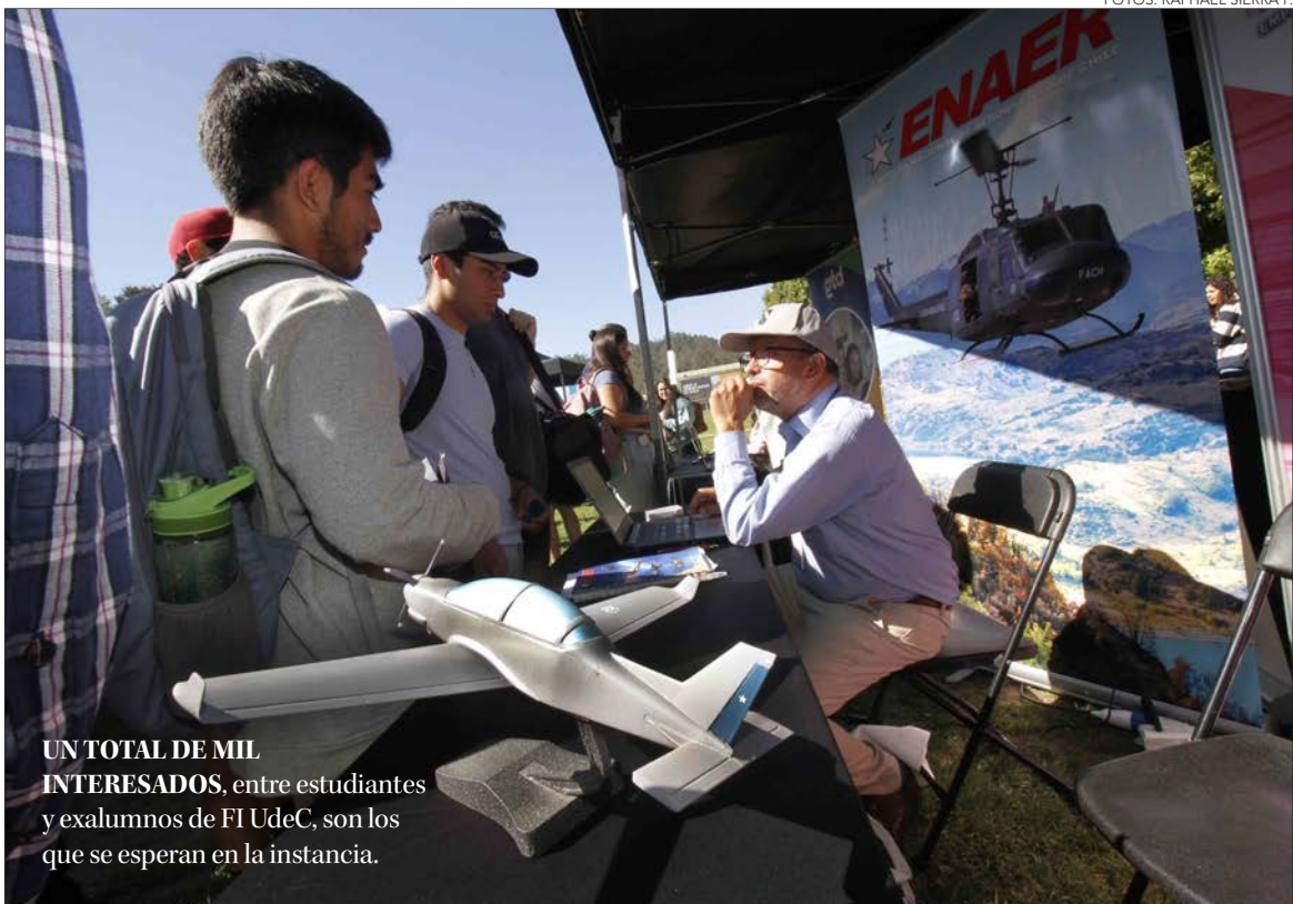
UN TOTAL DE MIL INTERESADOS , entre estudiantes y exalumnos de FI UdeC, son los que se esperan en la instancia.