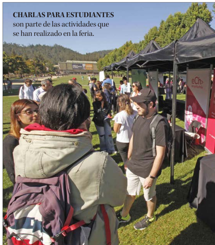
CHARLAS PARA ESTUDIANTES son parte de las actividades que se han realizado en la feria.