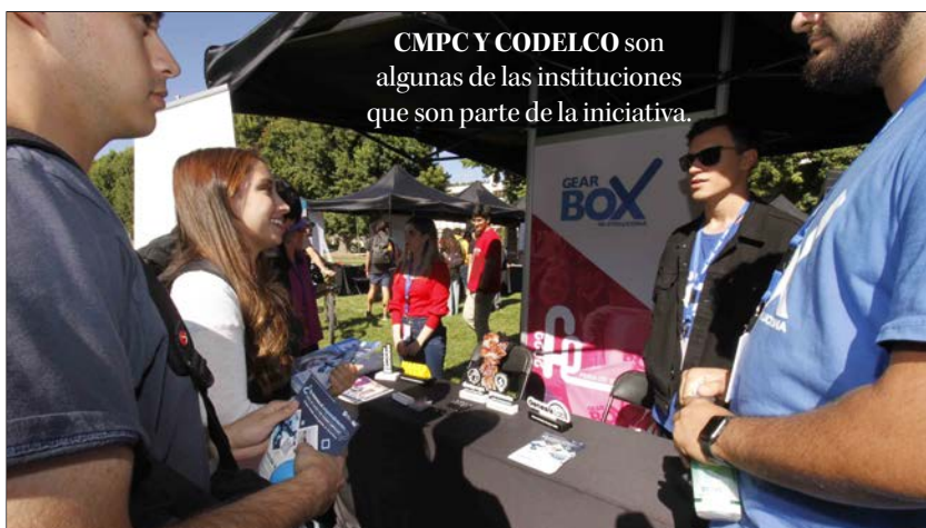
CMPC Y CODELCO son algunas de las instituciones que son parte de la iniciativa.