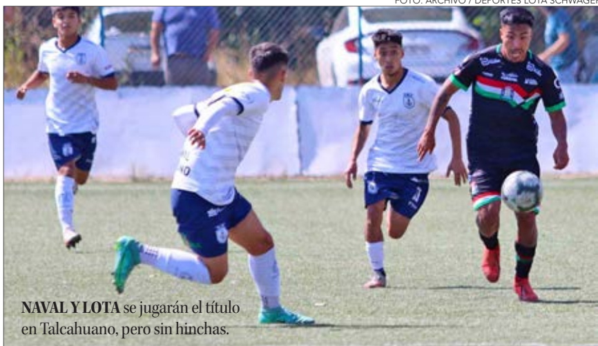
NAVAL Y LOTA se jugarán el título en Talcahuano, pero sin hinchas.

Se postergó dos veces y la semana pasada se tomó una decisión definitiva: la final del Octogonal del Bío Bío se jugará mañana, pero faltaba anunciar si sería con público local o a puertas cerradas. Todo dependía de cómo avanza el tema de los incendios forestales y el estado de excepción en la zona. Finalmente, será a las 16 horas en El Morro y sin hinchas.