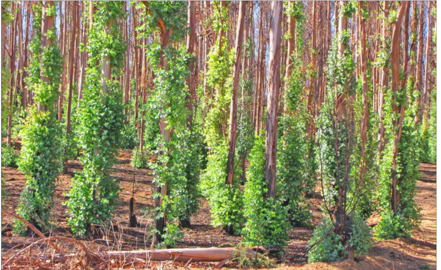
LOS BROTES DEL MISMO ÁRBOL comienza a subir por el tronco que se quemó, pero germinaron sus cenizas.