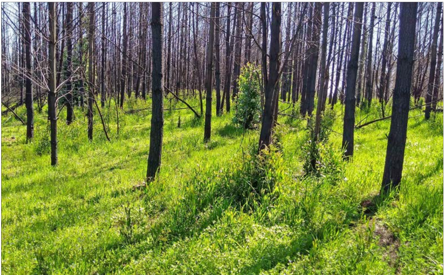
EL PASO O VEGETACIÓN puede crecer luego de las primeras lluvias, lo que ayuda a proteger el suelo de la erosión.