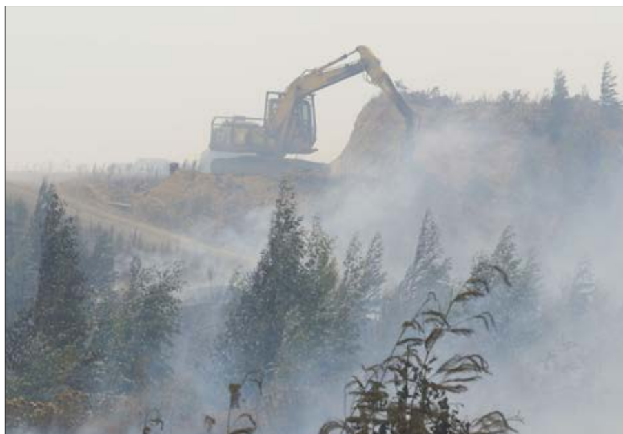
MAQUINARIAS trabajando en el sector la Rosa.