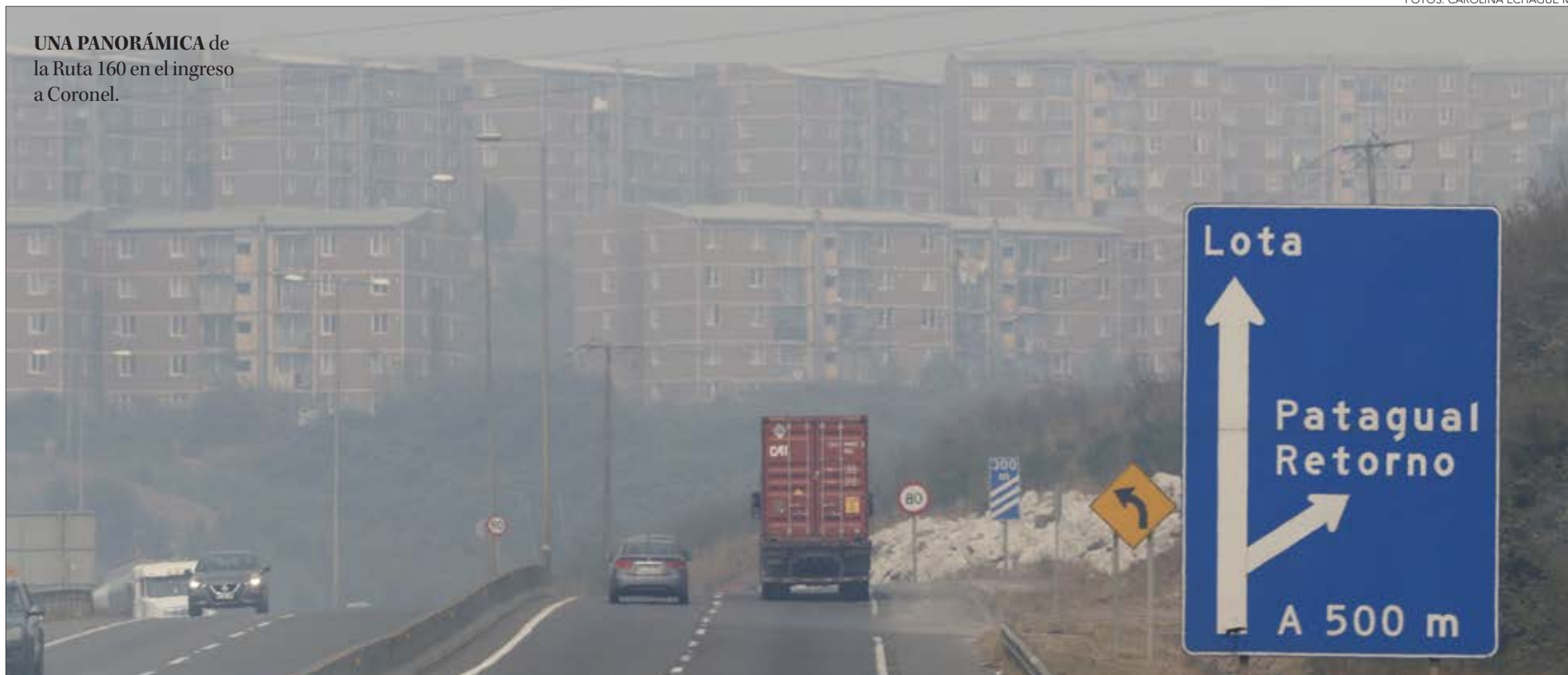
UNA PANORÁMICA de la Ruta 160 en el ingreso a Coronel.