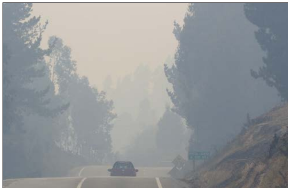
CAMINO A PATAGUAL la visibilidad era dificultosa.