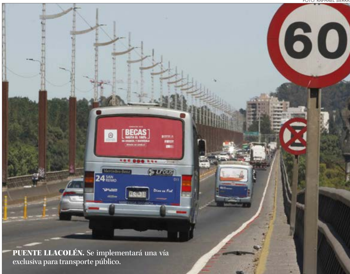
PUENTE LLACOLÉN. Se implementará una vía exclusiva para transporte público.

Prohibición de circulación vehicular, continuidad de buses de acercamiento, mejoras en el tráfico, una pista solo para buses en el puente Llacolén, refuerzos para buses Lota-Coronel, capacitación para 120 nuevos conductores de taxibuses y fiscalización, son una parte de las medidas que componen el plan de contingencia de tráfico para el Gran Concepción.