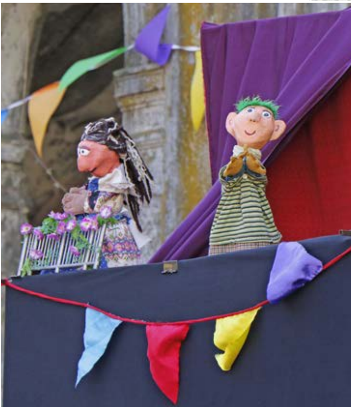
LOS TÍTERES tienen un rol estelar en las funciones que se realizan frente al Parque Ecuador.