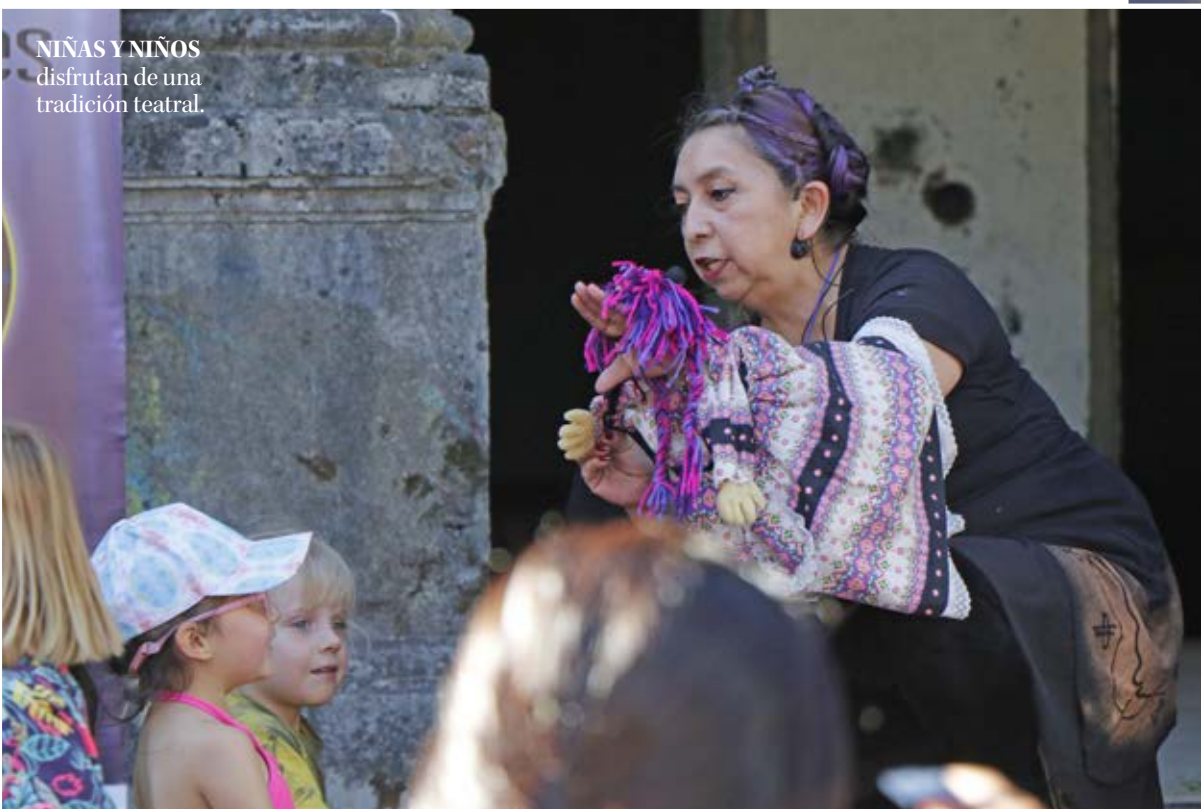
NIÑAS Y NIÑOS disfrutaron de una tradición teatral.