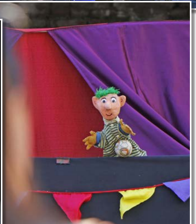
HASTA ESTE DOMINGO se presentarán las funciones en el Teatro Enrique Molina Garmendia.