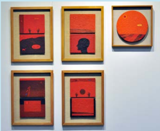
SERIE PAISAJE TARDÍO Jorge Pasmño