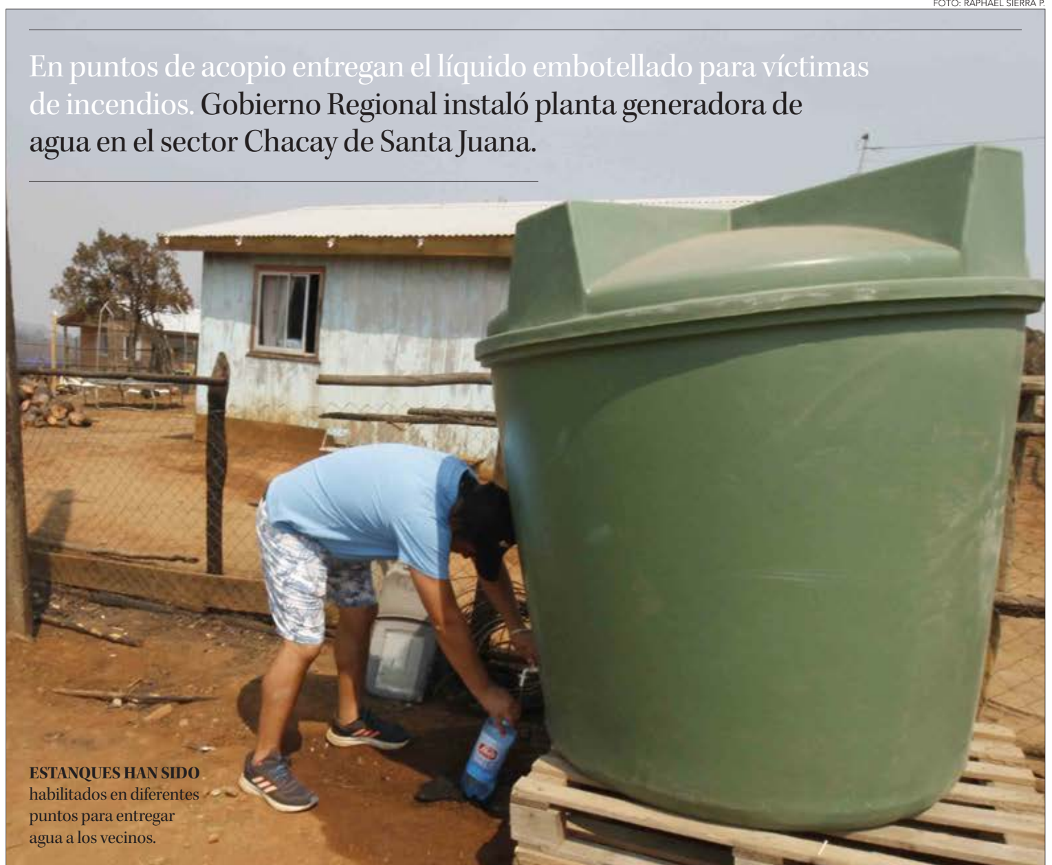
ESTANQUES HAN SIDO habilitados en diferentes puntos para entregar agua a los vecinos.