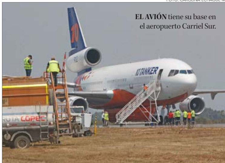
EL AVIÓN tiene su base en el aeropuerto Carriel Sur.