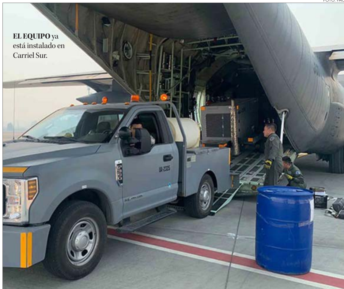
EL EQUIPO ya está instalado en Carriel Sur.

La institución uniformada determinó conformar una unidad transitoria en el terminal de Talcahuano para apoyar en las operaciones aéreas por los incendios forestales que afectan a diferentes territorios en el sur del país.