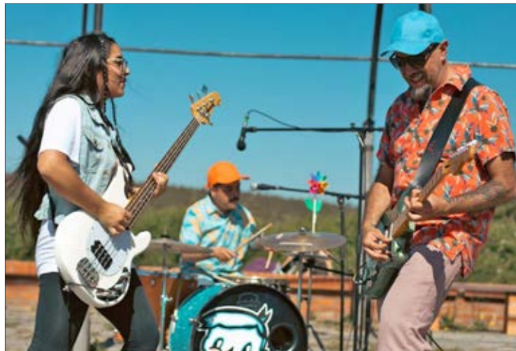
MONDONGO fue uno de los grupos protagonistas en la jornada de ayer en Plaza Condell.

Ayer hubo un acto en Plaza Condell, mañana se hará un Rock Fest en La Bodeguita, el viernes un bingo en Havana Club y también se quiere programar un evento para músicos que han sido perjudicados por la situación.