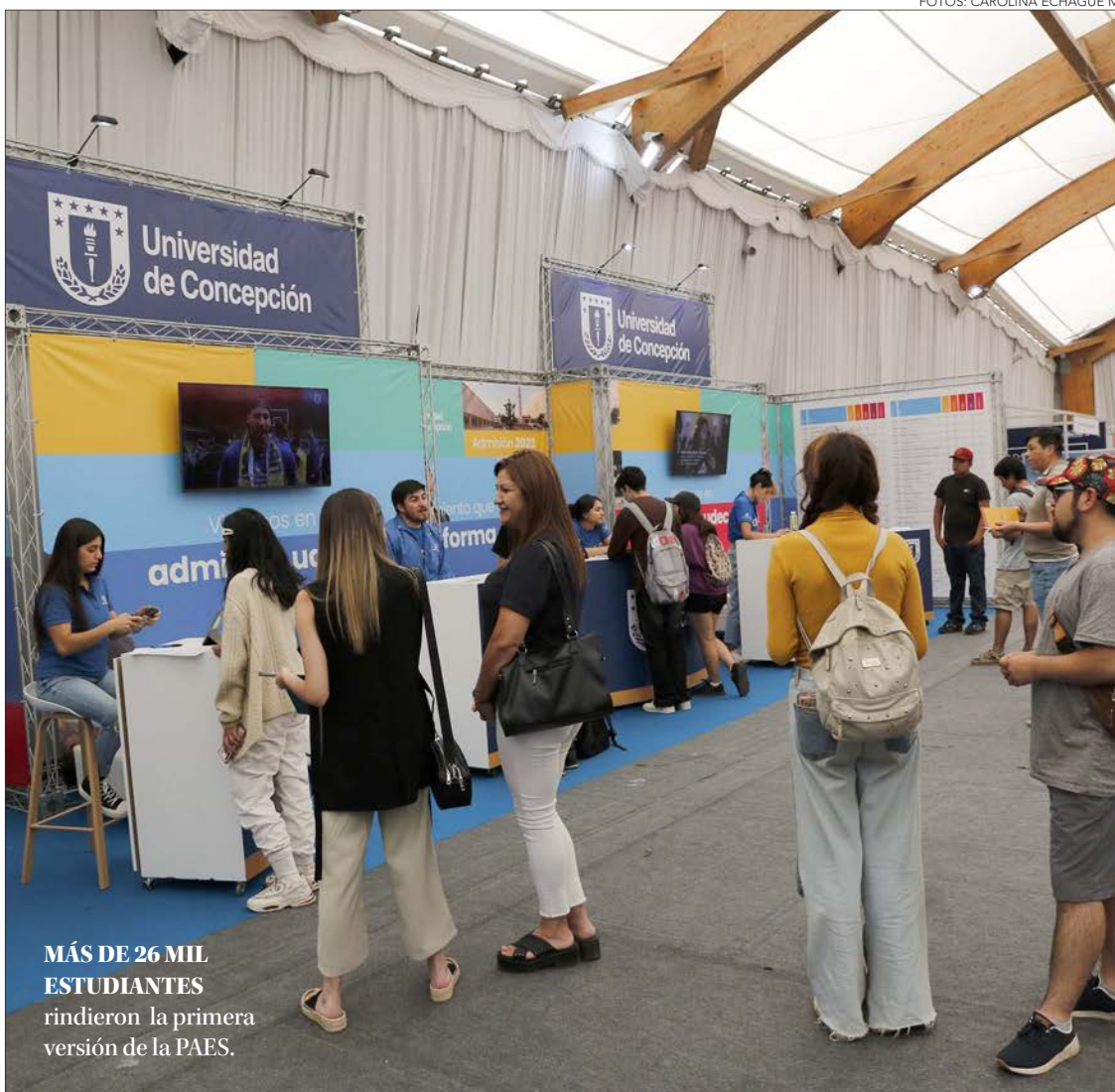
MÁS DE 26 MIL ESTUDIANTES rindieron la primera versión de la PAES.