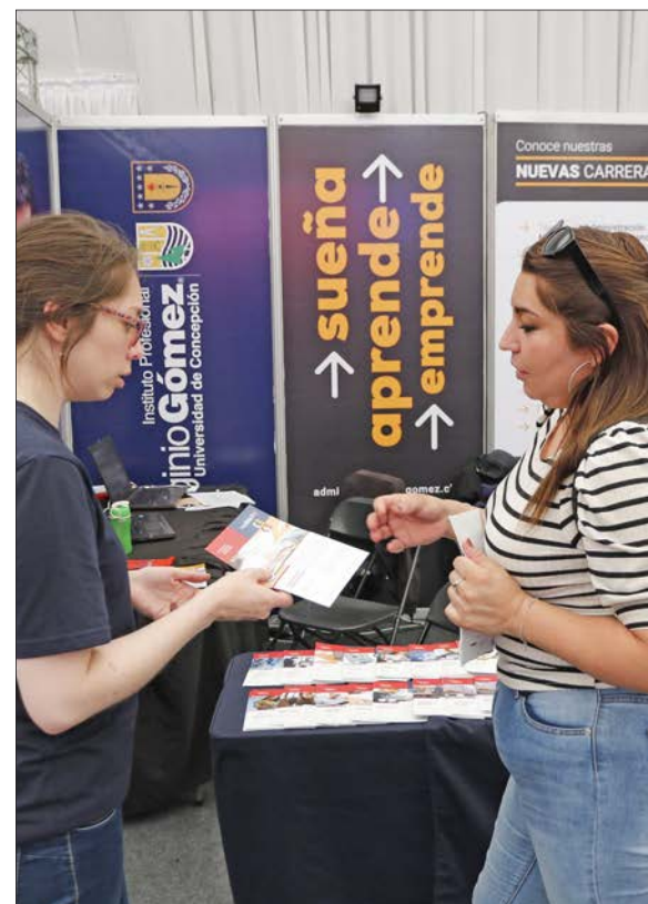
INSTITUTOS PROFESIONALES se posicionan como una gran opción de formación profesional.