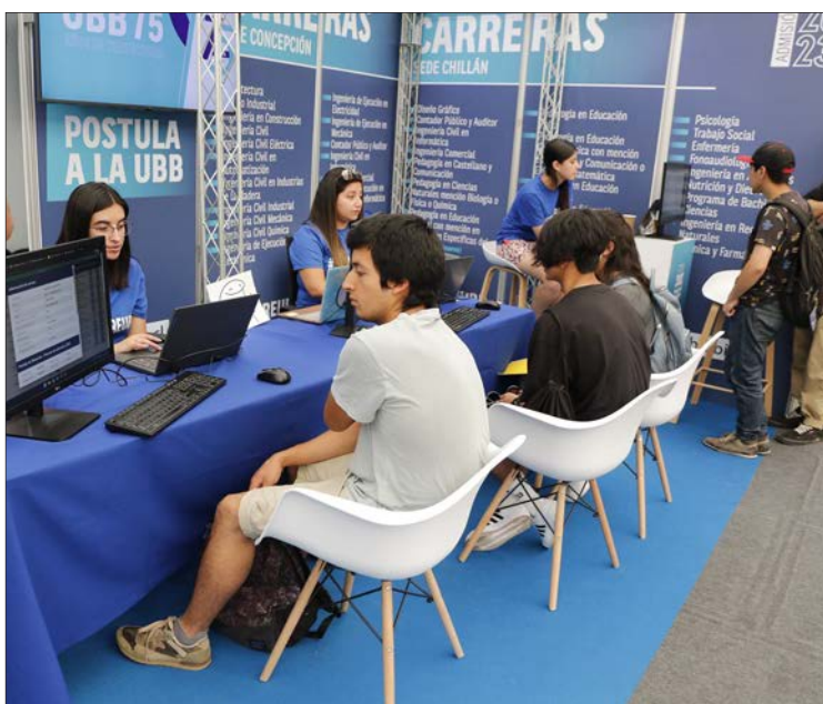
19ª FERIA DE POSTULACIÓN y Matrícula de Educación Superior, se desarrolla hasta hoy en Suractivo.

Proceso de postulación finaliza este viernes. Mientras que, el primer proceso de matrículas se desarrollará del 18 al 20 de este mes, el segundo, del 21 al 27 de enero y el último, el 28.