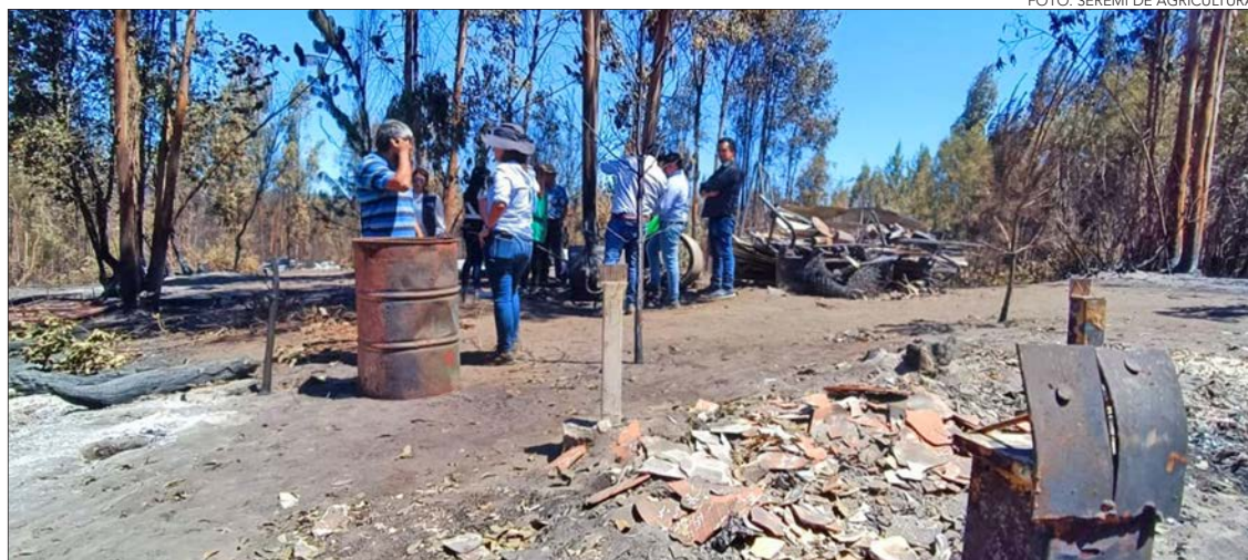
AUTORIDADES DE AGRICULTURA visitaron a familias afectadas en las comunas de Nacimiento y Saanta Juana.