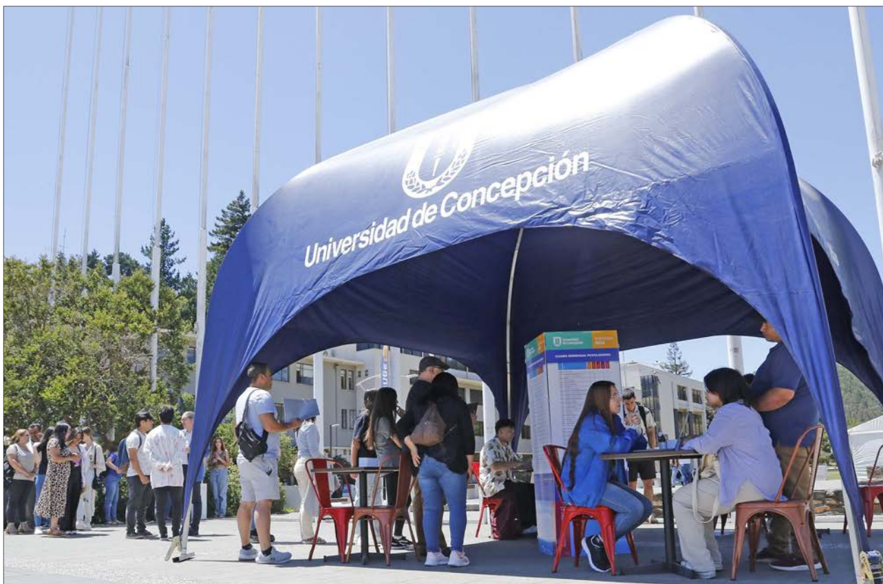
UDEC, UCSC, UBB Y USM participan en la 19ª versión de la Feria de Postulación