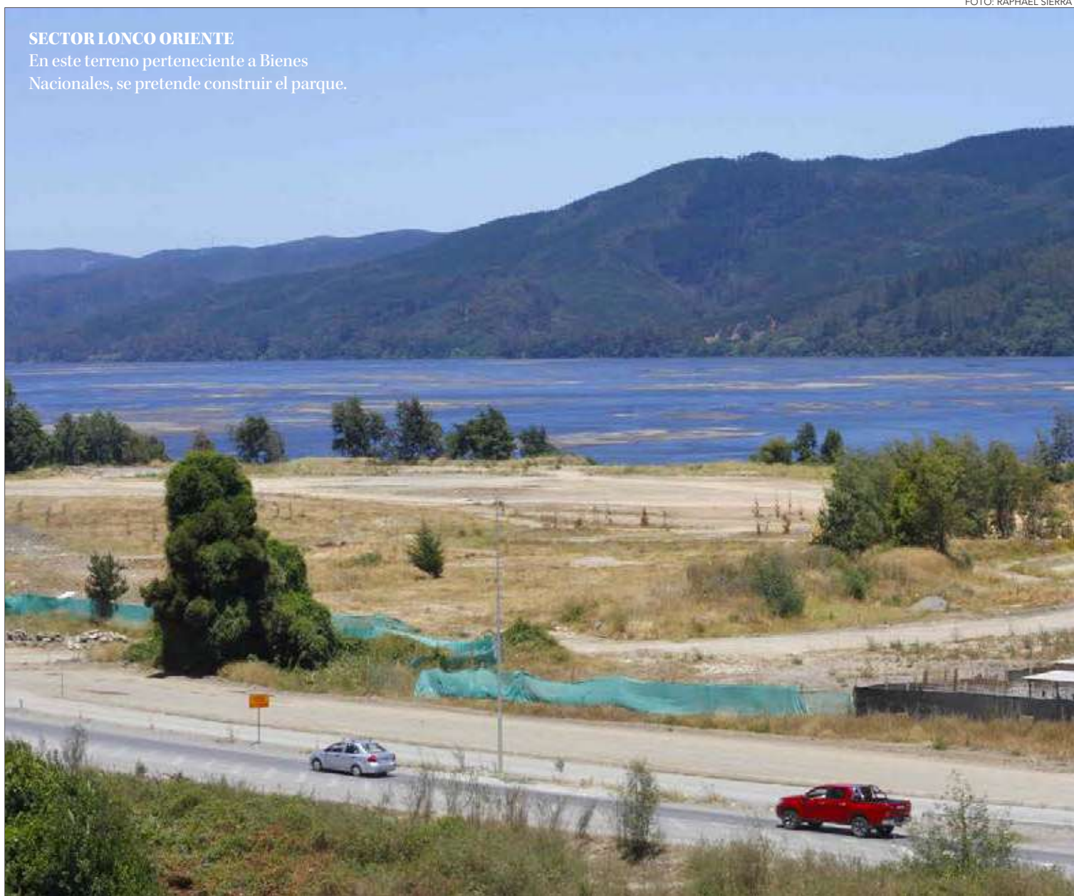
LA IDEA SURGIÓ TRAS UNA REUNIÓN CON VECINOS DE LONCO EN 2019