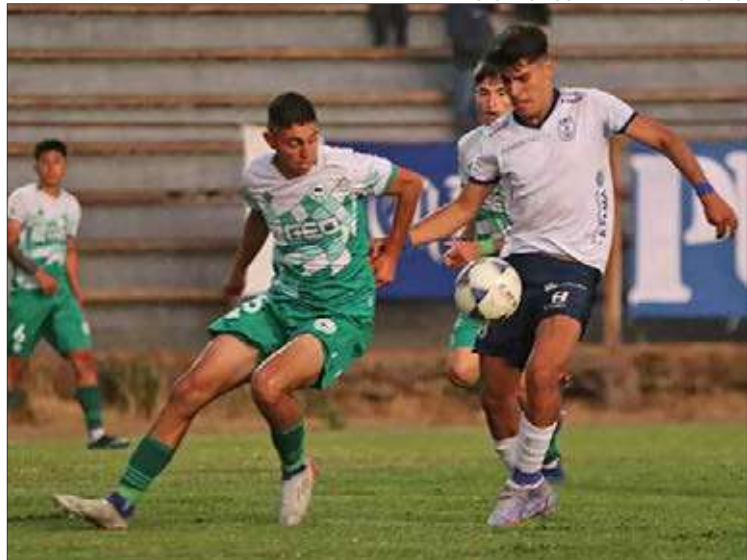
NAVAL demostró que tiene una base consolidada y partió ganando.