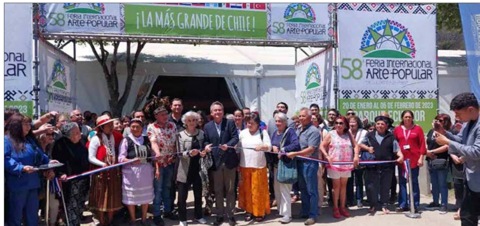
EL ALCALDE Álvaro Ortiz encabezó la ceremonia de inauguración.