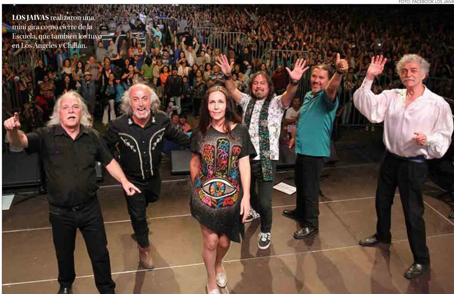
LOS JAIVAS realizaron una mini gira como cierre de la Escuela, que también los tuvo en Los Ángeles y Chillán.

En el cierre de la jornada se contemplan tres actividades: una conversación con el escritor mexicano Jorge Volpi y el autor nacional Clemente Riedemann (18 horas, escenario Gonzalo Rojas), un recital poéti-