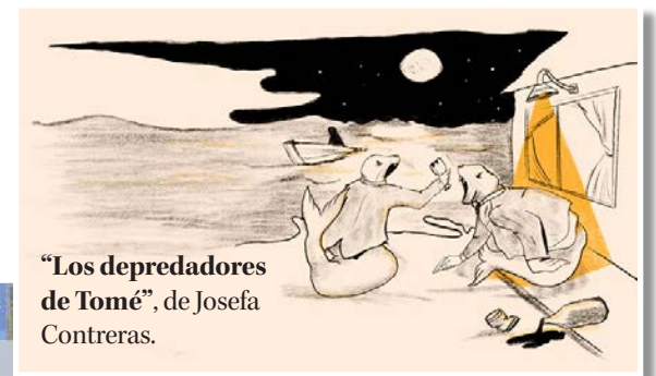
“Los depredadores de Tomé”, de Josefa Contreras.

Mauricio Maldonado Quilodrán mauricio.maldonado@diarioconcepcion.cl