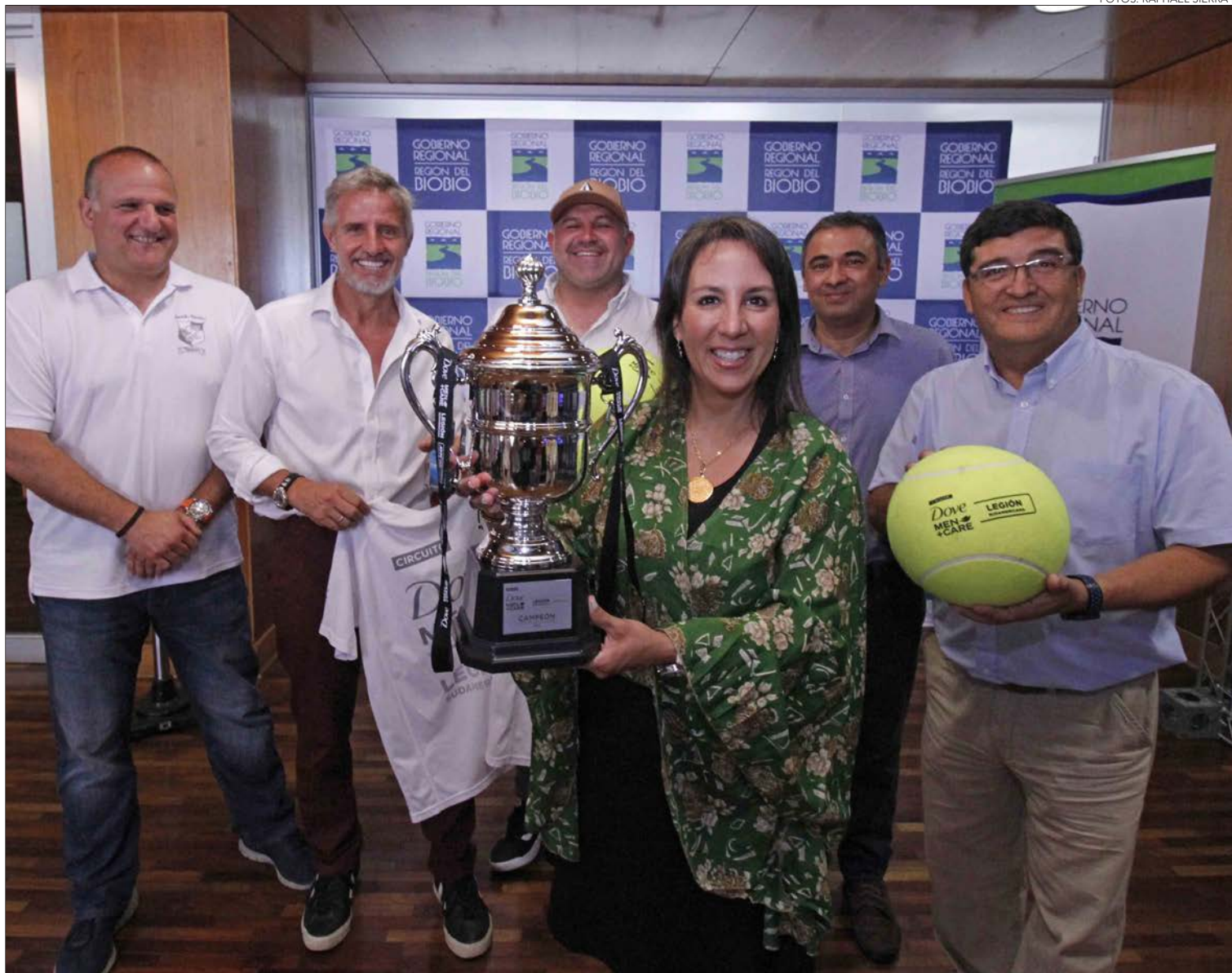
CHALLENGER ATP 100 'DOVE MEN CARE' 2023

Por su parte, el presidente de la Asociación Regional de Tenis del