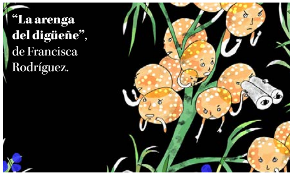
“La arenga del digüene”, de Francisca Rodríguez.