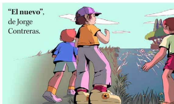
“El nuevo”, de Jorge Contreras.

LA ORQUESTA UDEC musicalizó la jornada de premiación con piezas especialmente compuestas para la ocasión.