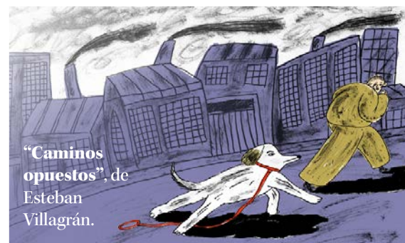
“Camino opuestos”, de Esteban Villagrán.