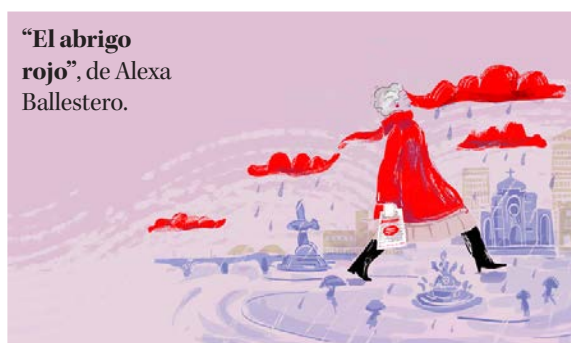
“El abrigo rojo”, de Alexa Ballester.