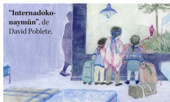
“Internadokonaymün”, de David Poblete.

LAS IMÁGENES CORRESPONDEN a las diferentes ilustraciones que acompañan a los cuentos ganadores de la XI versión del concurso. Trabajos que serán parte de una exposición que estará hasta marzo en la Biblioteca Central UdeC.