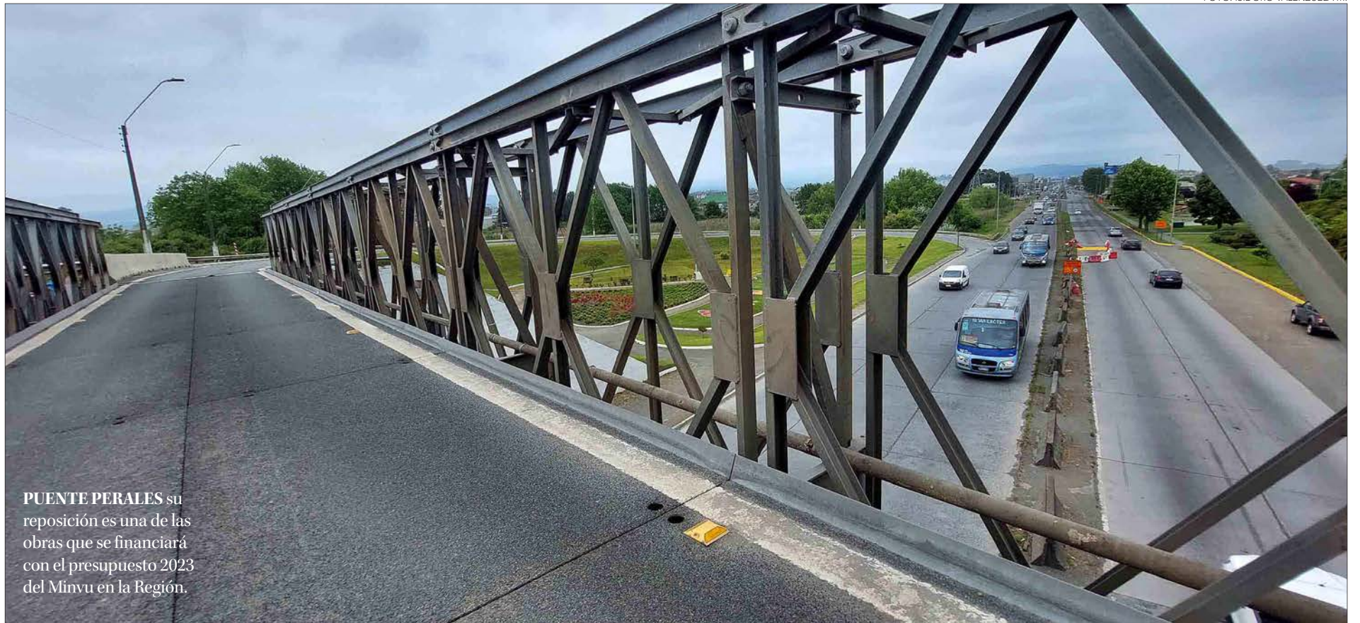
PUENTE PERALES su reposición es una de las obras que se financiará con el presupuesto 2023 del Minvu en la Región.

Pablo Carrasco Pérez pablo.carrasco@diarioconcepcion.cl