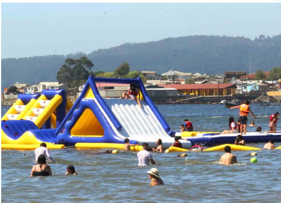
JUEGO INFLABLE junto a la costa, fue uno de los grandes atractivos.