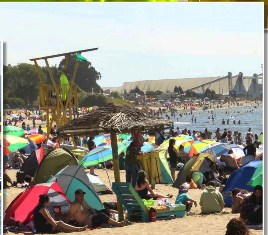
ALA SOMBRA estuvieron muchos visitantes para poder mitigar la alta temperatura de la jornada.