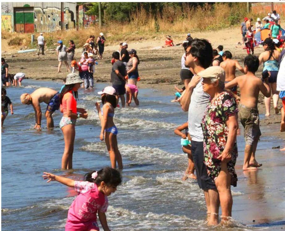
NIÑOS Y NIÑAS fueron protagonistas en un día lleno de entretenimiento, junto al Pacífico.

DESDE LA ALTURA se apreciaba la cantidad de turistas, distribuidos de extremo a extremo de la playa.