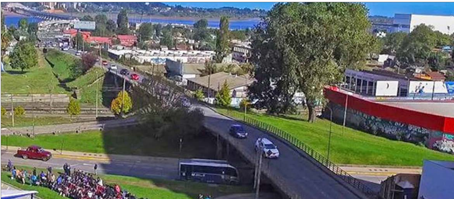
PUNTE ESMERALDA que conecta avenida Costanera con Víctor Lamas es uno de los proyectos del presupuesto 2023 del Minvu en la zona.

“Una cosa son las ciclovías que están incorporadas en nuestros proyectos de infraestructura vial, como los corredores viales, pero también es cómo generamos nuevas rutas para la bicicleta y no solamente en Concepción, sino que por ejemplo estamos en Lebu, donde estamos viendo un tema de ciclovías en toda la parte central de la comuna. En Mulchén también, incorporando el tema de las ciclovías, por lo tanto, es ver cómo vamos avanzando, cómo vamos generando este modo, no solamente en el Gran Concepción que obviamente es importante porque aquí se genera la mayor congestión por la cantidad de habitantes, las complejidades que tiene, pero si también instalando este modo en otras comunas que también requieren de este tipo de modos alternativos y que incluso pueden ser que se den mejor, con mayores facilidades”, cerró la seremi.