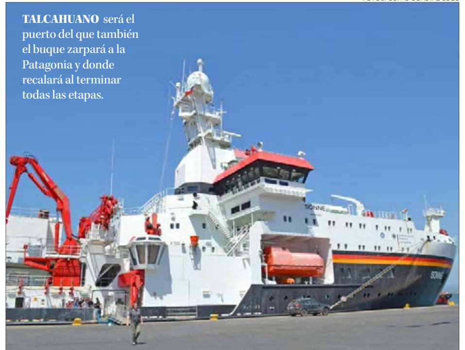
TALCAHUANO será el puerto del que también el buque zarpará a la Patagonia y donde recalará al terminar todas las etapas.

El gran evento de oxigenación fue hace cerca de 2.300 millones de años. Desde entonces, el oxígeno ha dado forma a la Tierra e interactúa con todos los ciclos elementales como el del nitrógeno, azufre y fósforo. Y lo más importante: la vida y el ciclo de carbono dependen directamente de la disponibilidad de oxígeno.