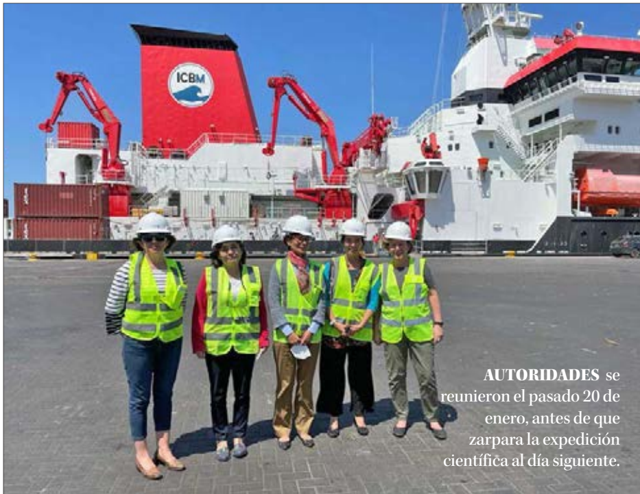
AUTORIDADES se reunieron el pasado 20 de enero, antes de que zarpara la expedición científica al día siguiente.