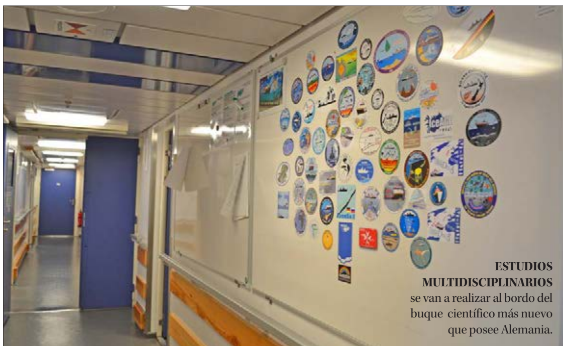
ESTUDIOS MULTIDISCIPLINARIOS se van a realizar al bordo del buque científico más nuevo que posee Alemania.

Para este trabajo se usarán distintos parámetros, algunos de los cuales serán relevantes para reconstruir diversas transformaciones y a escalas de tiempos más largas, como los últimos 18 mil o 20 mil años. “Esto nos dará una visión histórica de los cambios naturales en los fiordos antes del impacto del ser humano”, cerró.