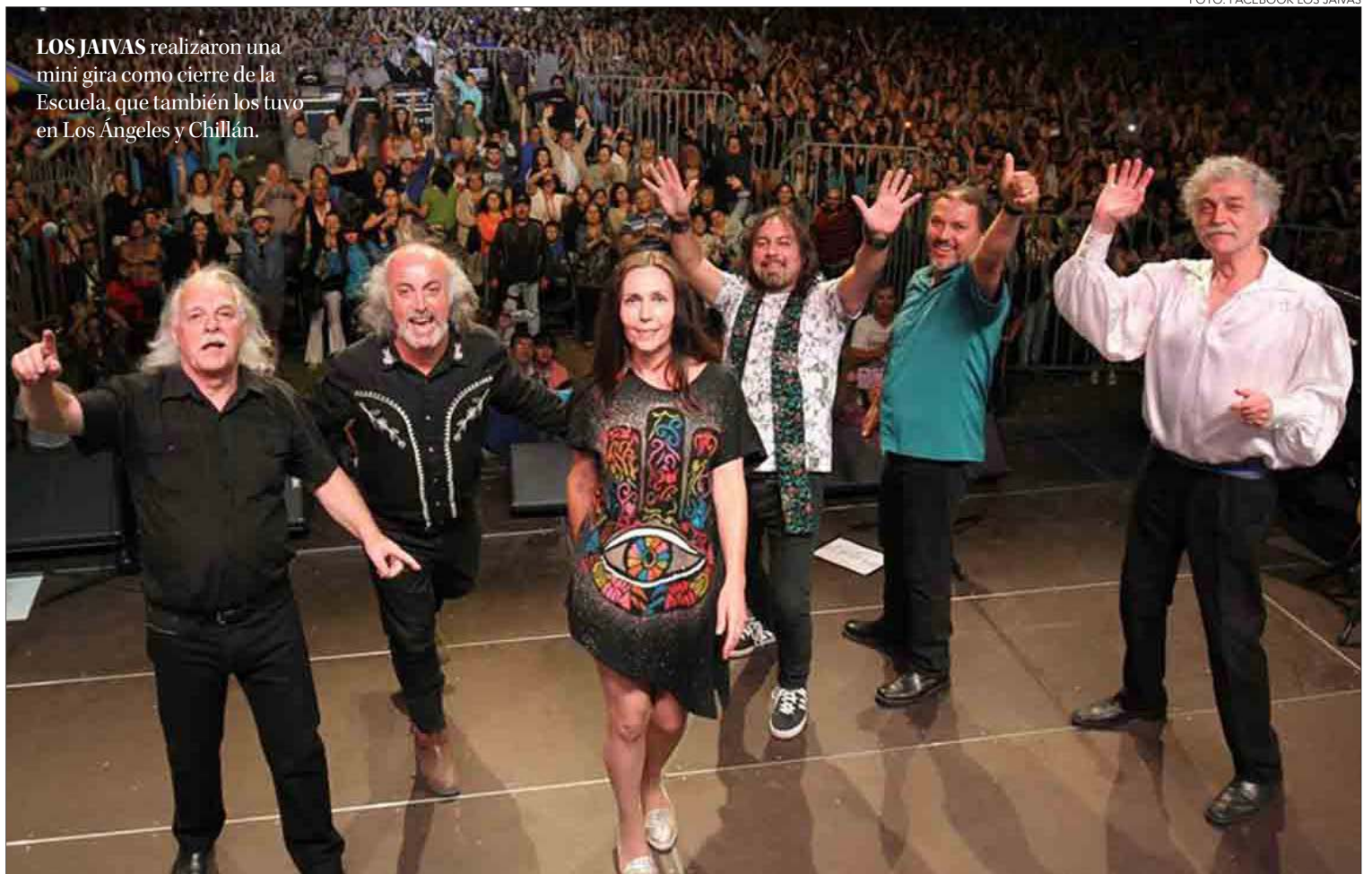
LOS JAIVAS realizaron una mini gira como cierre de la Escuela, que también los tuvo en Los Ángeles y Chillán.

En el cierre de la jornada se contemplan tres actividades: una conversación con el escritor mexicano Jorge Volpi y el autor nacional Clemente Riedemann (18 horas, escenario Gonzalo Rojas), un recital poéti-