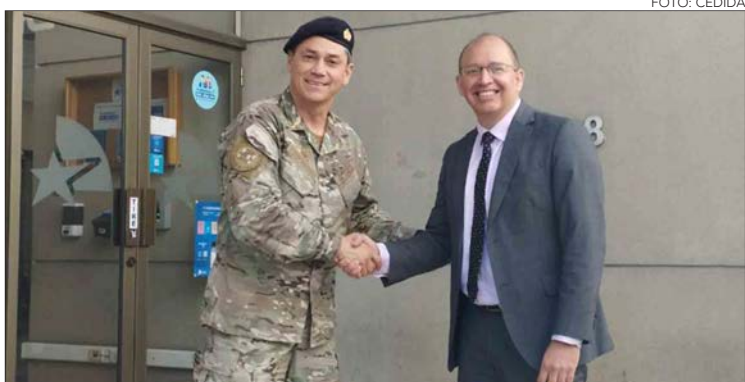
LOS PERSONEROS se reunieron en dependencias de la Defensoría Regional.