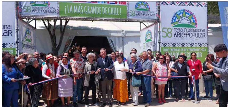
EL ALCALDE Álvaro Ortiz encabezó la ceremonia de inauguración.