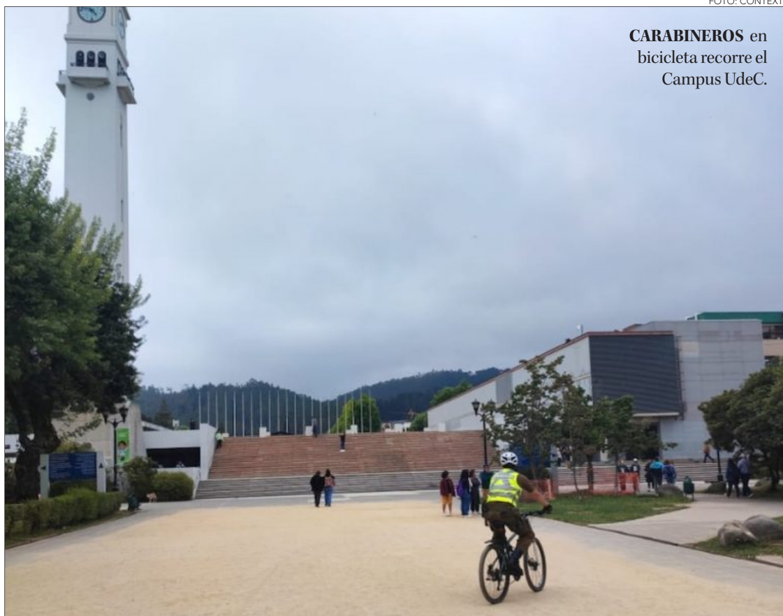
CARABINEROS en bicicleta recorre el Campus UdeC.

Cabe destacar que los guardias UdeC han estado apoyando constantemente este proceso. Con este trabajo mancomunado, los niveles delictuales del campus han bajado