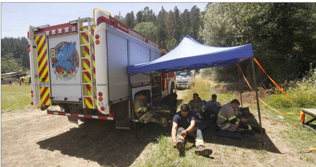
BOMBEROS recuperan fuerzas para continuar en el combate al fuego.