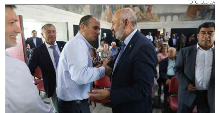
EL GOBERNADOR y el rector de la UBB en un saludo y abrazo posterior a la aprobación de los recursos.

El proyecto ya había pasado todos los trámites necesarios durante la última administración de la Presidenta, Michelle Bachelet, pero en el anterior gobierno no se le dio el avance necesario y terminó desactualizado. Hace unos días volvió a obtener su RS respectivo, y ayer se complementó la iniciati-