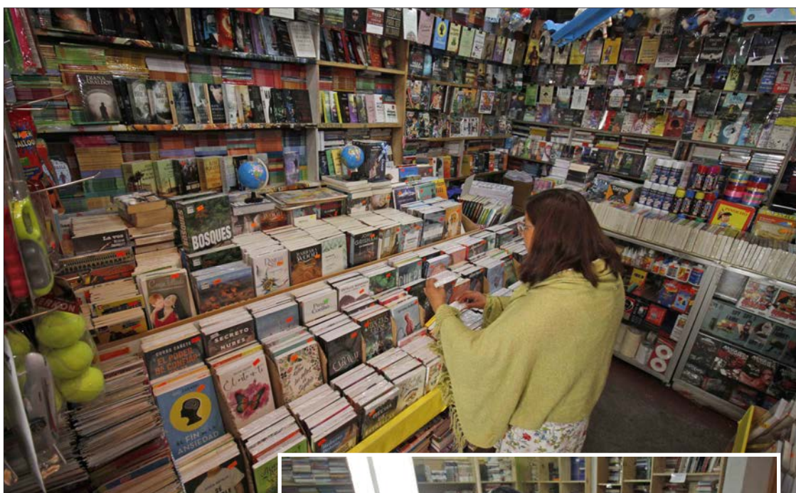
LIBRERÍA GLORIA ofrece a sus clientes obras nuevas, usadas y alternativas. Está en Colo-Colo, entre Maipú y Freire.