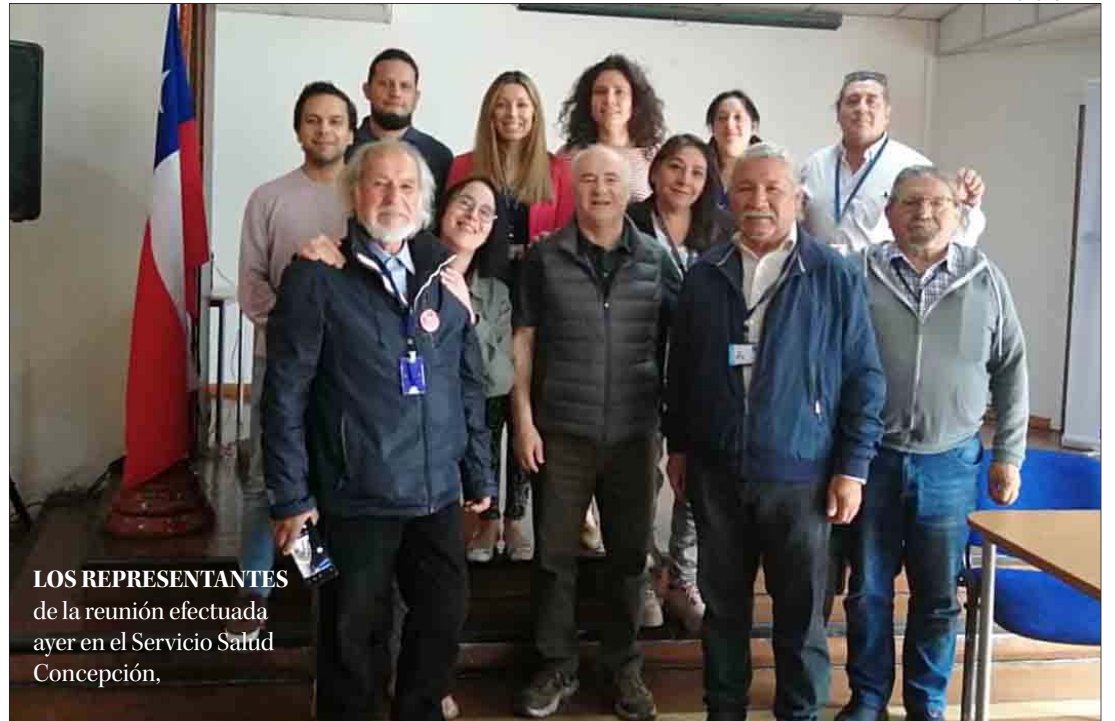
LOS REPRESENTANTES de la reunión efectuada ayer en el Servicio Salud Concepción,

"Ellos saben que tienen las puertas abiertas en demócratas, pero somos muy respetuosos de sus tiempos", cerró.