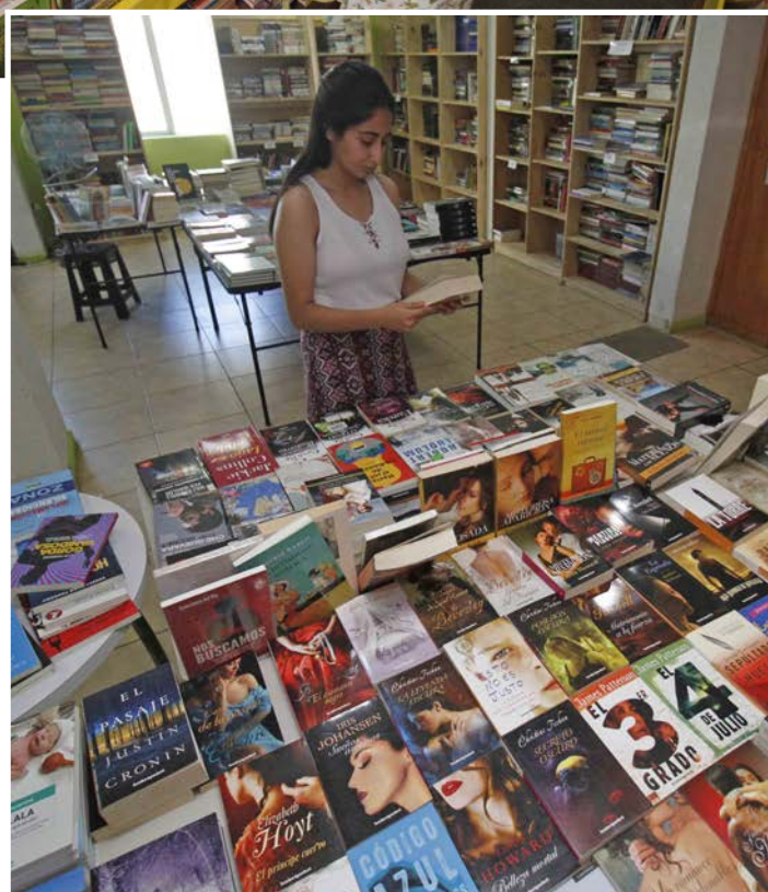
BOOKFAIL cuenta con una amplia oferta de títulos en el segundo piso de Angol #566, en el centro de Concepción.