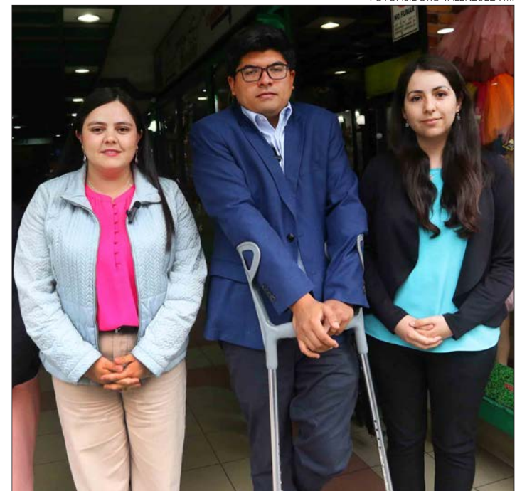
HASTA EL CENTRO DE CONCEPCIÓN llegaron los dirigentes del emergente PSC para completar la legalización de la colectividad.