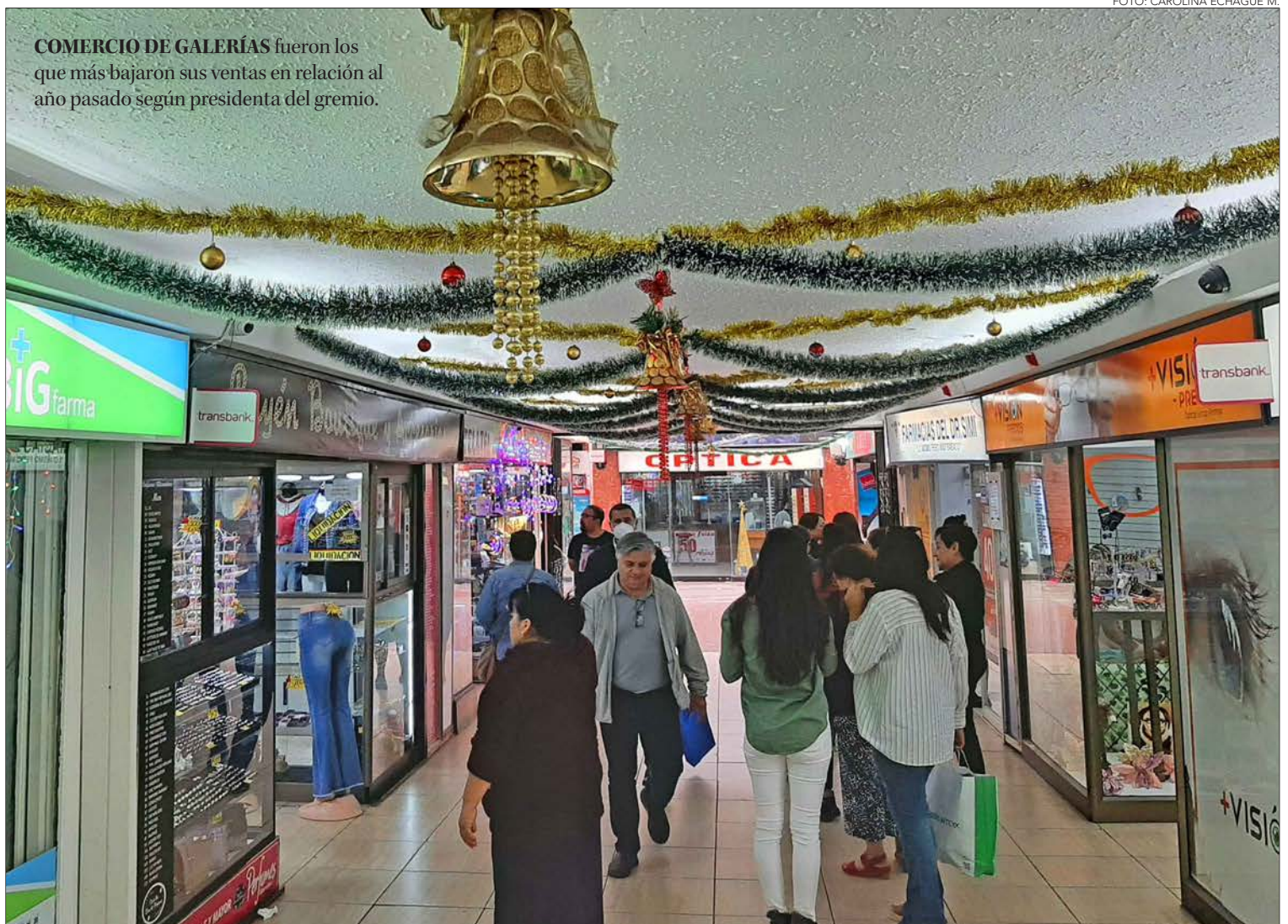
COMERCIO DE GALERÍAS fueron los que más bajaron sus ventas en relación al año pasado según presidenta del gremio.