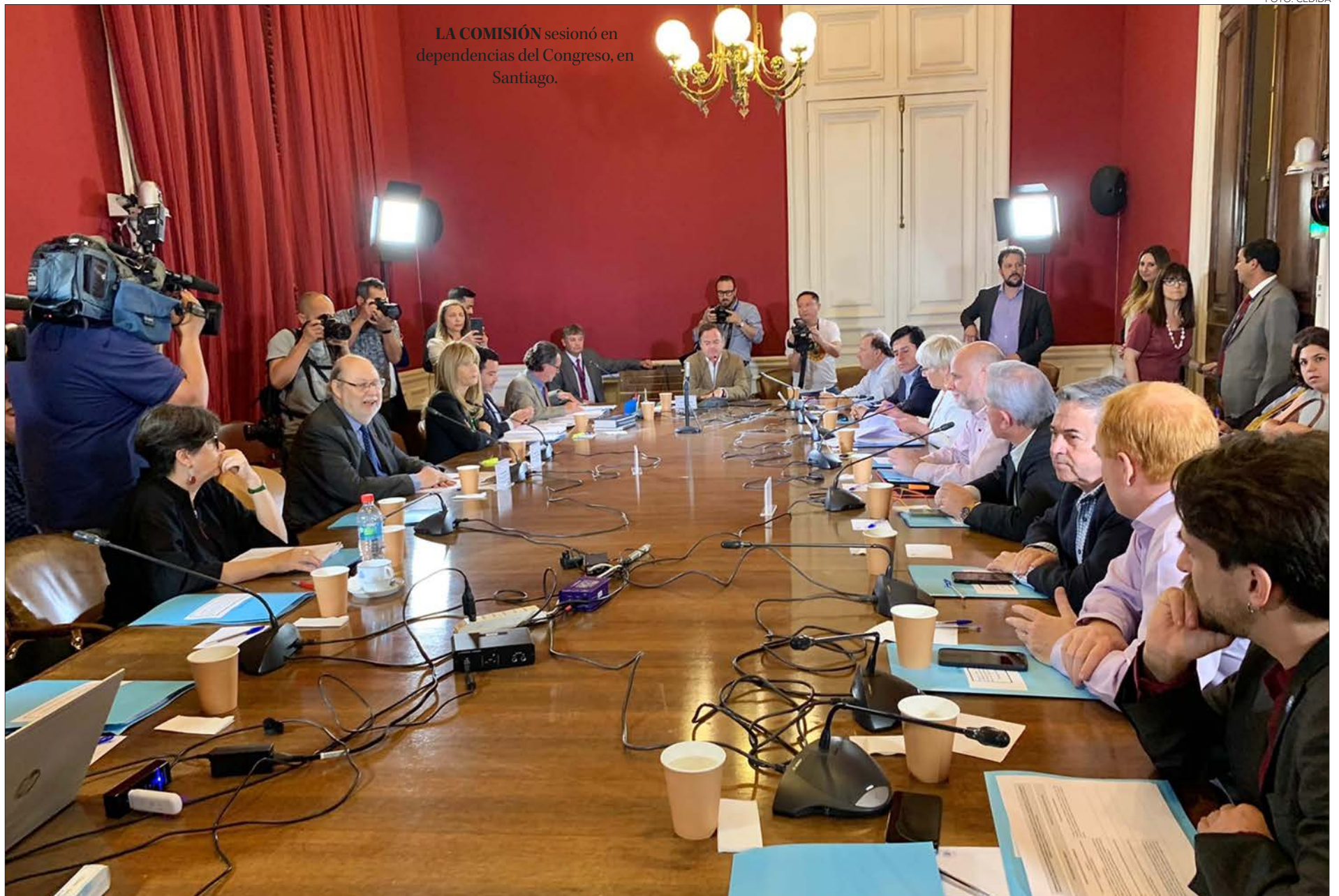
LA COMISIÓN sesionó en dependencias del Congreso, en Santiago.