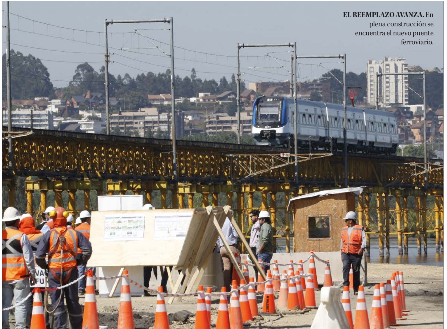
EL REEMPLAZO AVANZA. En plena construcción se encuentra el nuevo puente ferroviario.

En tanto la construcción del nuevo puente ferroviario será también, una vez terminado, un nuevo pun-