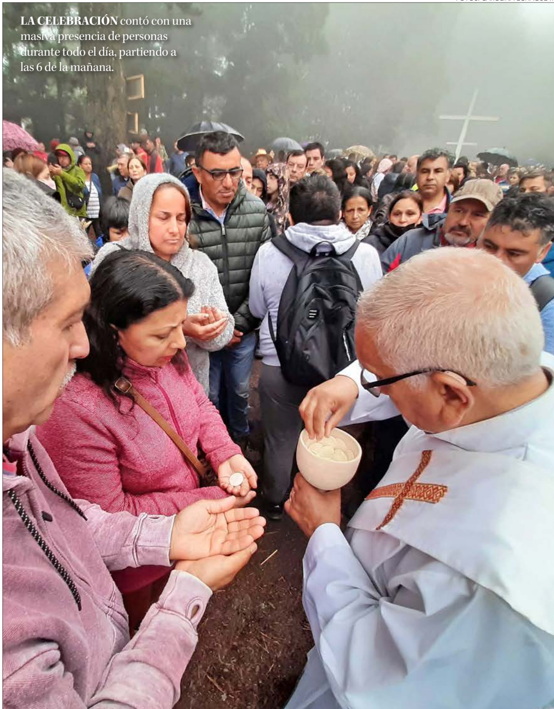
LA CELEBRACIÓN contó con una masiva presencia de personas durante todo el día, partiendo a las 6 de la mañana.

Hubo cortes de tránsito y presencia policial en el acceso al Santuario, pero el comercio ilegal igual se tomó Barros Arana y Lientur. Nada de ello importó a los devotos que concurrieron masivamente al Cerro La Virgen.