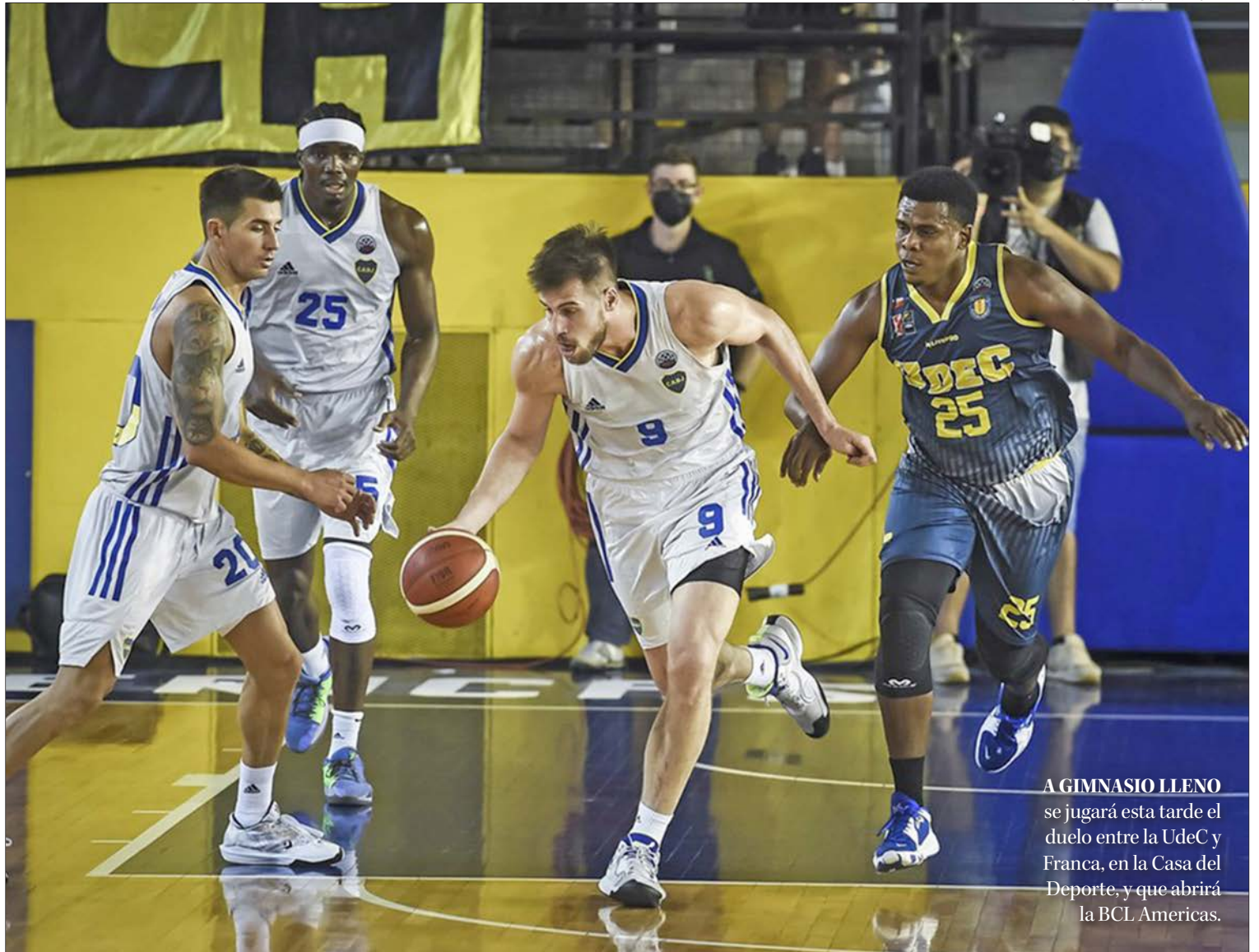
A GIMNASIO LLENO se jugará esta tarde el duelo entre la UdeC y Franca, en la Casa del Deporte, y que abrirá la BCL Americas.

HOY INICIA LA BCL AMERICAS EN CONCEPCIÓN