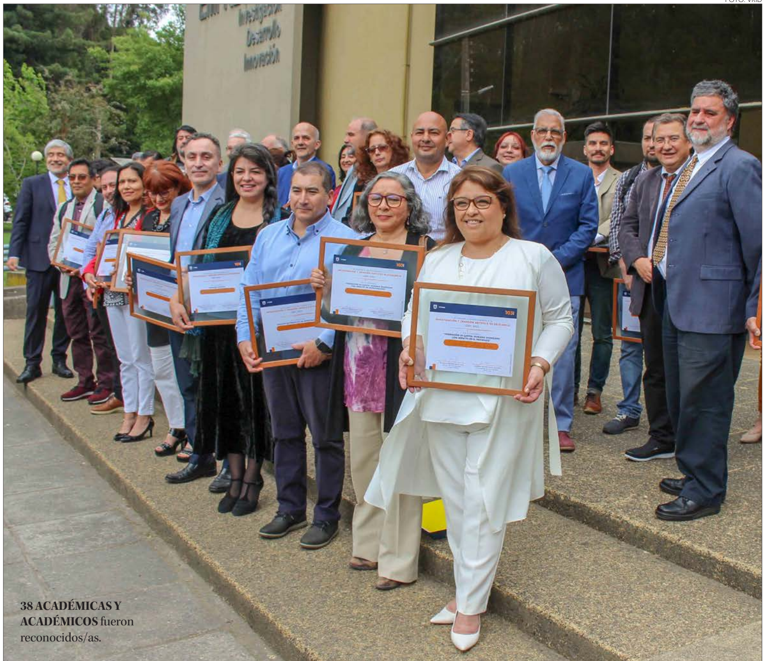
38 ACADÉMICAS Y ACADÉMICOS fueron reconocidos/as.

En la ceremonia se premiaron siete categorías: Publicaciones WoS, Impacto de las Publicaciones, Gestión de Proyectos de Investigación,