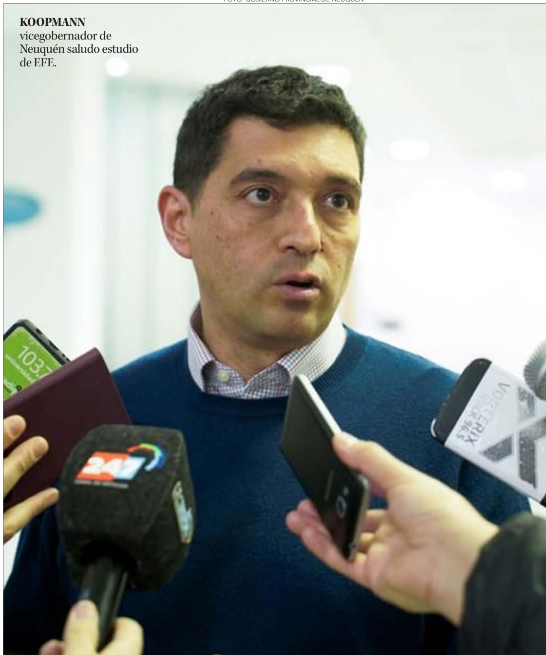
KOOPMANN vicegobernador de Neuquén saluda estudio de EFE.