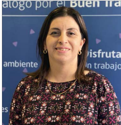
Lorena Segura, seremi de la Mujer y Equidad de Género.

“Tenemos tres casas de acogidas ubicadas en cada una de las provincias de la Región, donde se ofrece alojamiento y alimentación para aquellas mujeres que no cuentan con redes de apoyo, para ellas y sus hijos e hijas hasta los 14 años”.