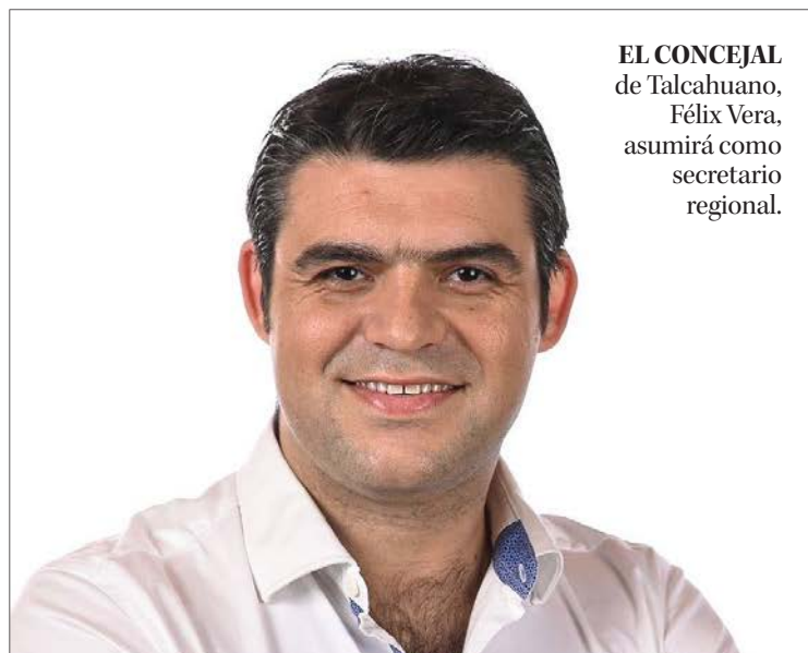
EL CONCEJAL de Talcahuano, Félix Vera, asumirá como secretario regional.