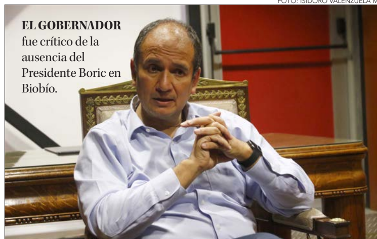
EL GOBERNADOR fue crítico de la ausencia del Presidente Boric en Biobío.