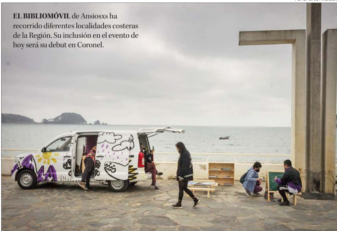
EL BIBLIOMÓVIL de Ansiosxs ha recorrido diferentes localidades costeras de la Región. Su inclusión en el evento de hoy será su debut en Coronel.