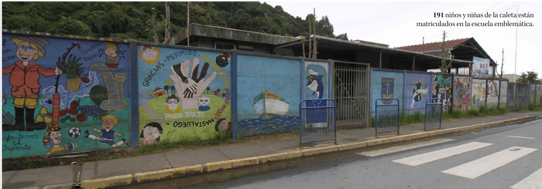
191 niños y niñas de la caleta están matriculados en la escuela emblemática.