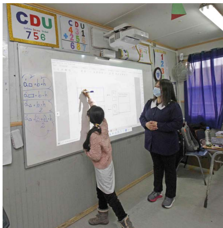
EXCELENCIA académica otorgada por el Mineduc en los últimos 5 años.

Producción: Silvanio Mariani / Raphael Sierra