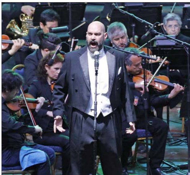
EL BARÍTONO Rodolfo Giuliani interpretó en la primera parte del programa “Cortigiani vil razza” la ópera Rigoletto.