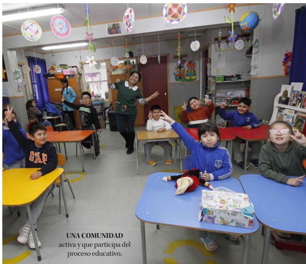
UNA COMUNIDAD activa y que participa del proceso educativo.

PROYECTO FINANCIADO POR EL FONDO DE MEDIOS DE COMUNICACIÓN 2022: