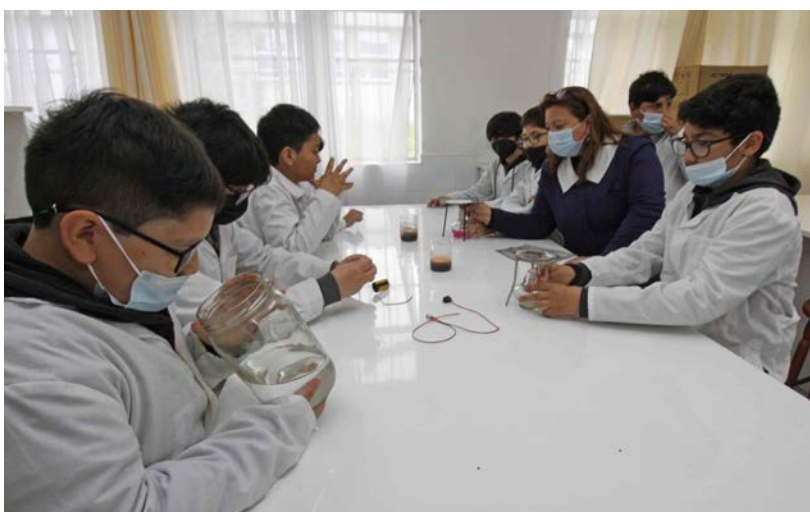
CIENCIAS en la práctica: proyecto educacional apuesta por la formación integral.