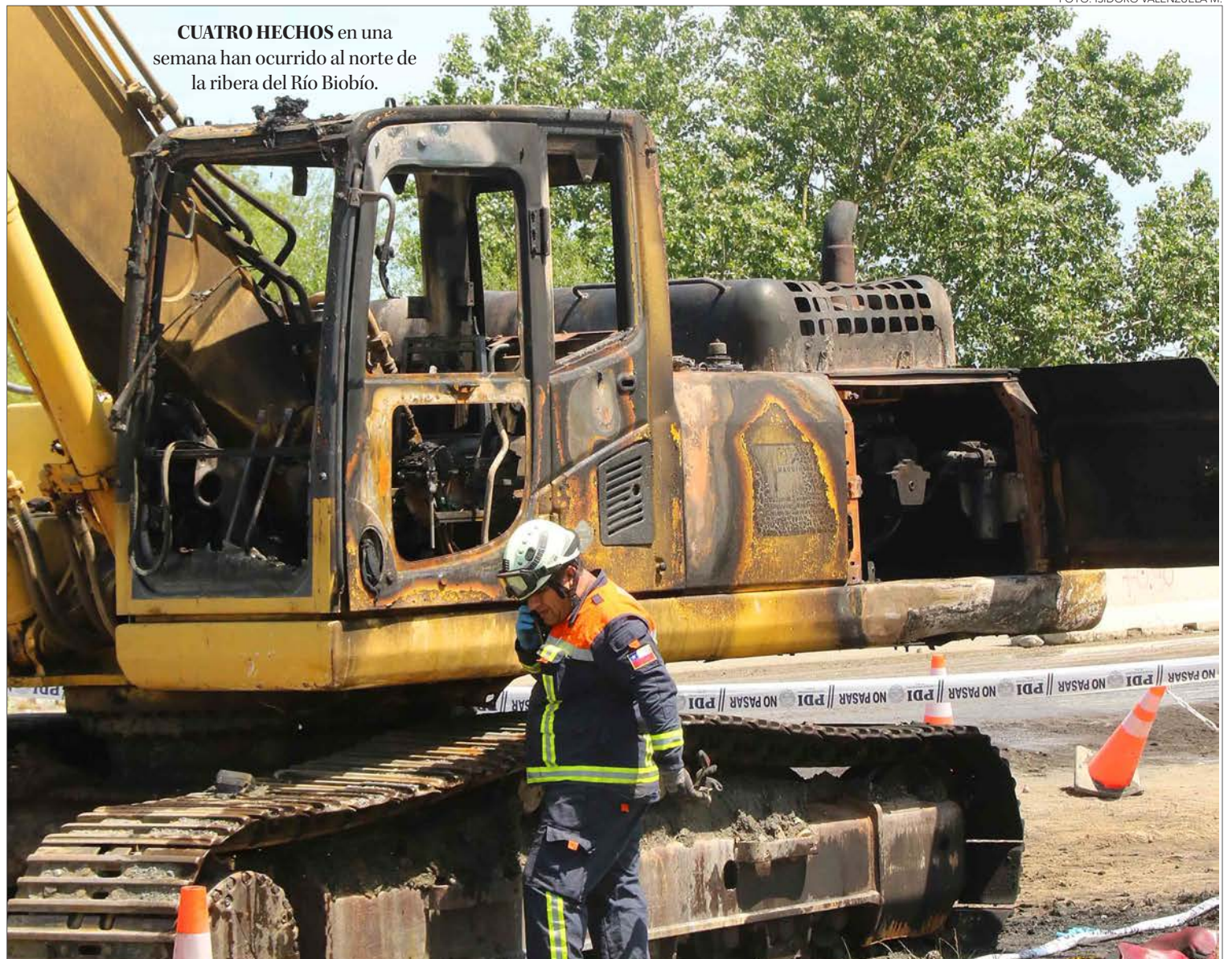
CUATRO HECHOS en una semana han ocurrido al norte de la ribera del Río Biobío.

caciones que mencionan a personas ligadas a la causa mapuche. Y la visión que existe en las autoridades en la zona, es dispar.