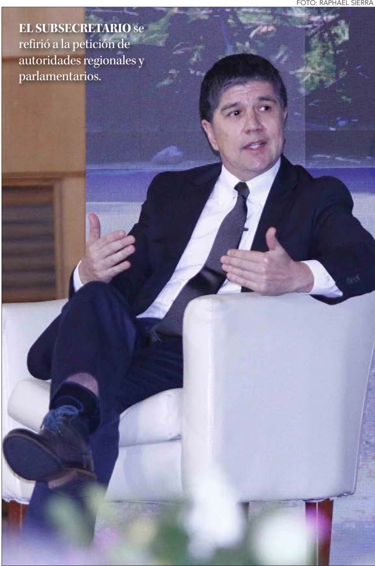
EL SUBSECRETARIO se refirió a la petición de autoridades regionales y parlamentarios.