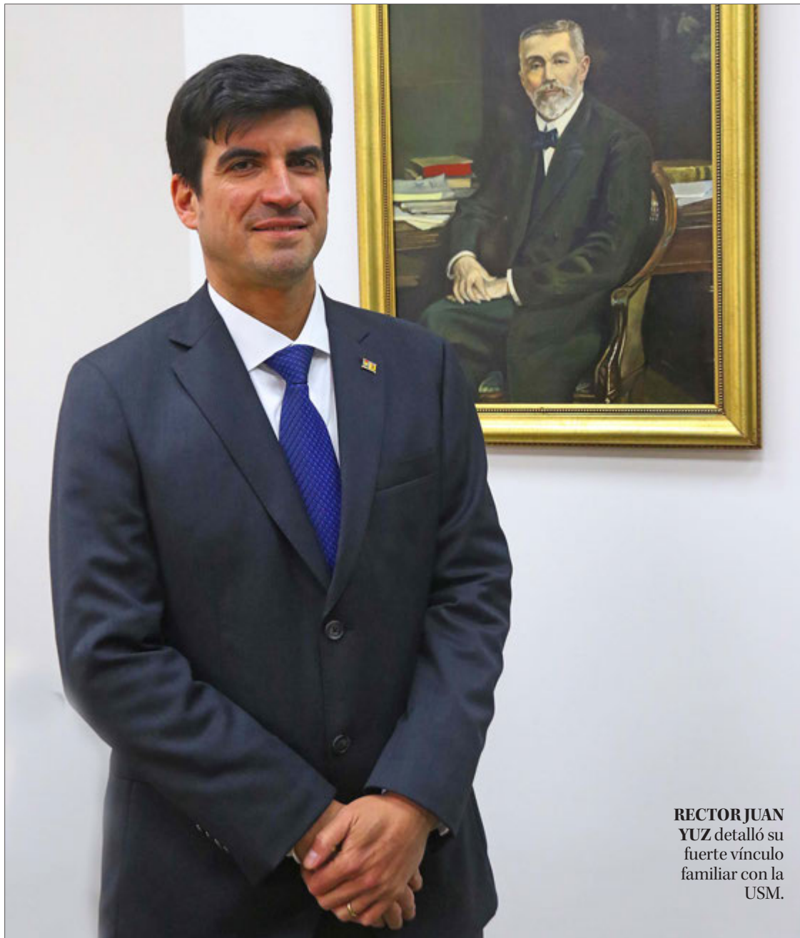
RECTOR JUAN YUZ detalló su fuerte vínculo familiar con la USM.

El contexto económico nacional e internacional, sobre todo político, a nivel nacional, es complejo. Pero, la universidad ha sobrevivido a otras épocas y las medidas que nos toque tomar como administración, debido a este contexto, serán explicadas a colegas, estudiantes y funcionarios. Imagino que si todos estamos alineados con el bien superior de la institución, entenderemos que habrá que hacer esfuerzos y tomar medidas. Tal vez, no muy populares en algún momento o habrá que postergar intereses de desarrollo. Entendemos la estrechez presupuestaria del Estado en esta época. Nos preocupa que el aumento de los aportes planteados en el presupuesto de la Nación, estén por