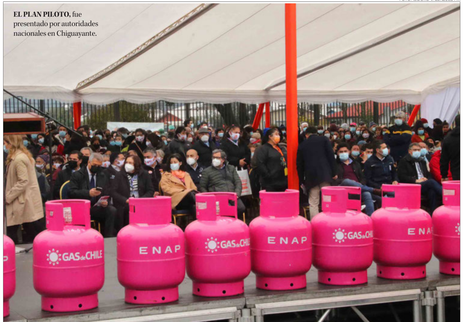
EL PLAN PILOTO , fue presentado por autoridades nacionales en Chiguayante.

queremos, pero vamos a presionar para que tenga un nuevo impulso”.