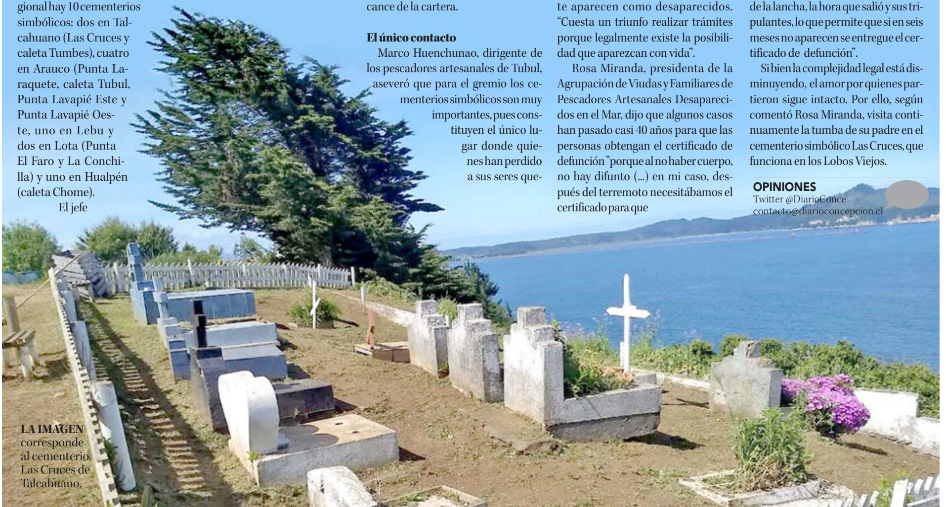
LA IMAGEN corresponde al cementerio Las Cruces de Talcahuano.

Twitter @DiarioConce contacto@diarioconcepcion.cl