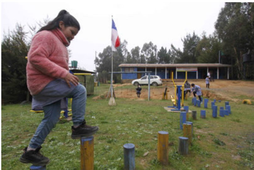
CON APOYO de la comunidad, Servicio Local Andalién Sur y donaciones de una empresa forestal fue posible construir el patio para juegos y deportes.

Producción: Silvanio Mariani / Raphael Sierra