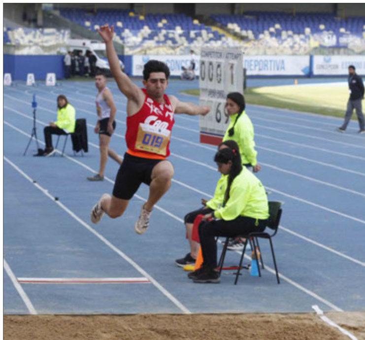
EL SALTO LARGO captó la atención los asistentes.

Cerca de un centenar de deportistas nacionales y extranjeros animaron la quinta edición del evento atlético internacional.