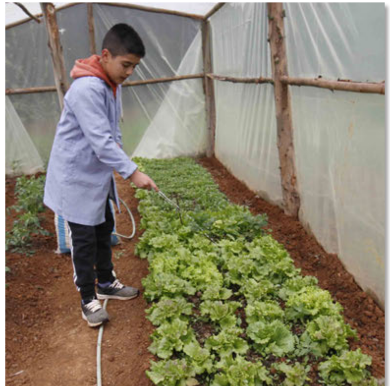
INVERNADERO Producción de lechugas como recurso pedagógico y para consumo de la comunidad escolar.

PROYECTO FINANCIADO POR EL FONDO DE MEDIOS DE COMUNICACIÓN 2022: