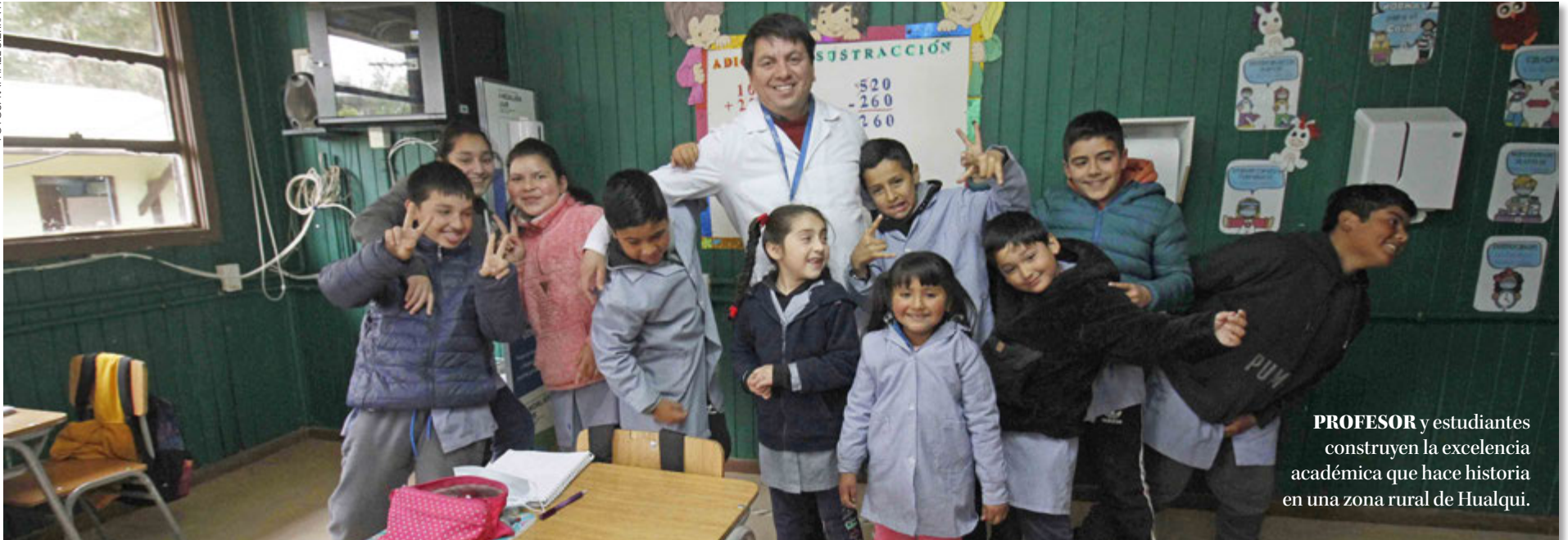
PROFESOR y estudiantes construyen la excelencia académica que hace historia en una zona rural de Hualqui.