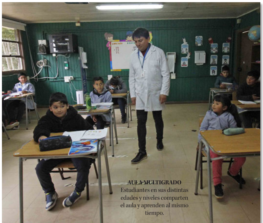
AULA MULTIGRADO Estudiantes en sus distintas edades y niveles comparten el aula y aprenden al mismo tiempo.