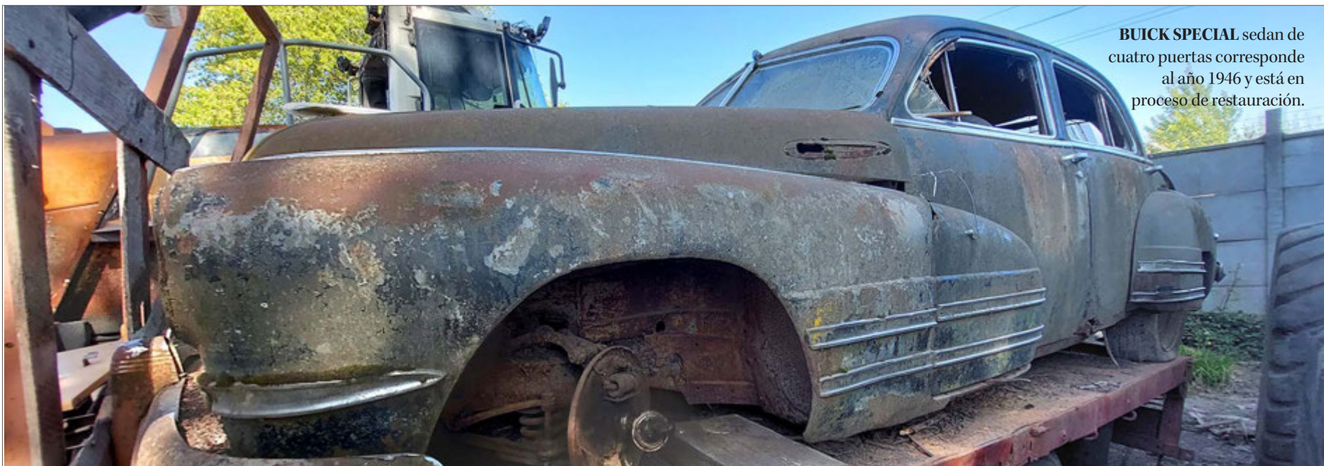
BUICK SPECIAL sedan de cuatro puertas corresponde al año 1946 y está en proceso de restauración.