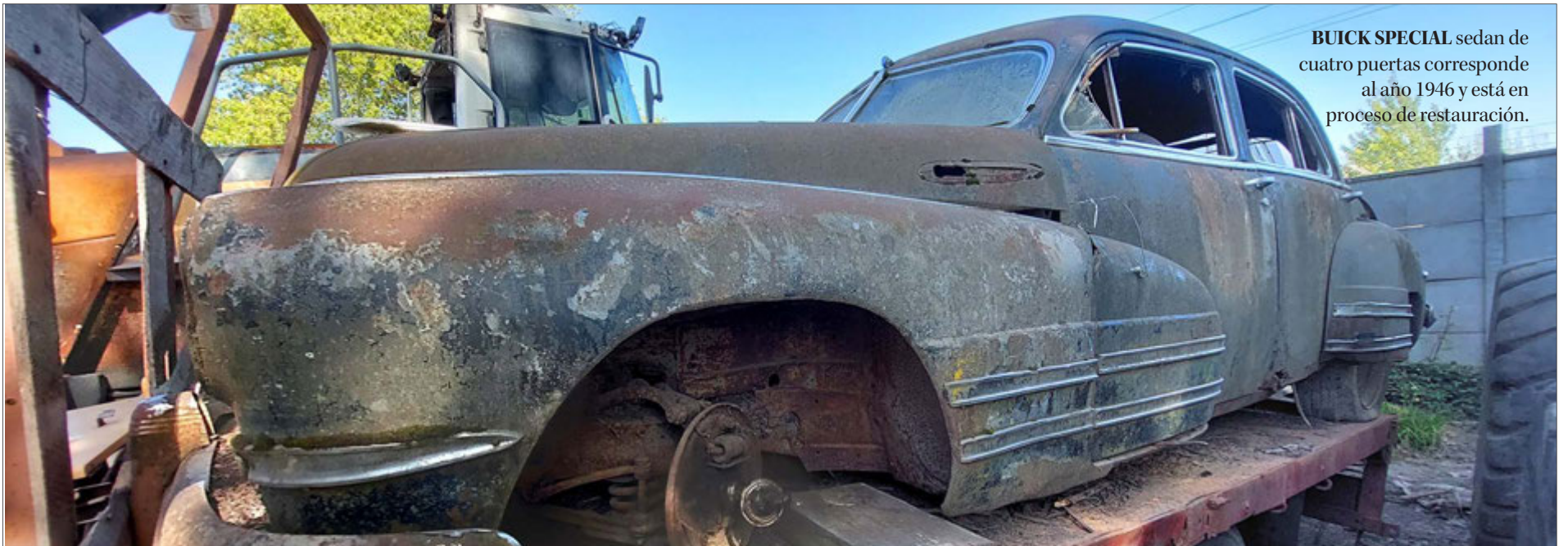
BUICK SPECIAL sedan de cuatro puertas corresponde al año 1946 y está en proceso de restauración.