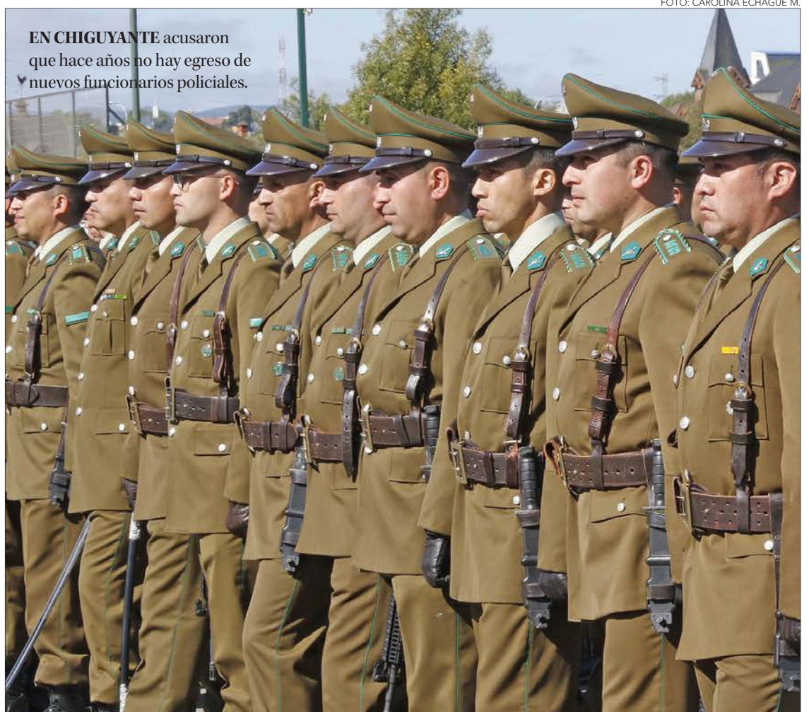
EN CHIGUYANTE acusaron que hace años no hay egreso de nuevos funcionarios policiales.

En Coronel van más allá, pues el alcalde anunció estudios para la creación de una policía municipal.