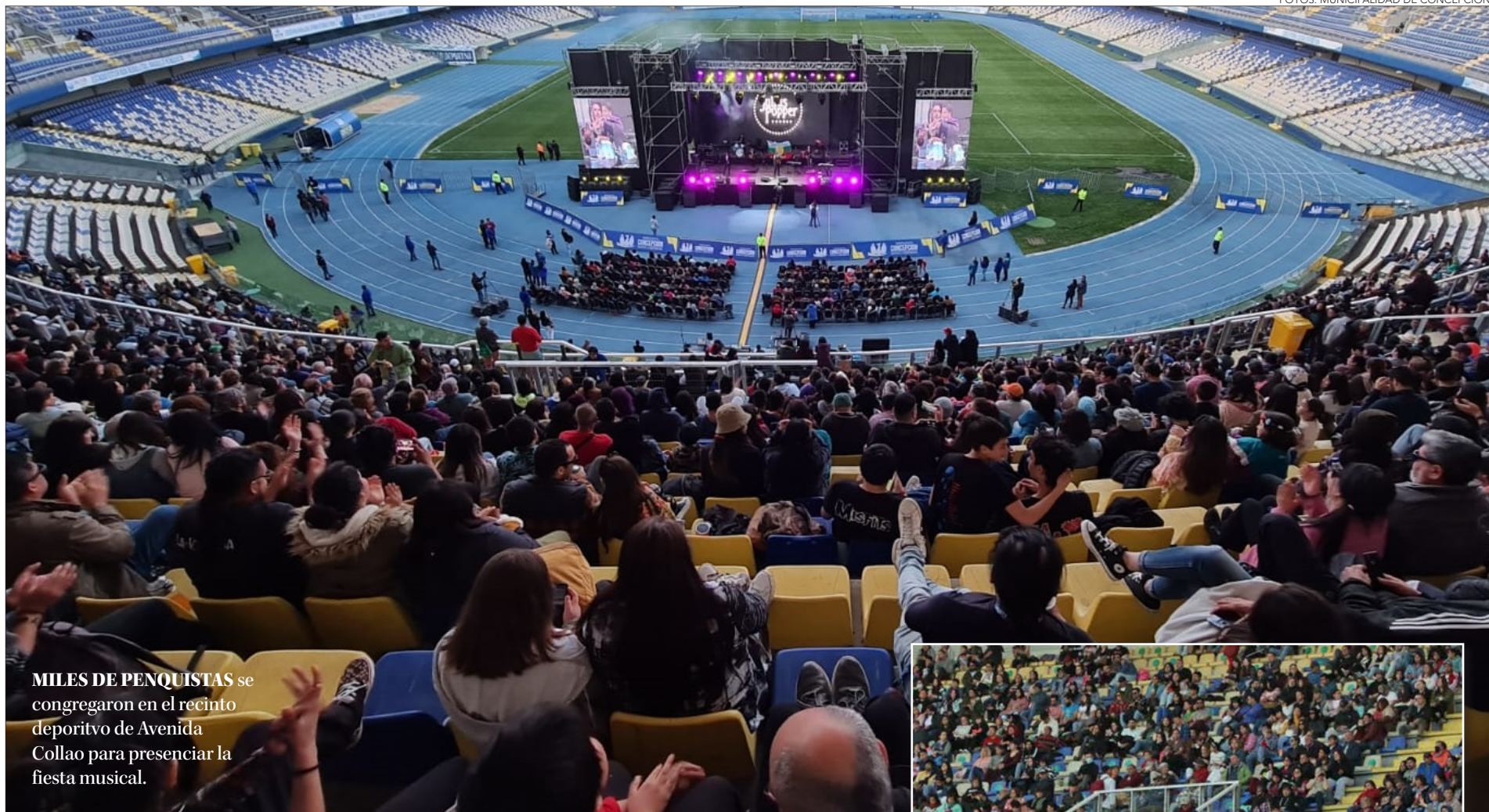
MILES DE PENQUISTAS se congregaron en el recinto deportivo de Avenida Collao para presenciar la fiesta musical.

Diario Concepción contacto@diarioconcepcion.cl