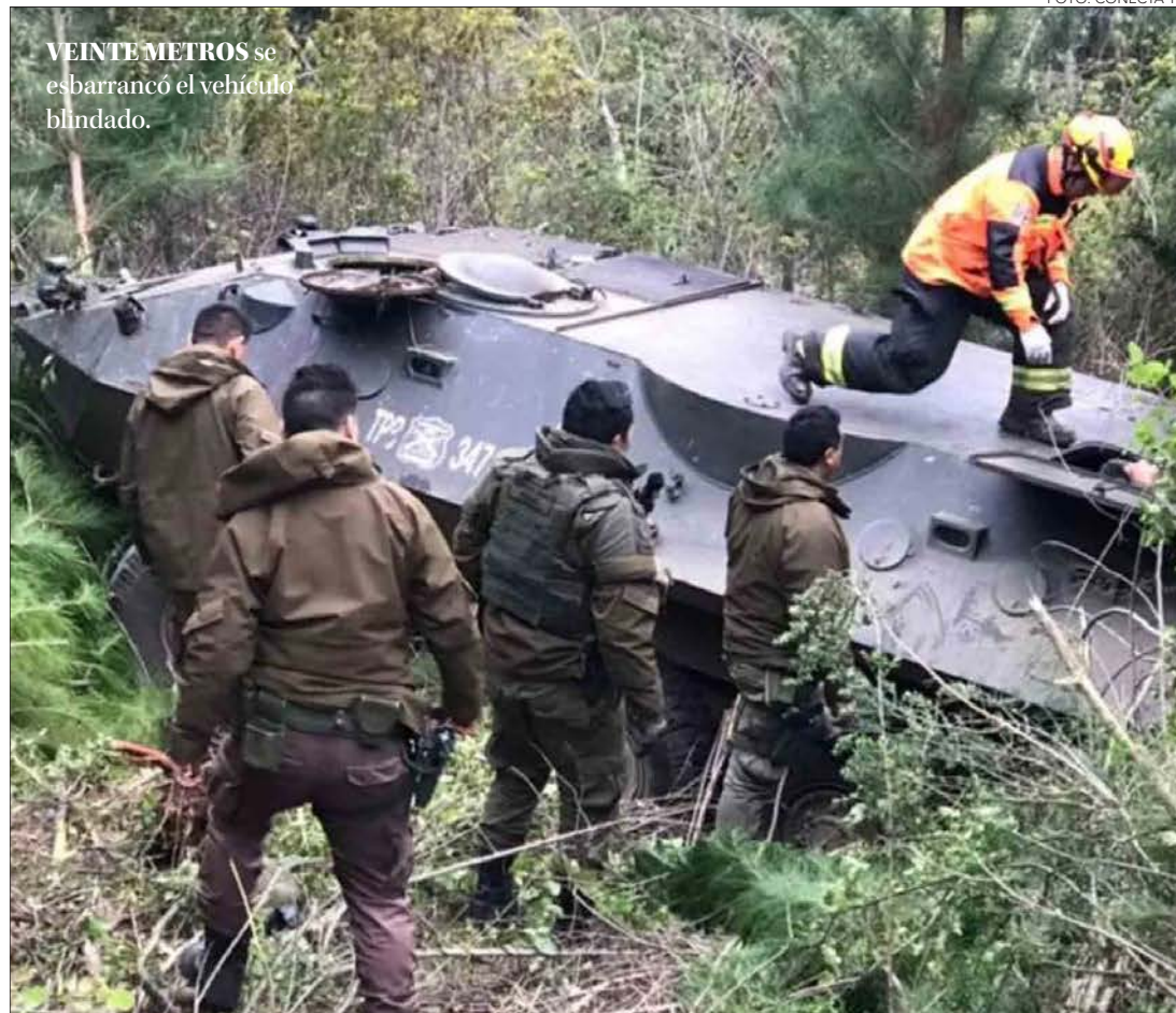
VEINTE METROS se esbarrancó el vehículo blindado.