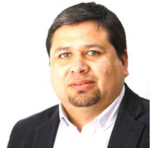
HEDSON DÍAZ Seremi de Desarrollo Social del Biobío

Estamos seguros que ésta es la forma de construir una región más segura, justa y unida, avanzando con diálogo social y de forma transparente.