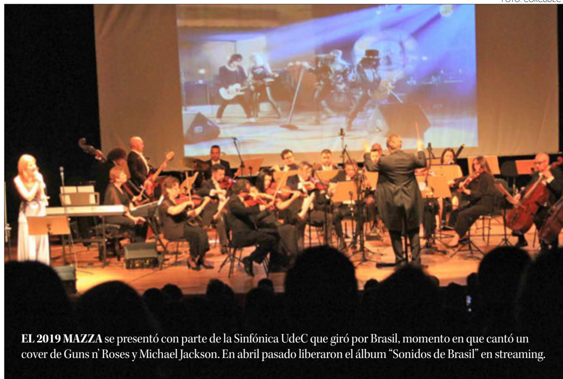
EL 2019 MAZZA se presentó con parte de la Sinfónica UdeC que giró por Brasil, momento en que cantó un cover de Guns n' Roses y Michael Jackson. En abril pasado liberaron el álbum "Sonidos de Brasil" en streaming.

La orquesta penquista ofrecerá un repertorio de reconocidas canciones del país carioca teniendo como invitada a la intérprete brasileña. Prolífica unión nació el 2019 y posteriormente pasó a la virtualidad de las temporadas online 2020 - 2021 de Corcudec y también a las plataformas digitales de música como Spotify.