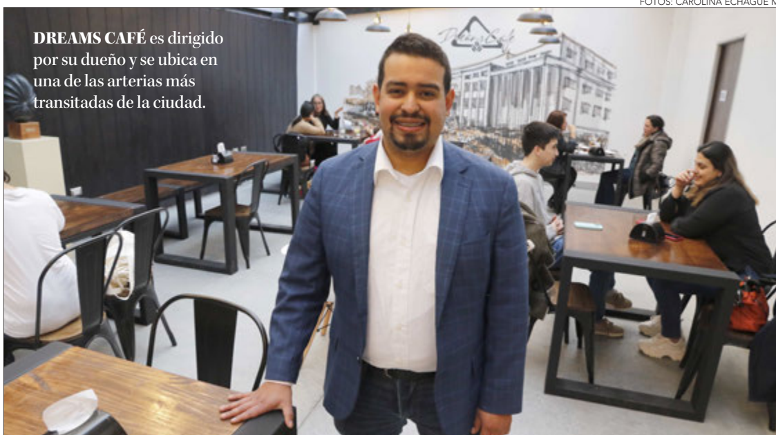
DREAMS CAFÉ es dirigido por su dueño y se ubica en una de las arterias más transitadas de la ciudad.

Girgin espera abrir otros locales y continuar generando empleo en la comuna donde comenta que la clave ha sido poner el énfasis en un genuino interés por el bienestar de sus clientes más que en el crecimiento del negocio. “Cliente bien, yo