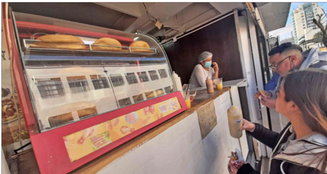
LA DINASTÍA DEL SABOR ofrece empanadas típicas venezolanas al paso cuyo aroma cautiva los paladares penquistas.

bien”, explicó entre su idioma natal y su español avanzado.