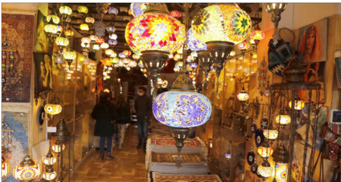
CASA TURCA llama la atención de transeúntes por sus bellas lámparas y alfombras características de ese país.